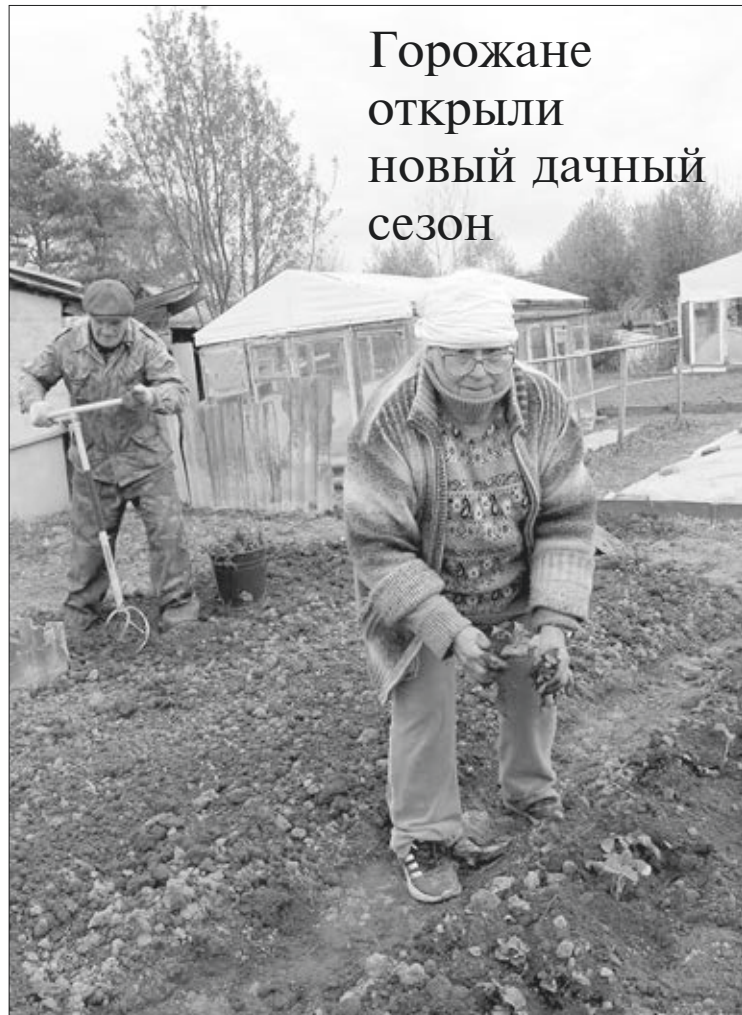
Горожане открыли новый дачный сезон

Автобусы до всех СОТов пустили с 24 апреля — сначала по укороченному расписанию, но уже с 13 мая они перешли на летний график. Впрочем, большинство садоводов-огородников не ждали этого: личный автомобиль сейчас едва ли не в каждой семье.