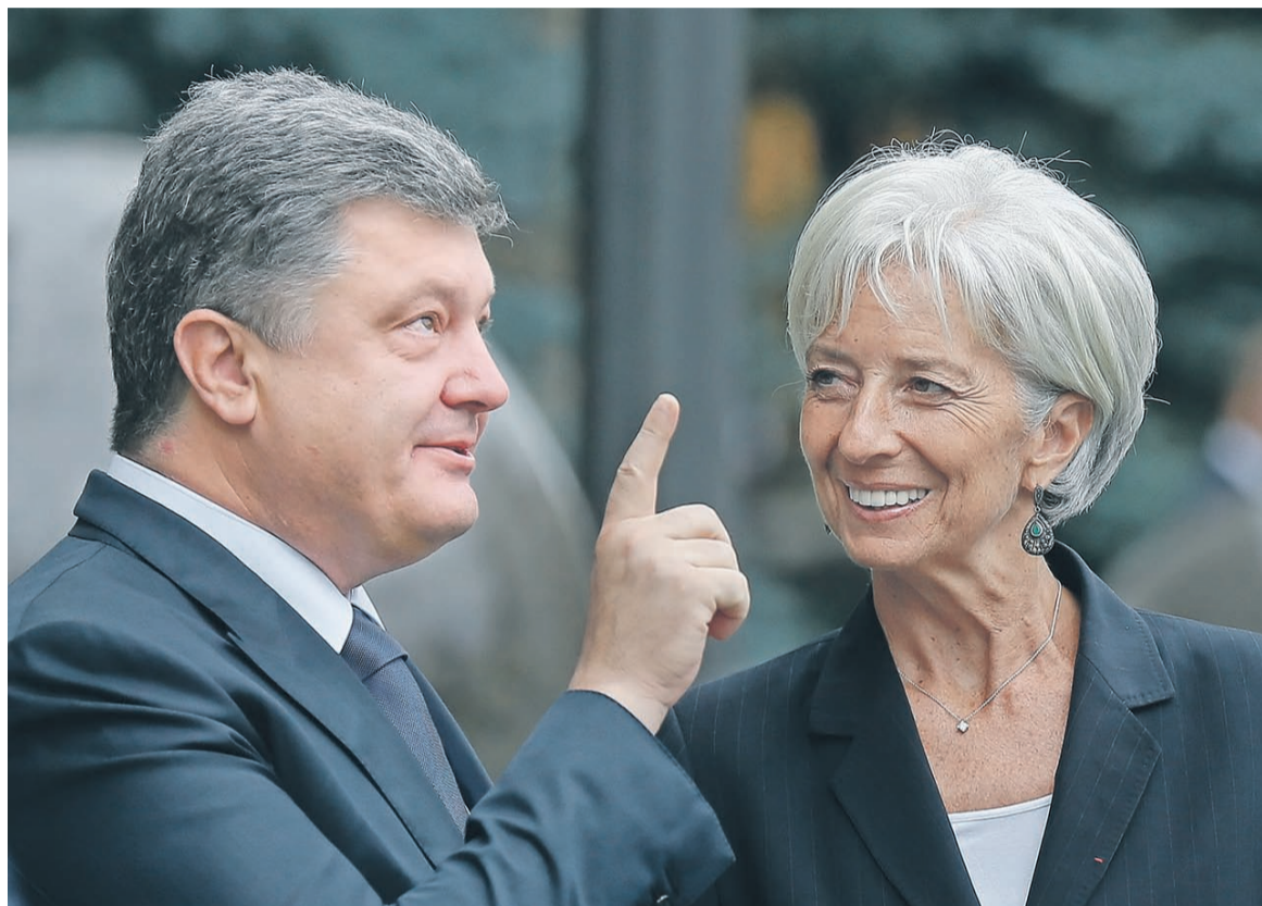
Еще несколько дней назад непогашенная задолженность перед другими государствами и международными институтами не позволяла рассчитывать должнику (слева — президент Украины Петр Порошенко) на продолжение заимствований у МВФ (справа — глава фонда Кристина Лагард)

Решение МВФ позволит продолжить кредитование Украины в случае невыплаты ею долга России по