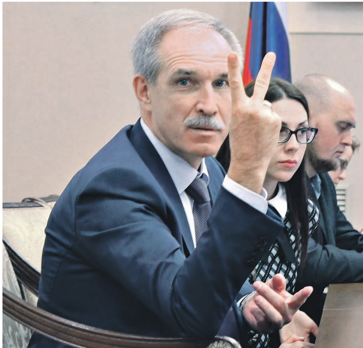
Губернатор Ульяновской области Сергей Морозов, и в прошлый раз занявший место в нижней части рейтинга, из-за проверок Счетной палаты опустился еще на три пункта