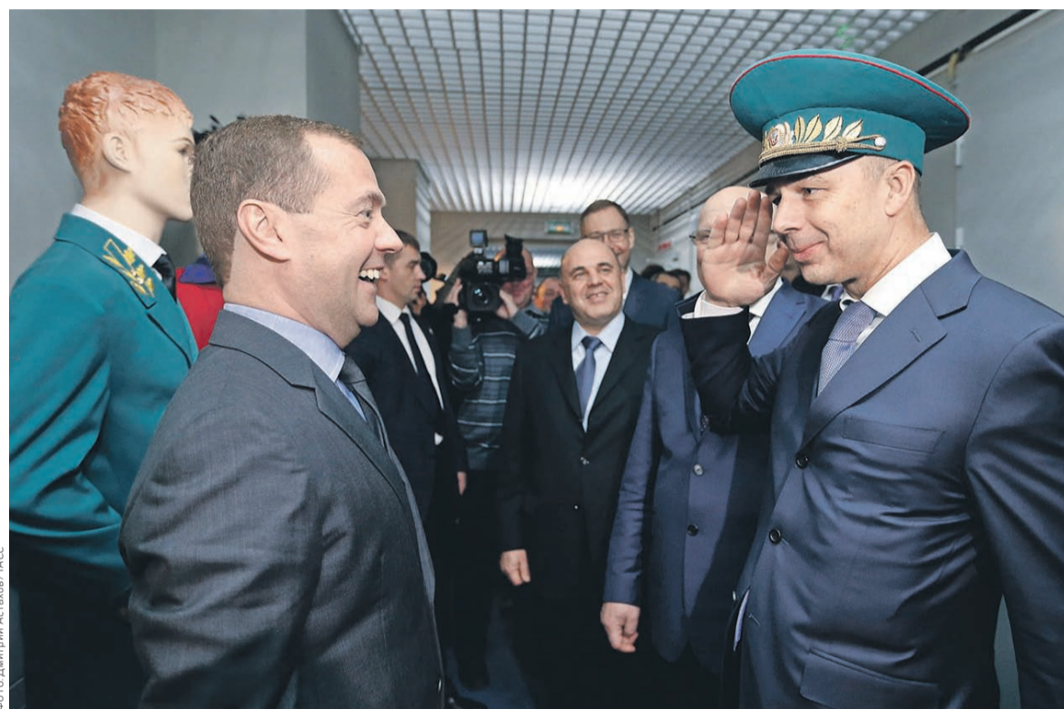
Минфину ничего не остается, как следовать за позицией Минтруда по уплате страховых сборов. На фото — председатель правительства Дмитрий Медведев (слева) и глава Минфина Антон Силуанов (справа)

Октябрьское письмо Минфина, которое показывали в налоговой, посвящено льготе, которой пользуются индивидуальные