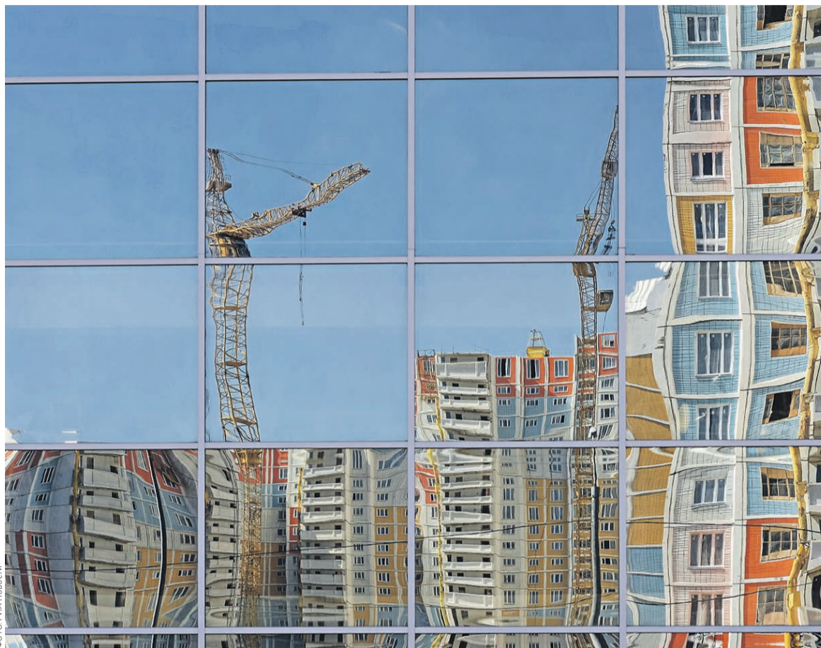
У СУ-155 есть непроданные квартиры на 24 млрд рублей

Детали схемы санации группы СУ-155 в сообщении Минстроя не указаны. В банке «Российский капитал» и группе БИН оперативных комментариев в среду вечером получить не удалось. Окончательное решение было принято на совещании, состоявшемся в среду днем, рассказал РБК источник, близкий к банку «Российский капитал».