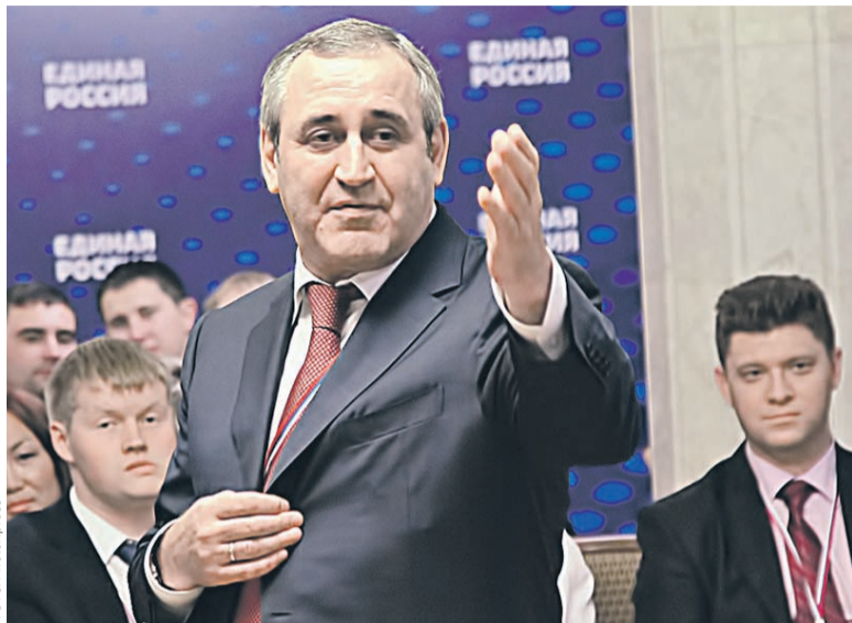
↑ Сергей Неверов

Зампред Госдумы, секретарь генсовета «Единой России». В 1995 году он приехал в Москву во время шахтерской забастовки и «стучал каской» на Горбатов мосту. В 1999-м впервые был избран в Госдуму. Впоследствии несколько раз безуспешно боролся за пост губернатора Кемеровской области с Аманом Тулеевым. В 2007 году был избран в Госдуму. В октябре 2011 года сменил перешедшего на пост вице-преьера Вячеслава Володина на посту секретаря генсовета партии. Возглавляет предвыборные штабы единороссов, курирует партийную работу в регионах