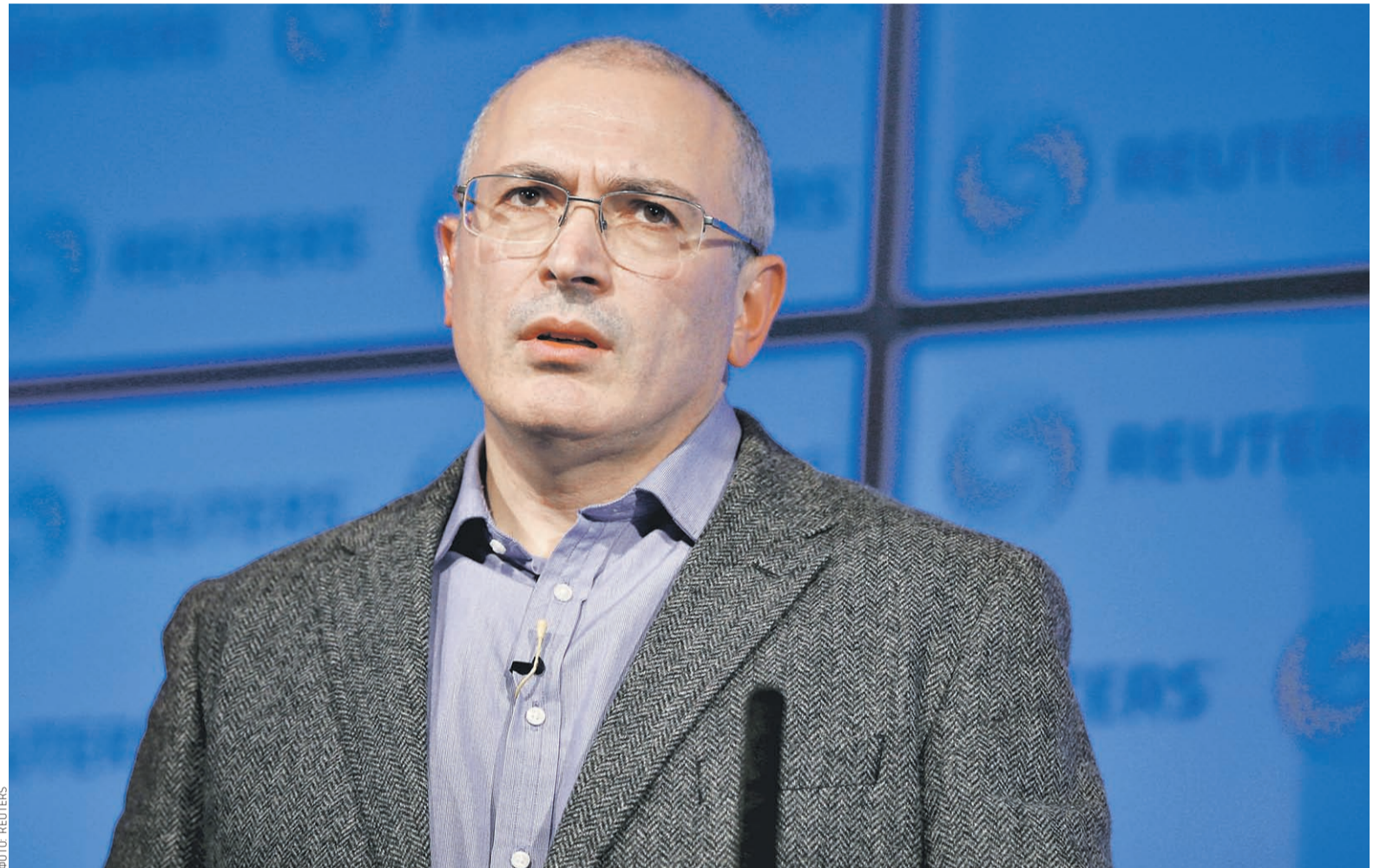
В связи с новыми обвинениями Михаил Ходорковский, возможно, попросит политического убежища в Великобритании

8 декабря Ходорковский опубликовал в своем аккаунте в Twitter по-