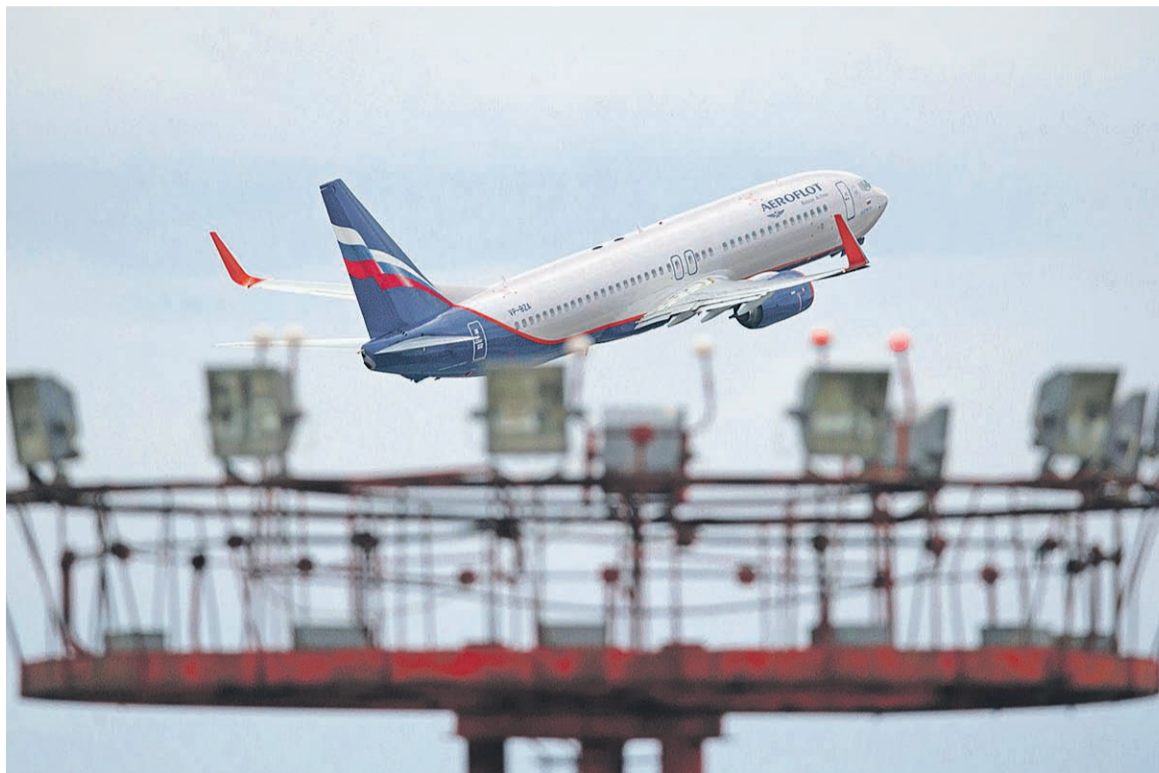
По мнению ФАС, рост цен на билеты «Аэрофлота» совпал с уходом с рынка авиакомпании «Трансаэро»

Когда у второй по объему перевозок российской авиакомпании «Трансаэро» 26 октября был отозван сертификат эксплуатанта, Росавиация передала 53 зарубежных маршрута «Трансаэро» «Аэрофлоту», ФАС выступала против того, чтобы отдавать компании сразу все направления, добавил Артемьев. «Там, где конкуренция — отдать «Аэрофлоту», чтобы он свои убытки таким образом компенсировал. Но отдали все чохом, со-