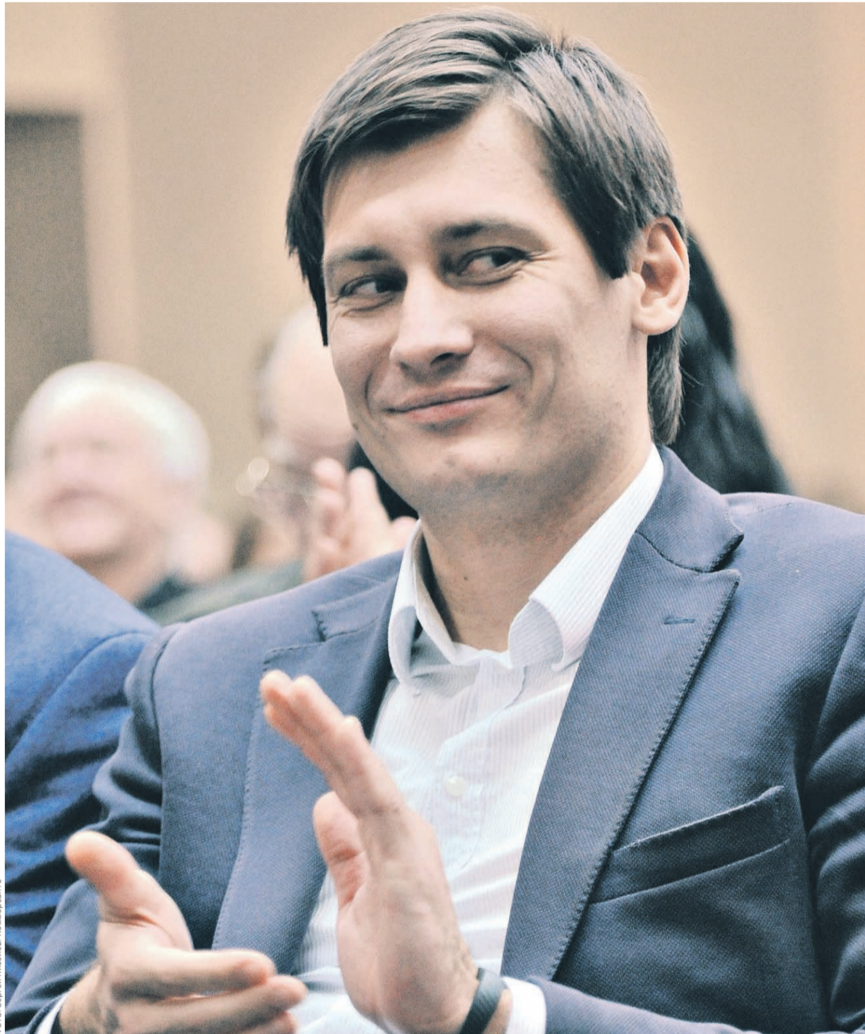
↑ Дмитрий Гудков

Бывший министр труда и социального развития в правительстве Сергея Кириенко. Неоднократно избиралась в Госдуму. В 2006 году вошла в «Справедливую Россию». В марте 2015 года покинула партию по собственному желанию, после того как была смещена с поста руководителя отделения в Санкт-Петербурге. Причинами этого решения в «Справедливой России» назвали нецелевое расходование партийных средств. В мае объявила о создании собственной «Партии профессионалов»