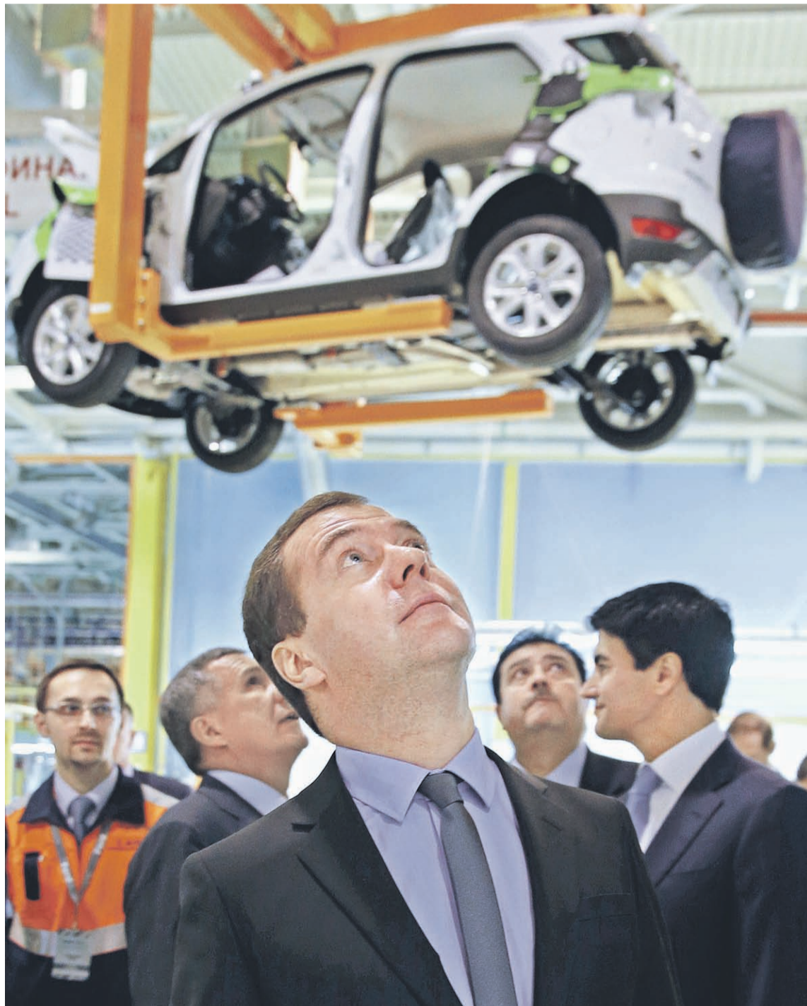
Дилеры просят у Дмитрия Медведева выделять на программу льготного автокредитования не менее 10 млрд рублей на квартал