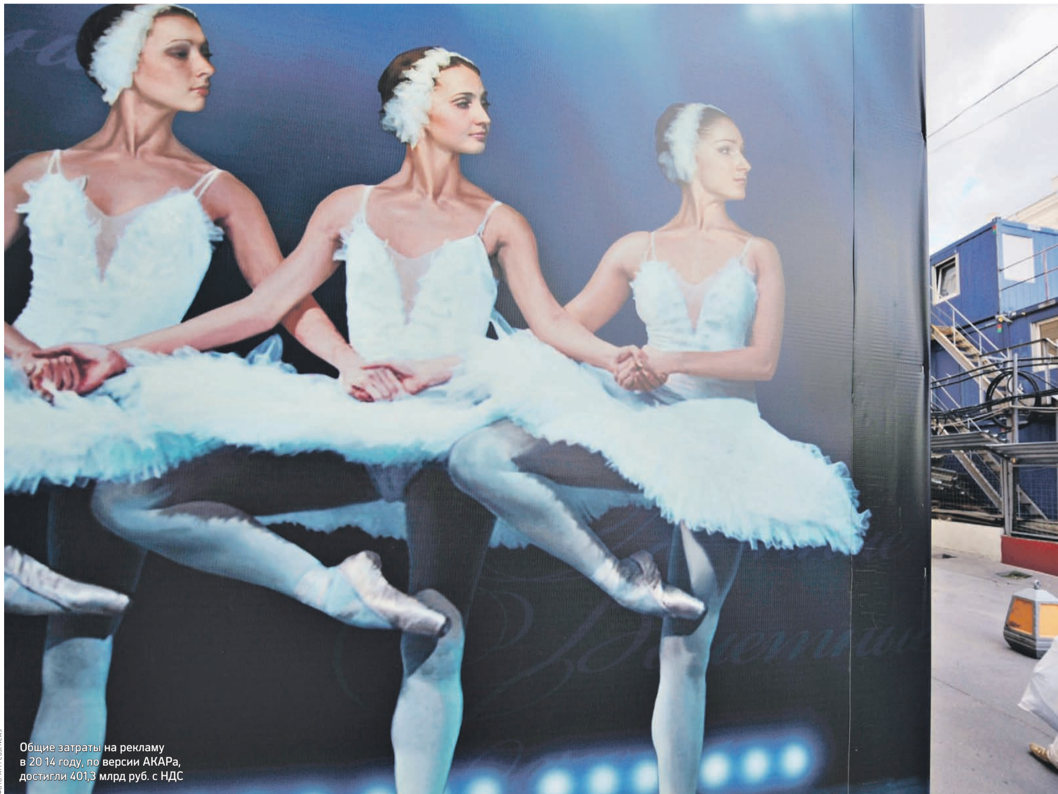
Общие затраты на рекламу в 2014 году, по версии АКРА, достигли 401,3 млрд руб. с НДС