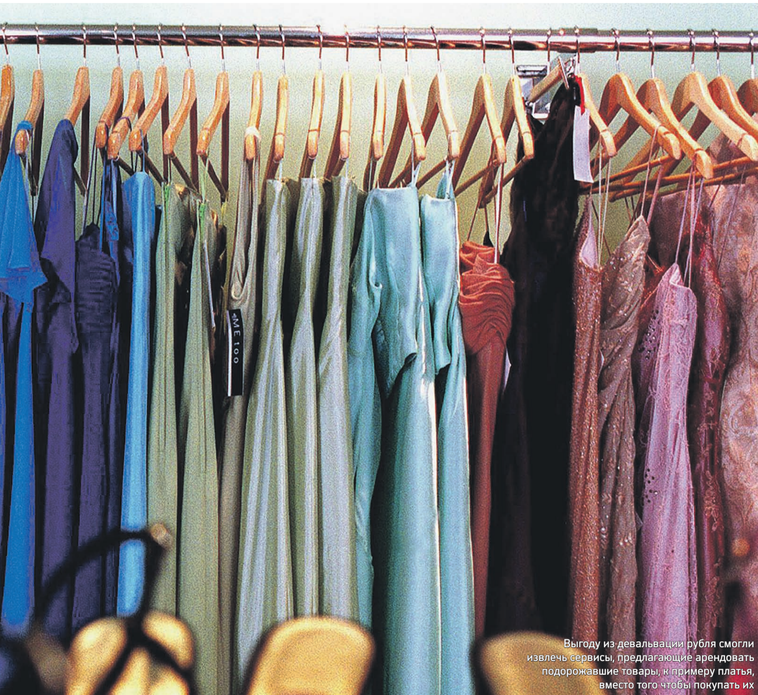
Выгоду из девальвации рубля смогли извлечь сервисы, предлагающие арендовать подорожавшие товары, к примеру платья, вместо того чтобы покупать их