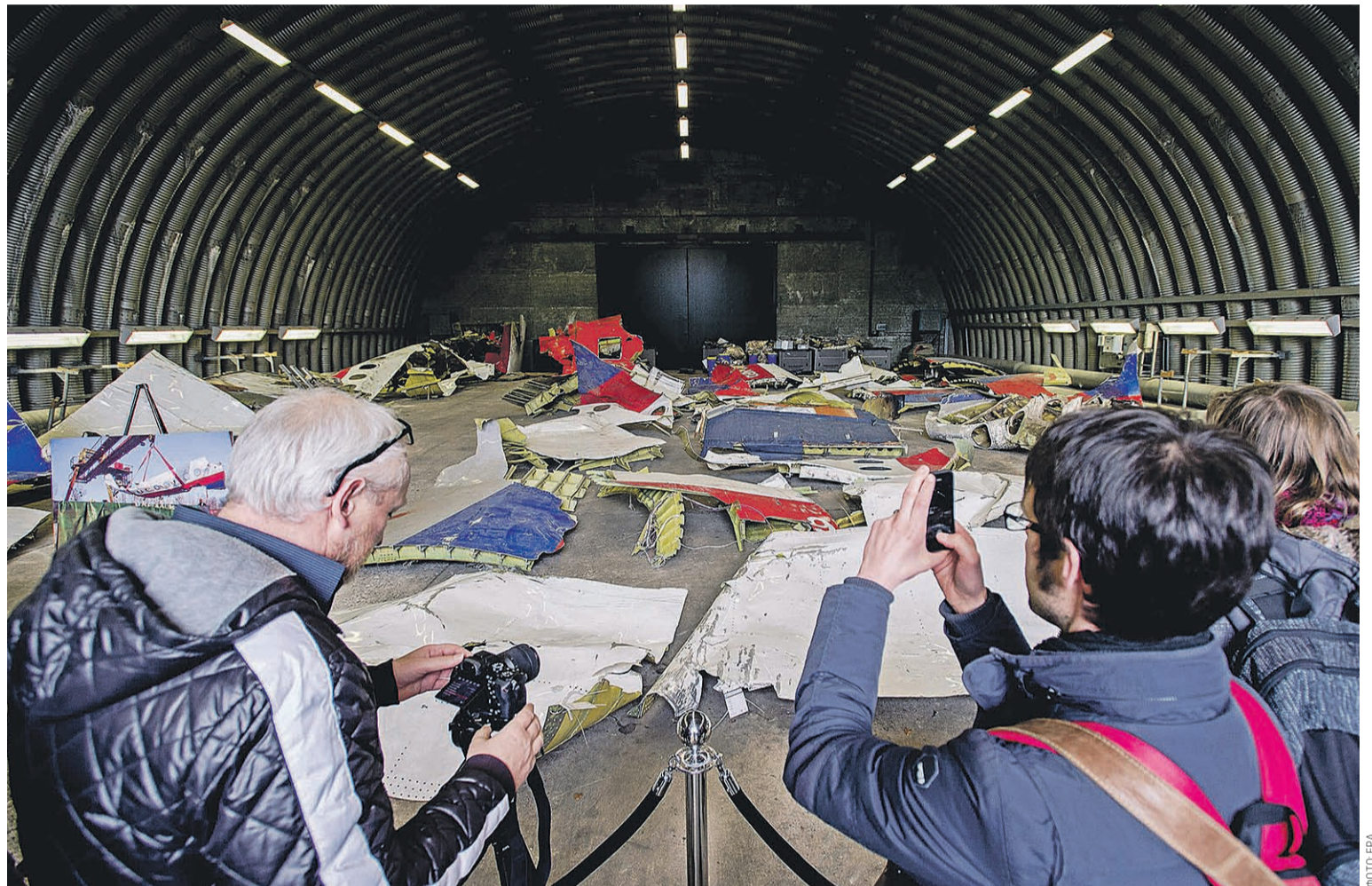
Следователи подчеркивают, что однозначные выводы о причинах авиакатастрофы рейса MH17 делать пока рано

ГЕОРГИЙ МАКАРЕНКО, АЛЕКСАНДР РАТНИКОВ, ПОЛИНА ХИМШАШВИЛИ