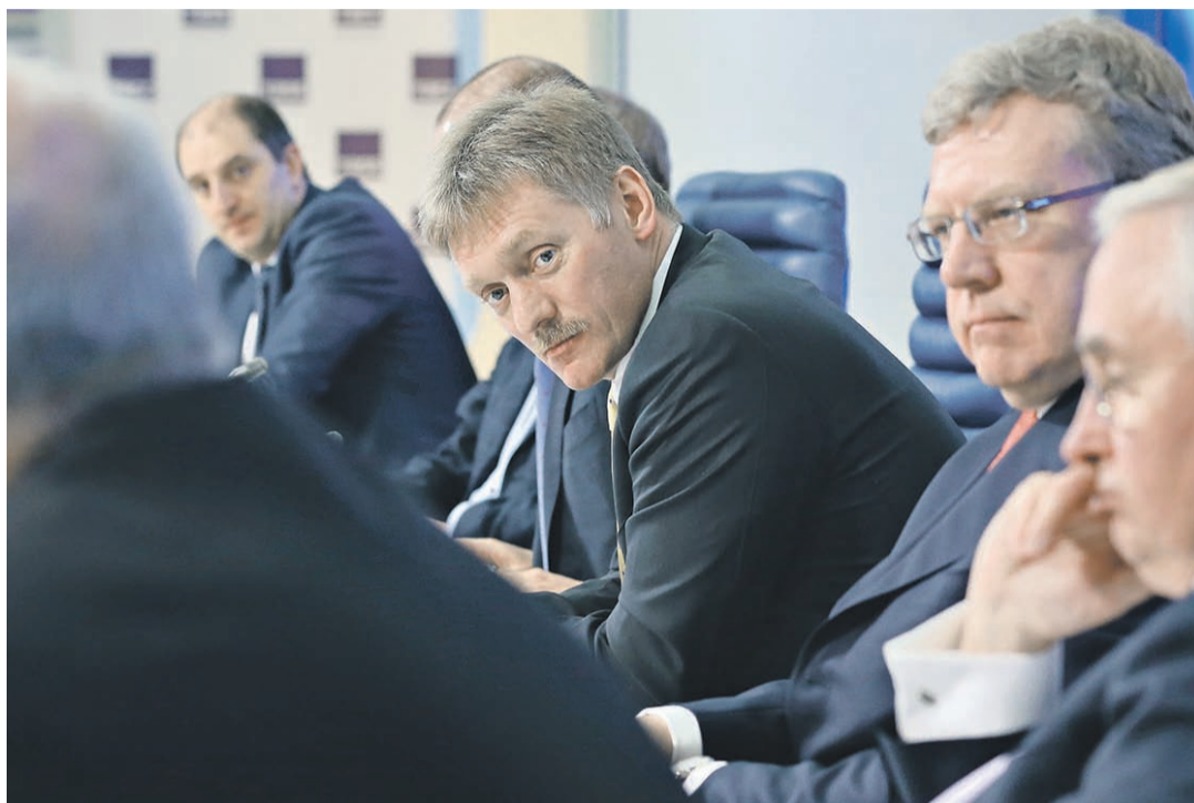
Пресс-секретарь Владимира Путина Дмитрий Песков (в центре) собрал журналистов, политологов и экспертов по случаю 15-летия избрания президента

Рейтинг действующего президента упал в 2011 году до 44%, но вовсе не события на Болотной площади были причиной этого. «Болотная площадь стала окончанием событий, которые проис-