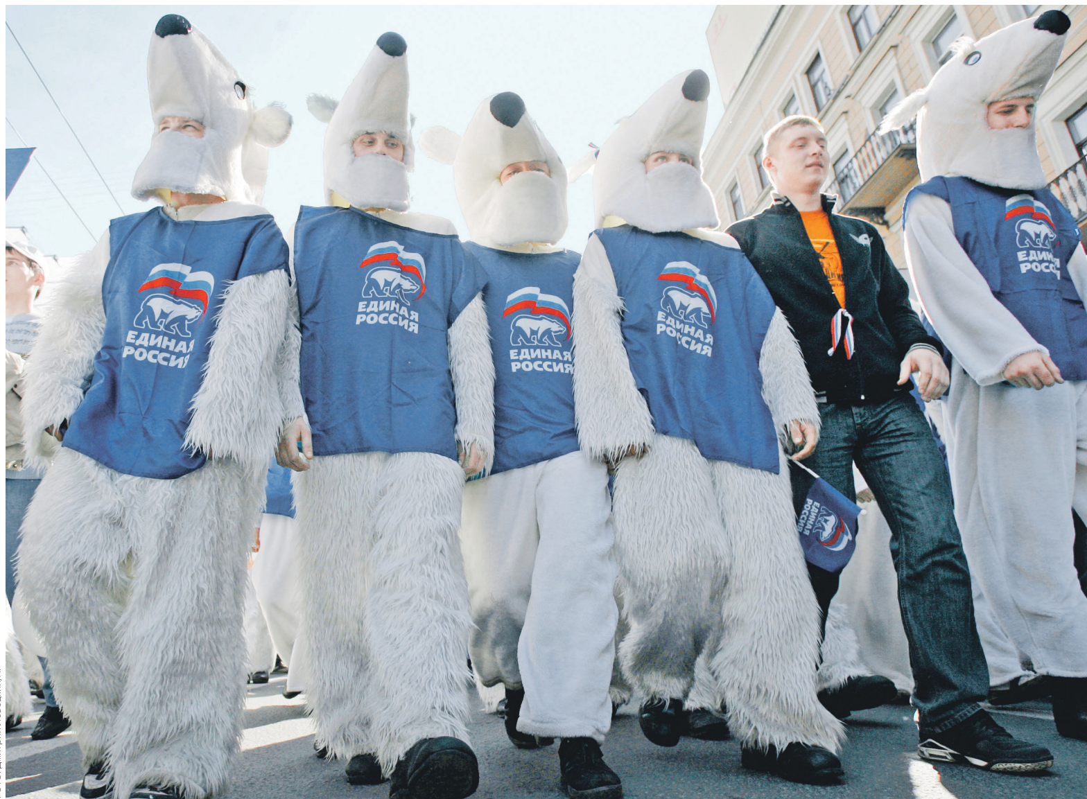
Несмотря на проблемы в ряде регионов, «Единая Россия», скорее всего, везде получит первые места по итогам выборов, считает эксперт

«По всей видимости, «Единая Россия» получит большинство (на нынешних выборах в заксобра-