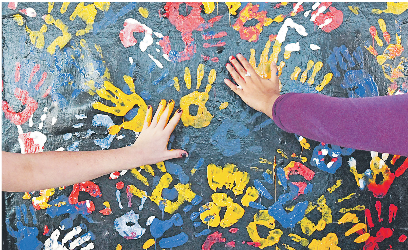
Сейчас в РФ работает более 30 платформ коллективного финансирования. Согласно данным, предоставленным Planeta.ru, суммарный объем краудфандинговых сборов в России растет более чем на 200% ежегодно

На первый взгляд пациент скорее жив, чем мертв: сейчас в стране работает более 30 платформ коллективного финансирования. Согласно данным, предоставленным Planeta.ru, суммарный объем краудфандинговых сборов в России растет более чем на 200% ежегодно. Пользователи краудфандинговых площадок стали щедрее: если в 2012–2013 годы средняя сумма, которую каждый тратил на поддержку одного проекта, составляла 500–750 руб., то теперь она выросла до 1,5 тыс. руб. Статистика по двум крупнейшим площадкам тоже впечатляет. Planeta.ru за пять лет собрала свыше 660 млн руб. и запустила более 8 тыс. проектов.