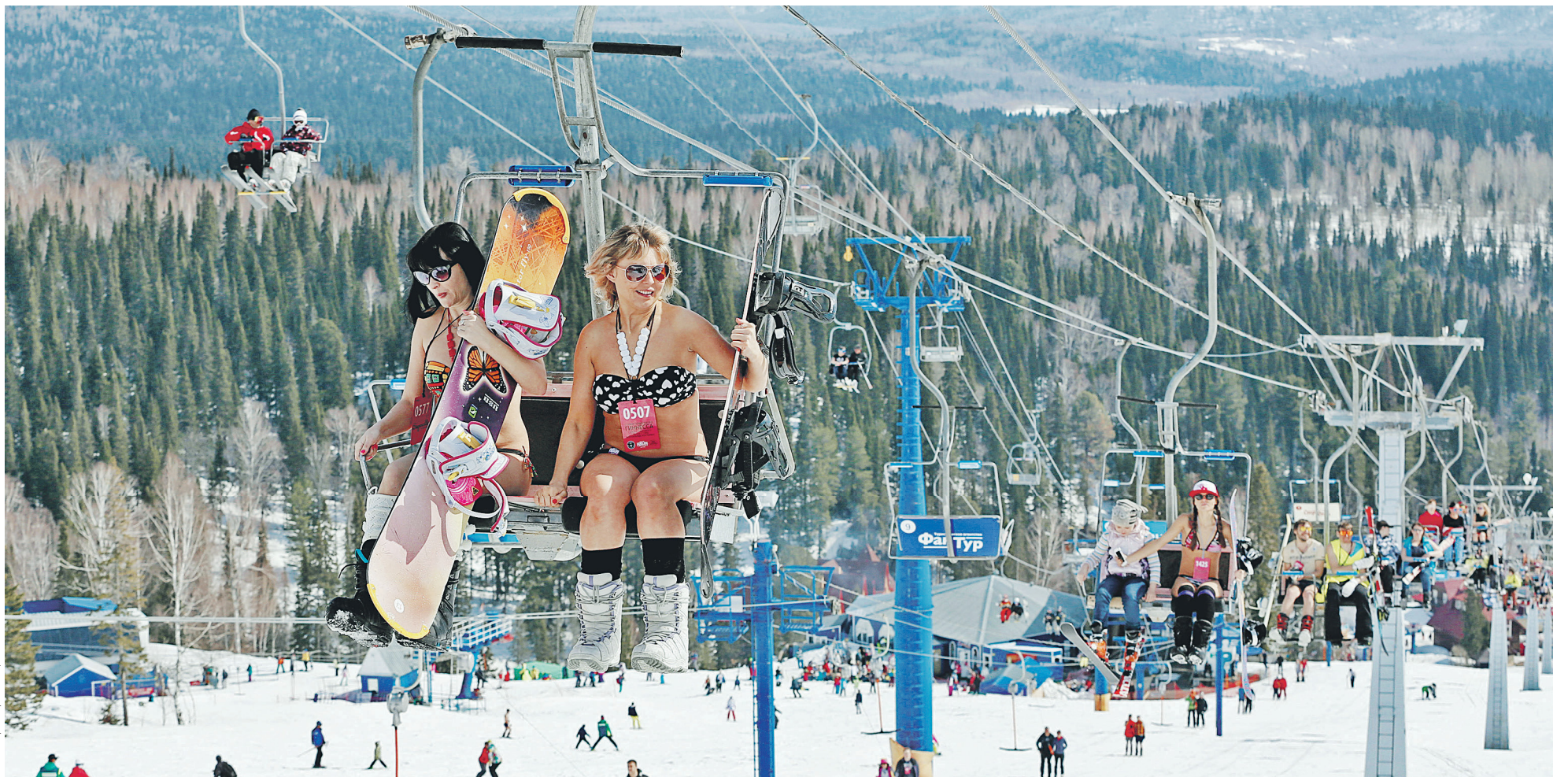
В прошлом году на создание туристических кластеров было выделено из бюджета 3,6 млрд руб. На фото: горнолыжный курорт Шерегеш (Кемеровская область)

ПРОВЕРКА Счетная палата выявила серьезные нарушения в реализации ФЦП о развитии внутреннего и въездного туризма