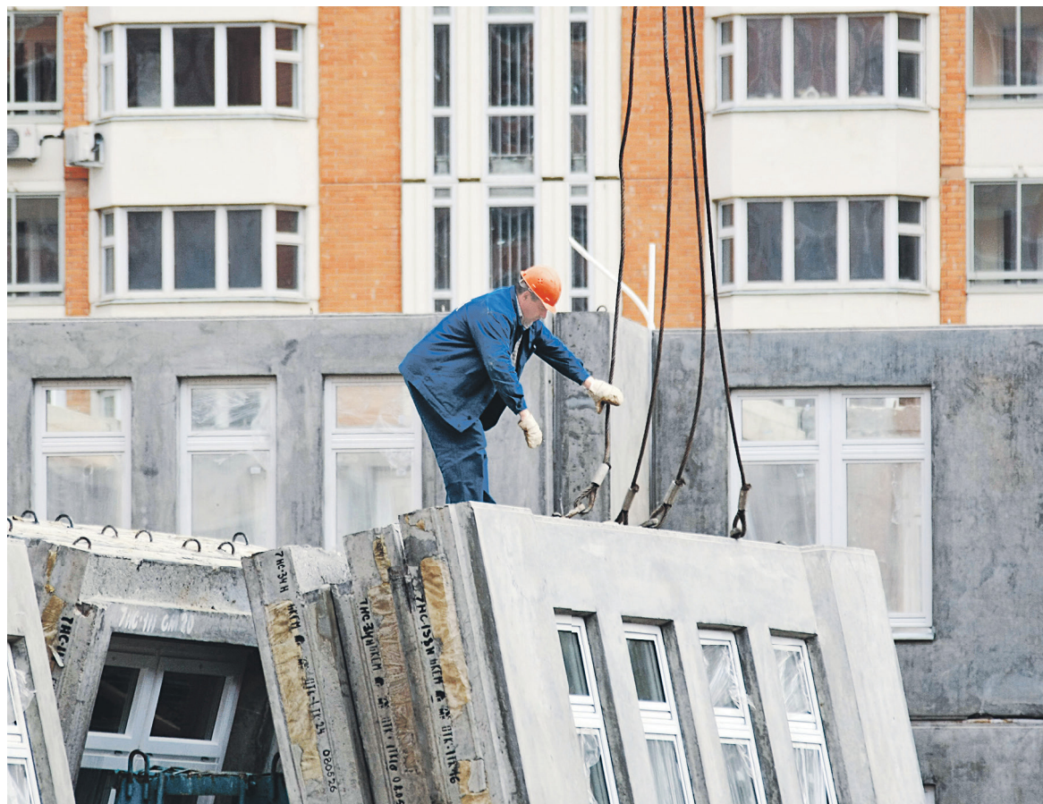
Акционер АИЖК — Федеральное агентство по управлению госимуществом — уже не первый раз получает часть дивидендов в виде недвижимости