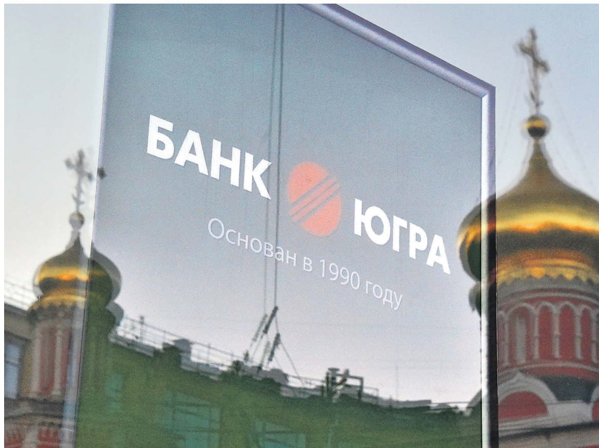
Одна из причин ввода временной администрации — «техническое» исполнение предписаний Банка России. Банк формировал резервы по одним кредитам, а потом расформировывал резервы по другим

По ее словам, у регулятора вызвали вопросы клиенты «Югры» в нефтяной отрасли и юристы, занимающиеся недвижимостью. Активы именно в этих отраслях и составляют, по данным СМИ, небан-