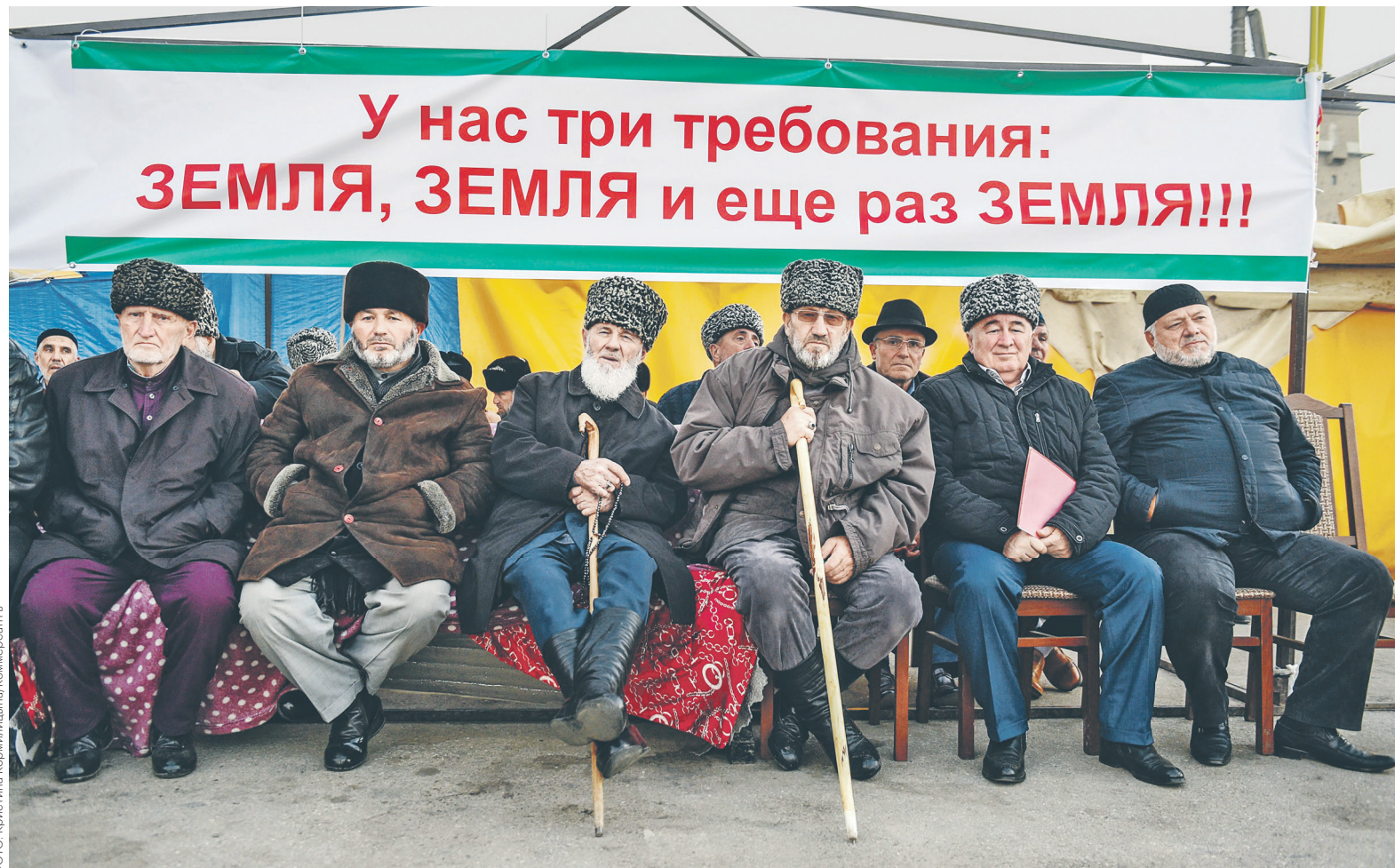
Ради полной отмены пограничных соглашений жители Ингушетии готовы протестовать дальше, они требуют проведения референдума и отставки главы республики

К вечеру 30 октября ситуацию прокомментировал глава Ингушетии.