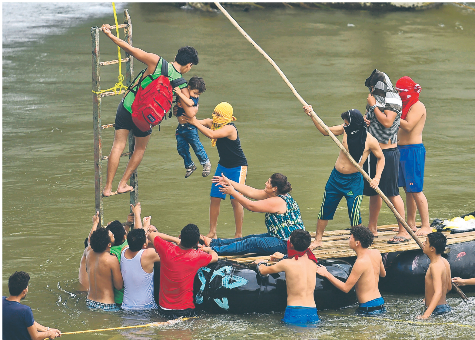
Необходимость ужесточения контроля над пунктами въезда в США Дональд Трамп объясняет тем, что в число мигрантов входят «некоторые очень плохие люди» — члены банд и «неизвестные люди с Ближнего Востока»

Трамп обратил внимание на то, что в число мигрантов входят «некоторые очень плохие люди» — члены банд и «неизвестные люди с Ближнего Востока». Как отмечает CNN, Трамп, скорее всего, имел в виду членов группировки «Исламское государство» (ИГ, запрещенная в России террористическая организация). Ранее ведущее гватемальское издание Prensa Libre написало о поимке правоохранительными органами этой страны 100 сообщников ИГ. В своей статье Prensa Libre ссылается на слова президента Гватемалы Джими Моралеса. Позднее материал Prensa Libre процитировала консервативная организация Judicial Watch, допустив, что представители ИГ могли проникнуть в караван. Прежде Трамп грозил закрыть границу с Мексикой и остановить финансовую помощь странам, которые «не контролируют собственное население».