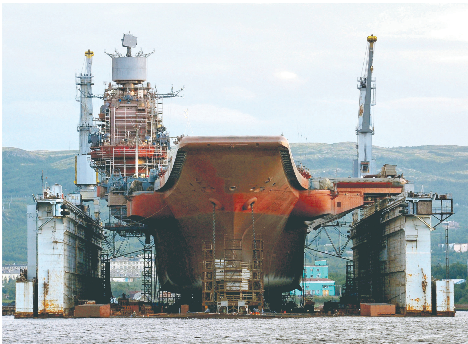
Ремонт единственного российского авианосца «Адмирал Кузнецов» в ПД-50, как заявили РБК в Центре судоремонта «Звездочка», был завершен до аварии 30 октября

Материалы на таком фоне опубликованы на коммерческой основе.