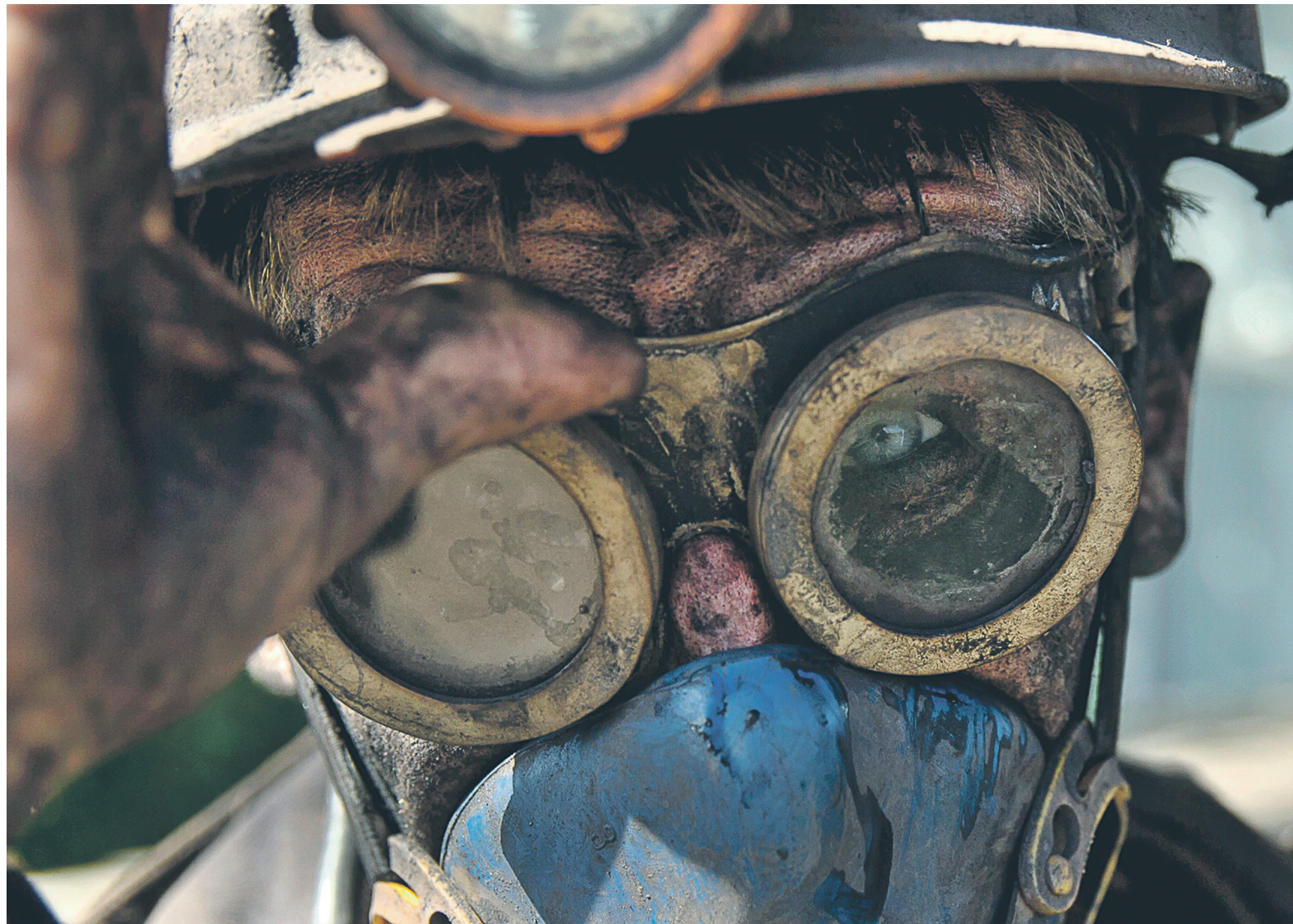
Трейдеры, зарегистрированные в Ростовской области и в Крыму, пожаловались на убытки из-за простоя вагонов с углем — он образуется из-за того, что компания Сергея Курченко получила статус эксклюзивного поставщика

В документе говорится, что 14 марта 2018 года Министерство экономического развития России направило телеграмму