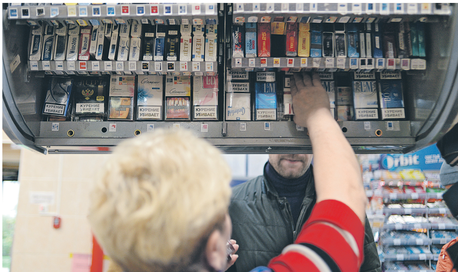
Для включения в систему учета продукции все торговые точки должны будут установить интернет и ввести систему электронного документооборота с поставщиками

Участники нынешнего эксперимента с маркировкой — федеральные органы исполнительной власти, производители, организации оптовой и розничной торговли. Импортёры табачной продукции подключатся к эксперименту только с 1 июля 2018 года. Оператором информационной системы для проведения эксперимента выступает ООО «Оператор-ЦРПТ» («дочка» Центра развития перспективных технологий — ЦРПТ). Координацией и мониторингом системы занимается Минпромторг.