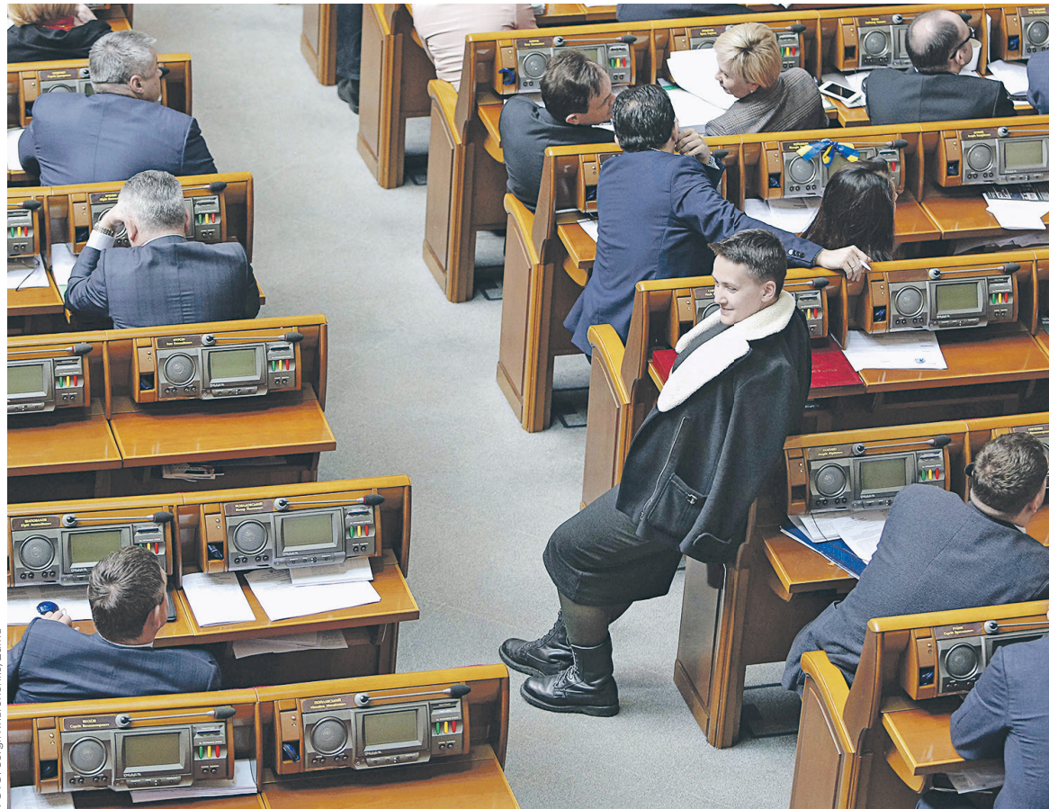
22 марта народный депутат Украины Надежда Савченко была задержана в здании Верховной рады по подозрению в подготовке государственного переворота и серии терактов