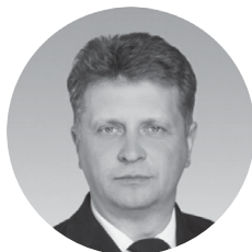
Максим Соколов Министерство транспорта РФ

Мы рассматриваем международную транспортно-логистическую выставку СИТЛ как авторитетный транспортный форум, целью которого является предоставление современных технологий грузоперевозок на железнодорожном, автомобильном, водном, воздушном транспорте. Главной задачей выставки является демонстрация новейших достижений в области создания систем логистики, транспортного обслуживания, автоматизации и механизации складских и погрузочно-разгрузочных работ, производства специального и специализированного подвижного состава всех видов транспорта. В России, как и во Франции, транспорт является одной из крупнейших базовых отраслей хозяйства, важнейшей составной частью производственной инфраструктуры. Однако без привлечения альтернативных финансовых ресурсов и новых правовых механизмов решить задачу по развитию транспортной инфраструктуры невозможно.