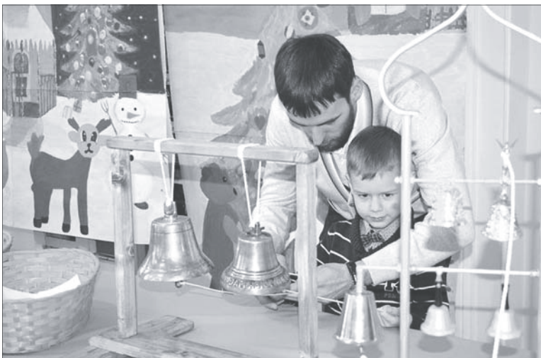
Отец обучает сына играть на колоколах.