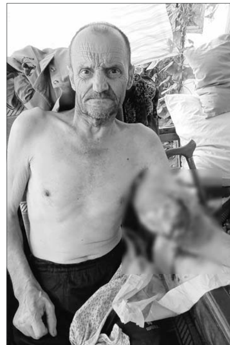
Мужчине возможно придется ампутировать руку.