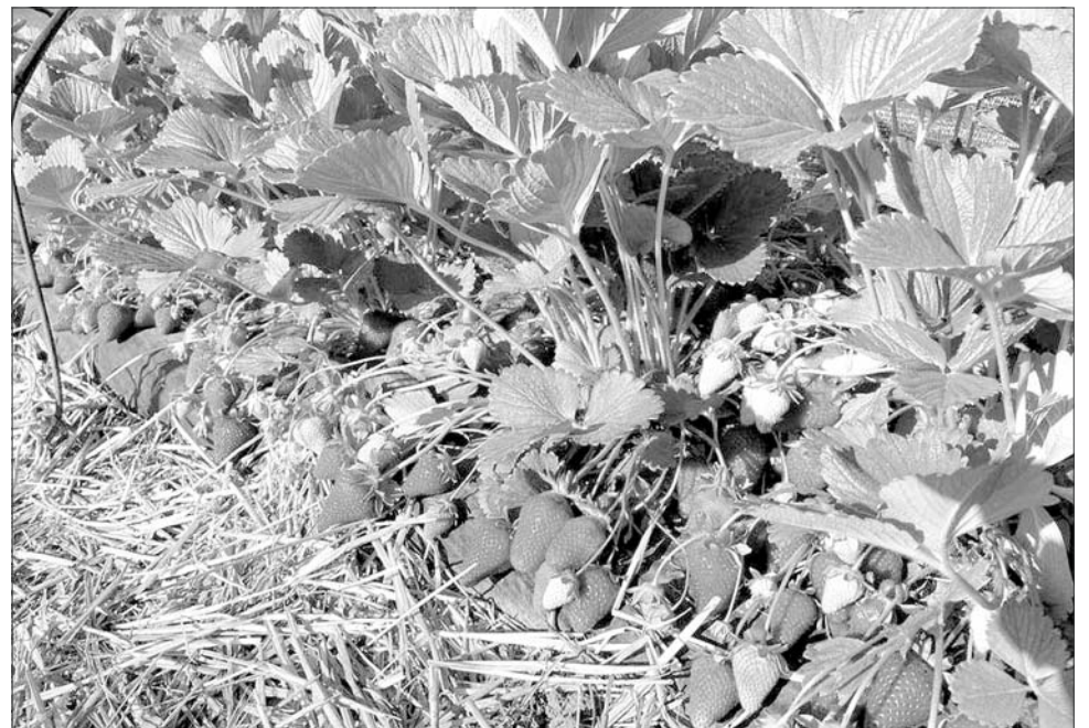
Каждому сорту земляники нужен особый уход.

А с ремонтными сортами еще сложнее. Такие сорта плодоносят до заморозков, как на материнских растениях, так и на усах. Им нужен особый уход.