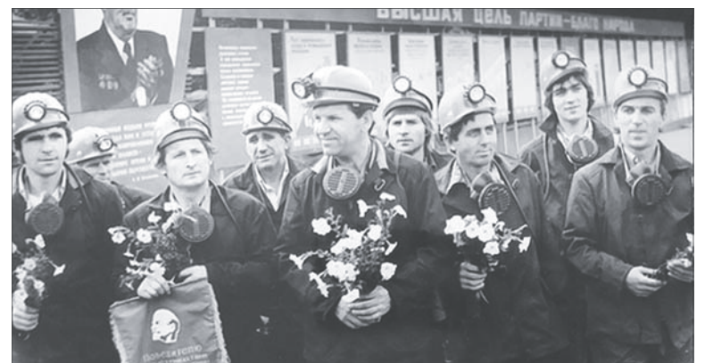
В День Шахтёра горняков награждали по итогам соцсоревнований.

Многое из шахтёрского быта осталось в прошлом, например, термины, не вызывающие вопросы у шахтинцев ещё лет 20 назад, сегодня надо «расшифровывать». Дело в том, что часть из них уходит своими корнями в ещё более отдалённые от нас времена. Например, когда надо было вести взрывные работы, звали «запальщика». Официально это был взрывник, но его все называли по старинке. Когда-то взрывники пользовались бикфордовым шнуром, который и запаливали. Также по-старому называли динамитные и пороховые склады, хотя ни динамитом, ни порохом уже никто при взрывных рабо-