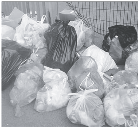
Жители дома закрыли двор на замок, за это соседи закидали их калитку мусором.

Конфликт с двором между двумя центральными улицами города — Шевченко и Советской назрел уже давно. Редакция «КВУ» уже писала о том, что жители так называемого «элитного» дома в центре огородили свой двор и повесили на калитку замок, чтобы сделать двор автономным. Дом 76 А по улице Шевченко расположен сразу за знаменитым «Домом техники» или домом с колоннами. В элитной пятиэтажке живут родственники бывших депутатов города и многие известные горожане. Простые смертные называют их «элитой» и возмущаются