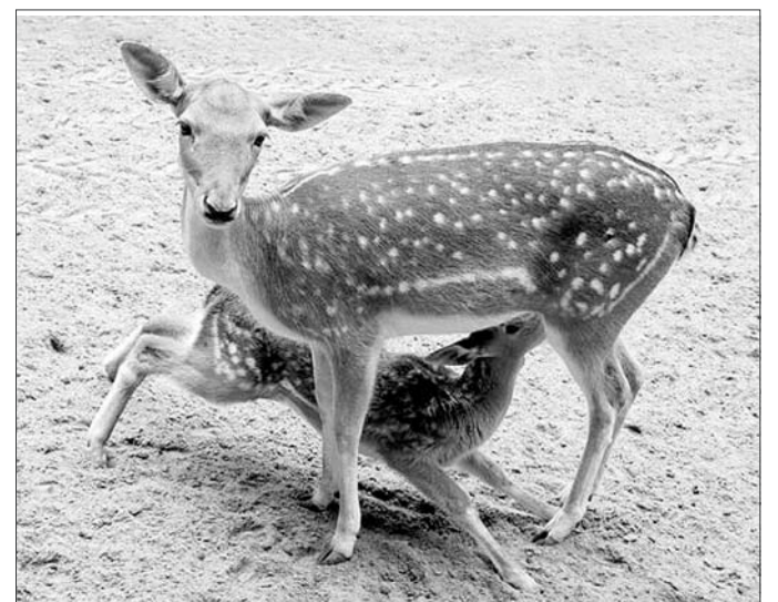
Грудной олененок с мамой.

В парке рассказали, что оленята рождаются неповоротливыми, с тонкими и длинными ногами. Они должны научиться на них стоять. Занимает это несколько дней. Вскоре оленята бегают и прыгают уверенно и постоянно. Оленята рождаются в период с середины мая до середины июля. Беременность у самок длится почти как у лю-