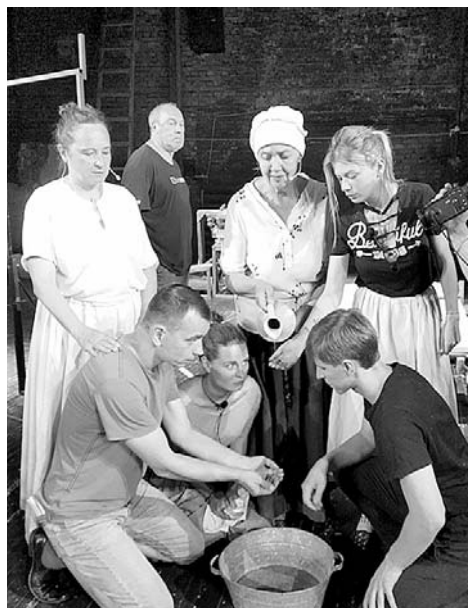
Репетиция нового спектакля.

Шахтинский театр открывает очередной театральный сезон 8 сентября. Он будет девяносто четвертым по счету.