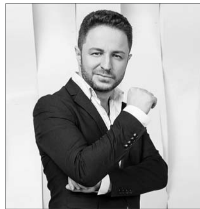
Имя певца при рождении Бесарион Шпетишвили.

В Шахтах в День города и День шахтера для горожан выступит с концертом звезда эстрады Брендон Стоун.