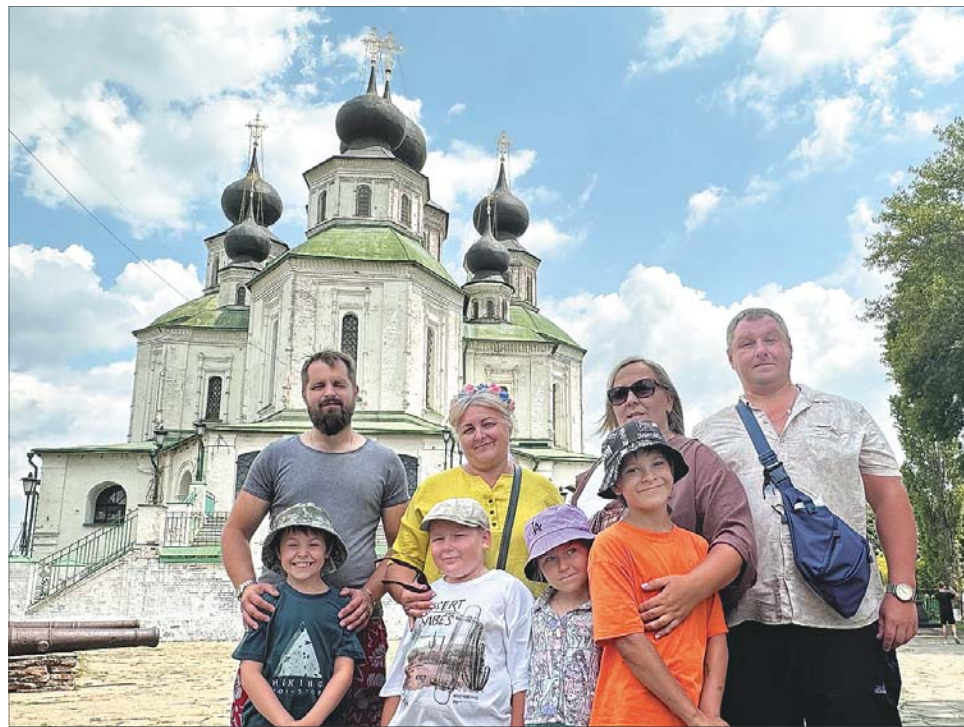
Войсковой собор - первый каменный на Дону.

Гости из Санкт-Петербурга были впечатле-