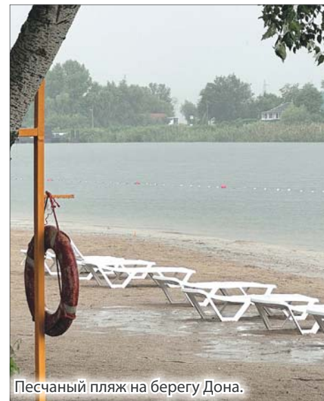
Песчаный пляж на берегу Дона.

— Мы гуляли несколько часов, устали и пришли на пляж. Только расстелили пледики, а дети еще не успели замерзнуть