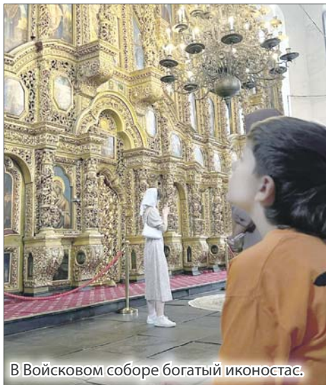
В Войсковом соборе богатый иконостас.

Путешествие выходного дня в Ростовской области — милое дело, особенно если есть личный транспорт. Одним из популярных мест для однодневной поездки является Старочеркасск.