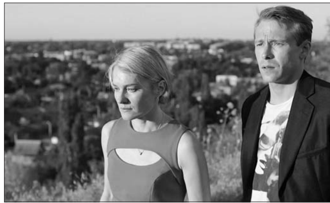
В сериале часто мелькают шахтинские улицы.

В онлайн-кинотеатре 16 ноября состоялась премьера фильма «Уголь», который был снят в городе Шахты и Красном Сулине.