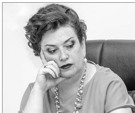
Бывшему министру грозит 7 лет колонии.

Напомним, 28-летний водитель четырнадцатой Александр Юдаков ехал по улице Чаплыгина, не придерживаясь своей полосы. Из-за этого по касательной задел «Митсубиси Паджеро». Двигались машины в попутном направлении. Из-за удара ВАЗ-211440 выехал на встречку и влетел в пассажирский автобус маршрута №114 «Аюта - Центральный рынок». Им управлял пожилой водитель, а в салоне находилось пять пассажиров. В результате ДТП пострадали трое: пассажиры авто 34 и 30 лет, а также 44-летний пассажир автобуса. Впоследствии один из пострадавших умер в больнице.