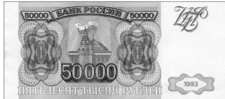
Самыми популярными среди фальшивомонетчиков девяностых годов были 10-и и 50-тысячные купюры.

нии влаги рисунок на банкнотах начинал расплываться. Чтобы отличить фальшивку от настоящих денег следовало хорошенько приглядеться к мелким деталям. На фальшивых банкнотах они были нечёткими. От всех учреждений и лиц, имеющих дело с приёмом денег, требовалось быть особенно внимательными, а при обнаружении попытки сбыта фальшивых банкнот следовало принять меры к задержанию или установлению лица, сбывающего фальшивые банкноты. По возможности бдительных граждан просили записать номер автомобиля, на котором приехали сбытчики, позвонить 02 или обратиться в ближайший отдел внутренних дел.