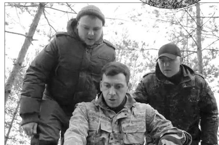
Кадры из фильма «Бехолла».