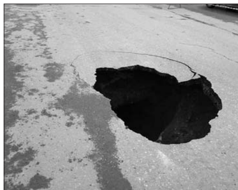
Огромная яма образовалась прямо на проезжей части.