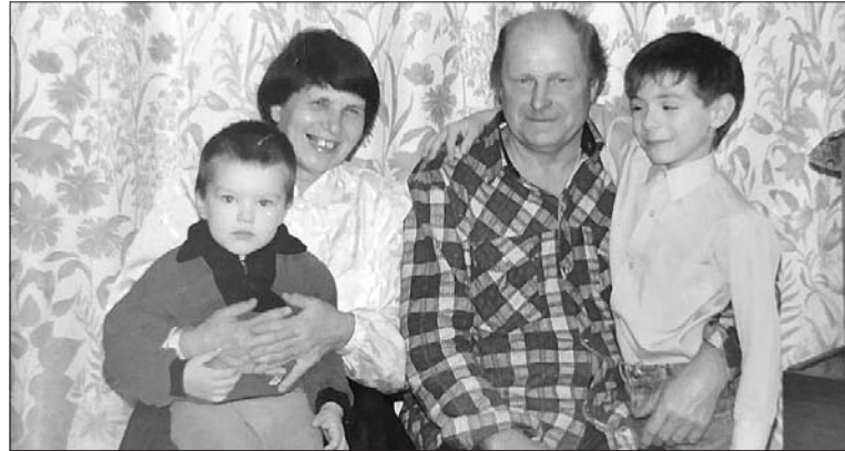
Супруги Прошунины с внуками.

На территории соседствующего с этим городом Красносулинского района тогда уже в течение несколь-