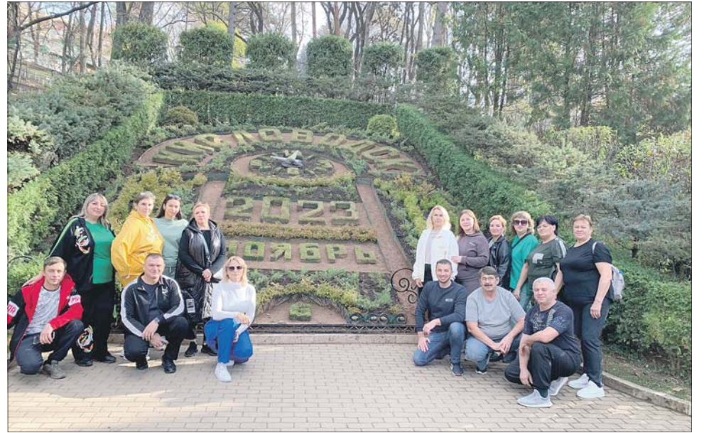
Цветочный календарь в Кисловодске.