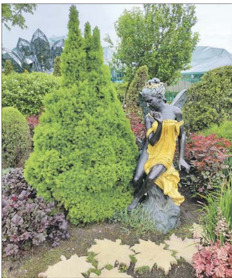
Парк «Зелёный квартал» в Иноземцево.

Сначала путешественники побывали в Железноводске, посетили парк «Зелёный квартал». Он находится в 15 минутах езды от Пятигорска в посёлке городского типа Иноземцево.