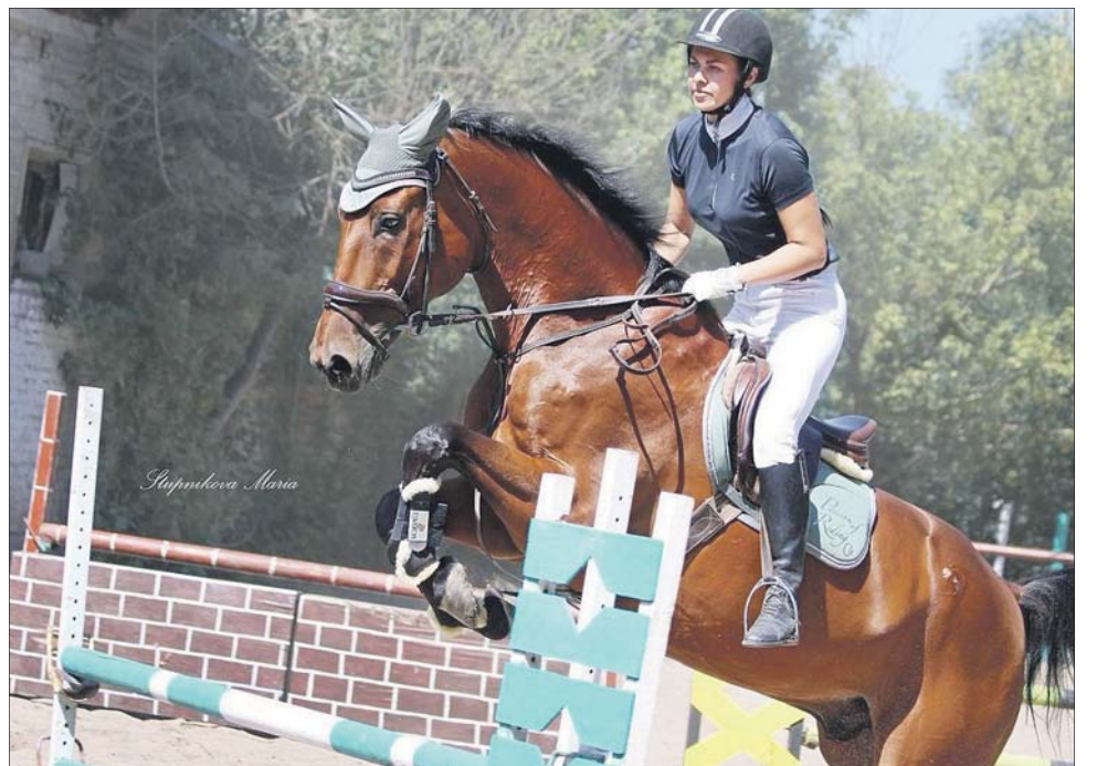
Лошадь Орлеона завоевала известность клубу.