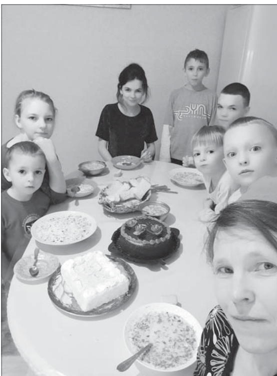
Родители помогают детям развивать их таланты.

Мы решили узнать у шахтинки, как она воспитывает девятерых детей и прививает им традиционные семейные ценности, поддерживает и укрепляет семью.