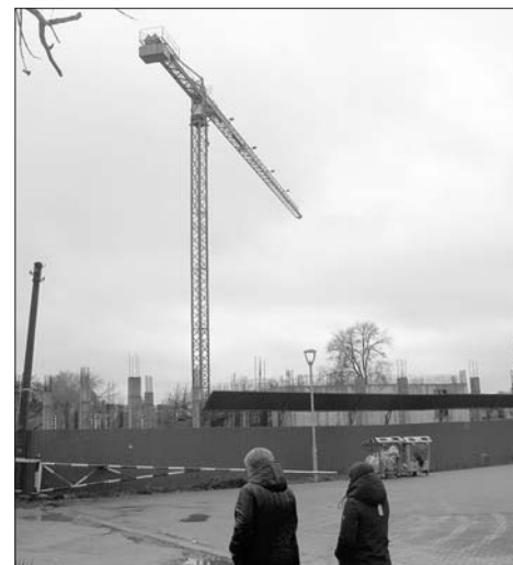
Проект дома в Александровском парке будет изменен.

Суд был выигран, но место строительства по-прежнему оставалось огороженным. Шахтинцы не могли заходить на территорию. На поле не ровняли вырытые котлованы, не убирали строительную технику. Горожане считали, что недострой будет «украшать» центр города десятилетиями. Но теперь строительство возобновилось. И, как оказалось, на законных основаниях. В августе этого года шахтинский суд постановил продлить разрешение на строительство многоквартирного дома возле Александровского парка. В судебных документах указано, что де-