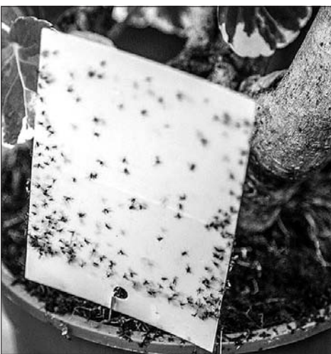
Сциариды не вредят растениям, а нарушают эстетику помещения.

3406 Уход за МОГИЛКАМИ и замена ДОСКИ на лавочке. Широкая помощь по хозяйству, дому, квартире и усадьбе. Просто ПАРА МУЖСКИХ РУК в помощь. Обращаться по тел. 8-908-502-84-96, 8-918-530-40-06, 23-07-93.