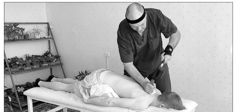
Молотком наносится точечный удар по позвонкам.

Иглонож. Это специальная иголка, которая вводится между мышцей и кожей, делая микроподрезы. К области подрезов приливает кровь, за счёт чего снимается спазм. Иголка «работает» там, где нет нервных окончаний, поэтому человек не чувствует боли.