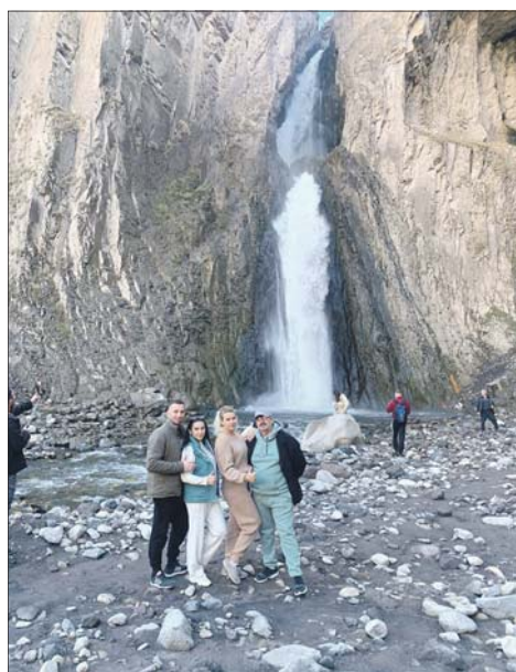
Медовые и жемчужные водопады очаровали туристов из Шахта и Волгодонска.

В 16 километрах от Кисловодска, в Карачаево-Черкессии находится еще одна удивительная достопримечательность этого чудесного края — Медовые водопады. Расположены они в долине неболь-