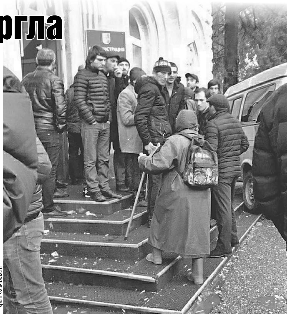
Бабушка пришла в Сухум ко дворцу за пенсией - а тут опять революция!

Хаджимба не захотел (или не смог) защитить даже своего вице-президента, которого побили какие-то влиятельные люди. Не