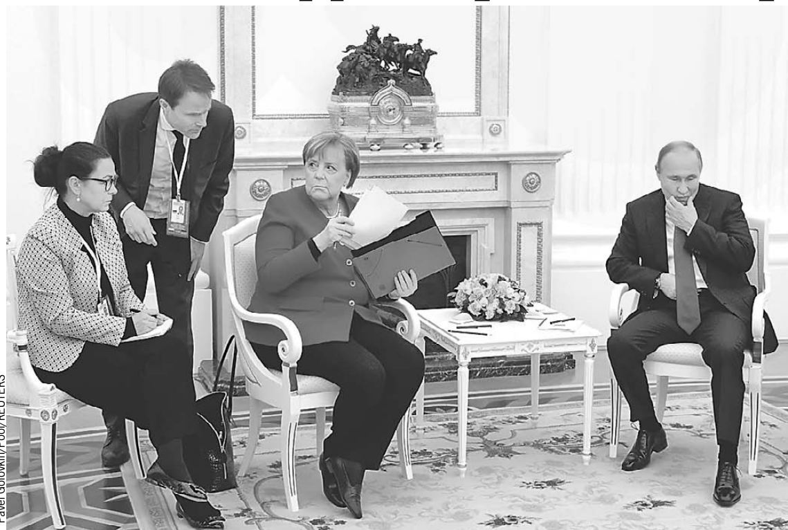
Канцлер Ангела Меркель прилетела в Москву, чтобы подтвердить президенту Владимиру Путину свою решимость сделать все ради получения газа из России напрямую.

стоятельно, без привлечения иностранных партнеров, - подтвердил Путин. - Вопрос в сроках. Это единственный вопрос, который встанет в этой связи. Окончание строительства будет отодвинуто на несколько месяцев.