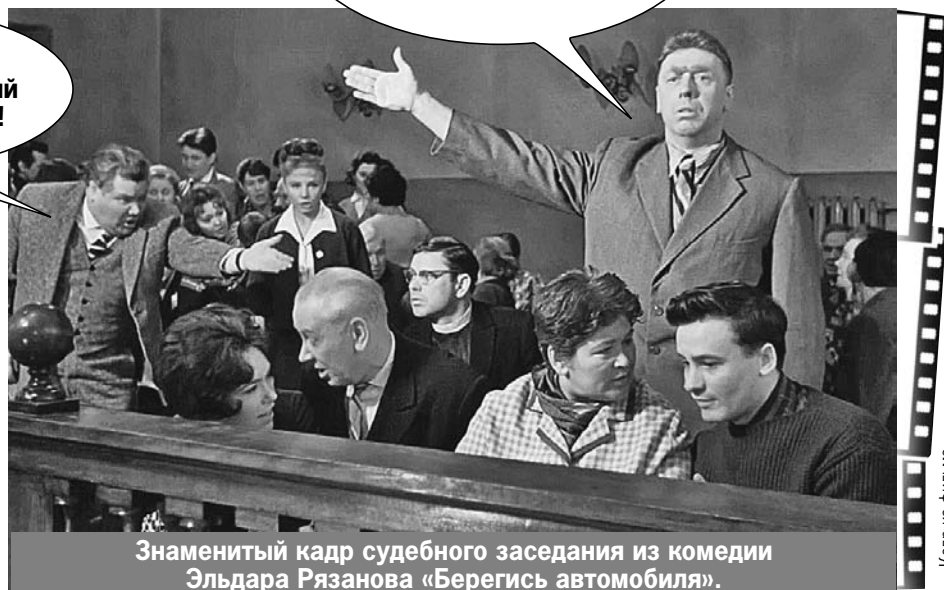
Знаменитый кадр судебного заседания из комедии Эльдара Рязанова «Берегись автомобиля».

- Для нас, элиты, должен быть особый Уголовный кодекс!