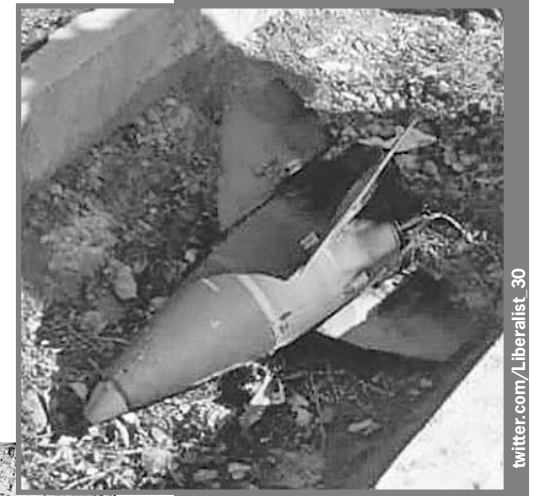
Головной обтекатель боевой части ракеты, поразившей «Боинг».

В итоге, несмотря на всю взаимную неприязнь, и Запад, и Иран неожиданно сходятся в одном: запуск той роковой ракеты «земля - воздух» произошел по ошибке. Похоже, это объяснение и можно считать наиболее близким к правде?