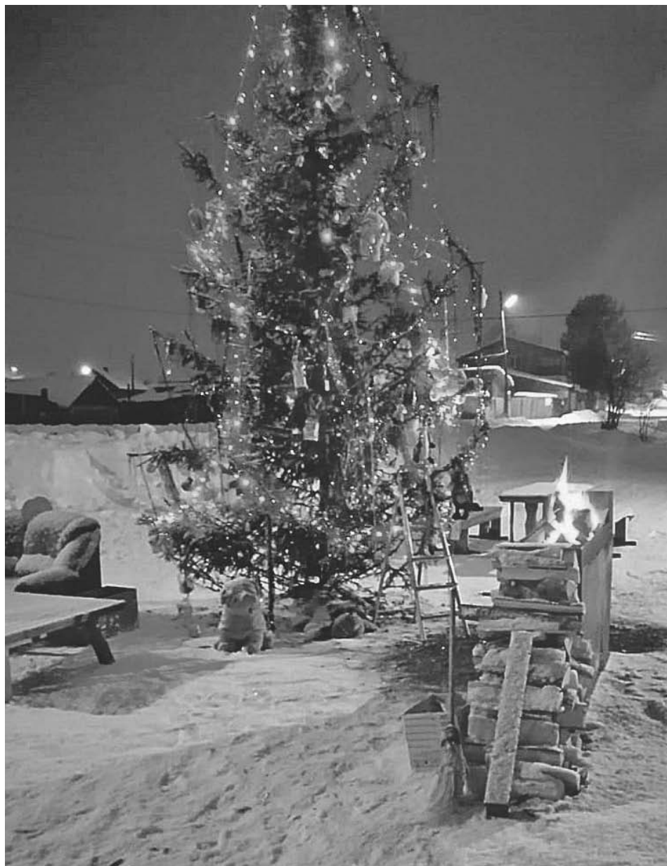
Не бог весть какая красота, но местным жителям это местечко нравилось - обустроивали его всем селом.