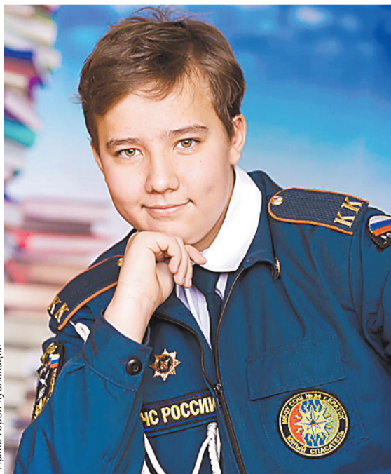
Эти ребята проявили отвагу и смекалку.