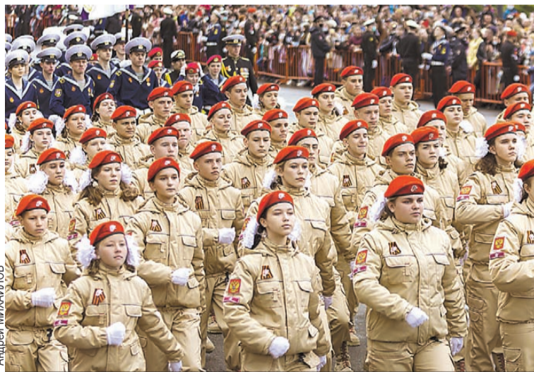
Строевая подготовка - основа основ.

Кстати, у выпускников Юнармии, поступающих в высшее военное учебное заведение либо в институт полиции, есть преимущество перед теми, у которых за плечами такого опыта нет. К примеру, при равных баллах поступит абитуриент с книжкой юнармейца. Но есть оговорка! Она должна быть у подростка не менее двух лет. То есть в течение этого времени он должен принимать активное участие в мероприятиях, что отражается в этом документе.