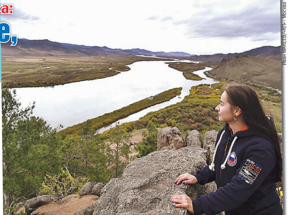
Советы, как правильно себя вести в путешествии, порой спасают от смертельных опасностей.

- Люди так устроены. 11 месяцев в году сидят за компьютером и тренируют мозги, а в отпуске «добирают» эмоции и риск. На эти случаи приходится большая часть травм. Во-первых, организм не тренирован. Во-вторых, или силы не рассчитали, или категорию сложности перепутали. В-третьих, не взяли лекарства от хронических болячек. А это уже смертельный номер. Вертолет на по-