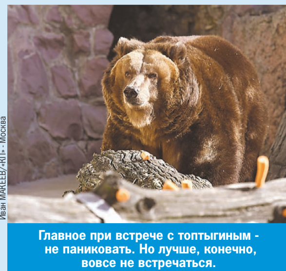
Главное при встрече с топтыгиным - не паниковать. Но лучше, конечно, вовсе не встречаться.

Если на пути вдруг попались медвежата, ни в коем случае нельзя подходить. Неподалеку за ними следит их мама.