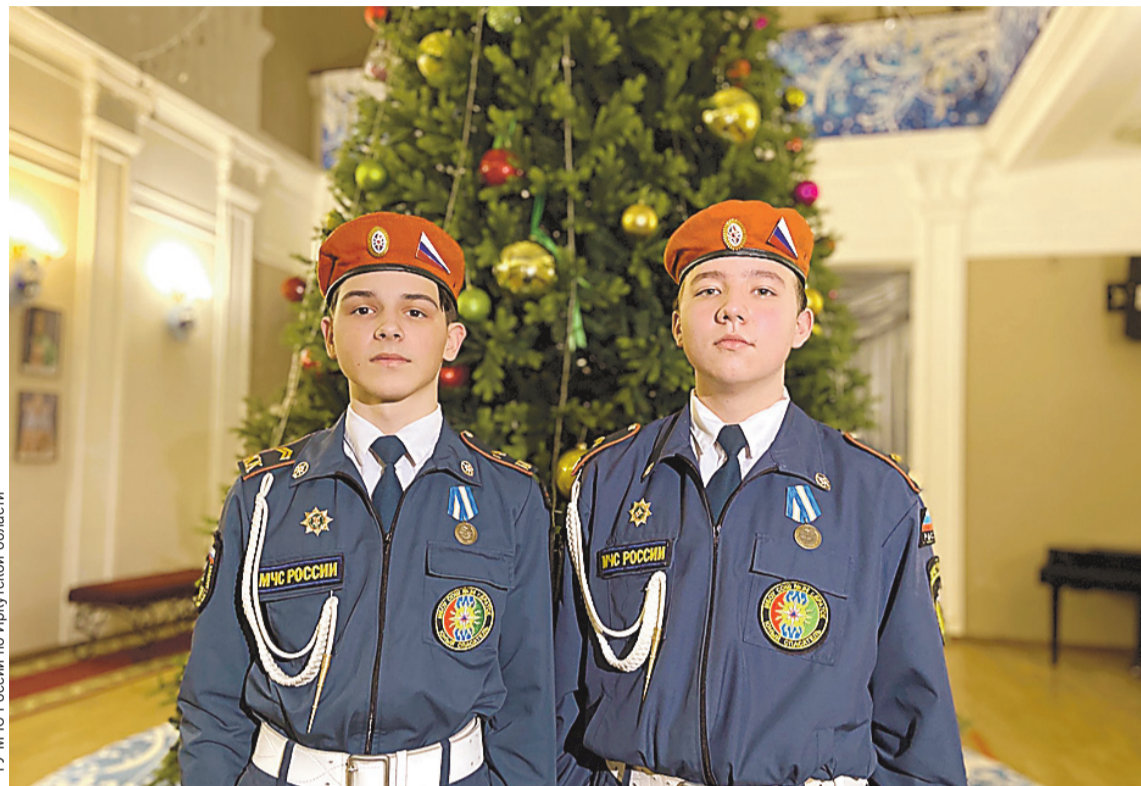
Героям вручили нагрудные знаки. Рассказы об их поступках теперь есть в почетной книге о смелых детях нашей страны.

Пламя в отеле вспыхнуло в ночь на 4 мая 2021 года. Сигнализация и другие системы противопожарной безопасности не сработали,