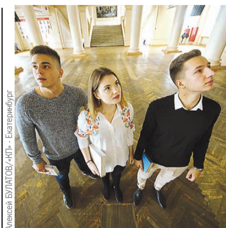
Алексей БУЛАТОВ / «КП» - Екатеринбург