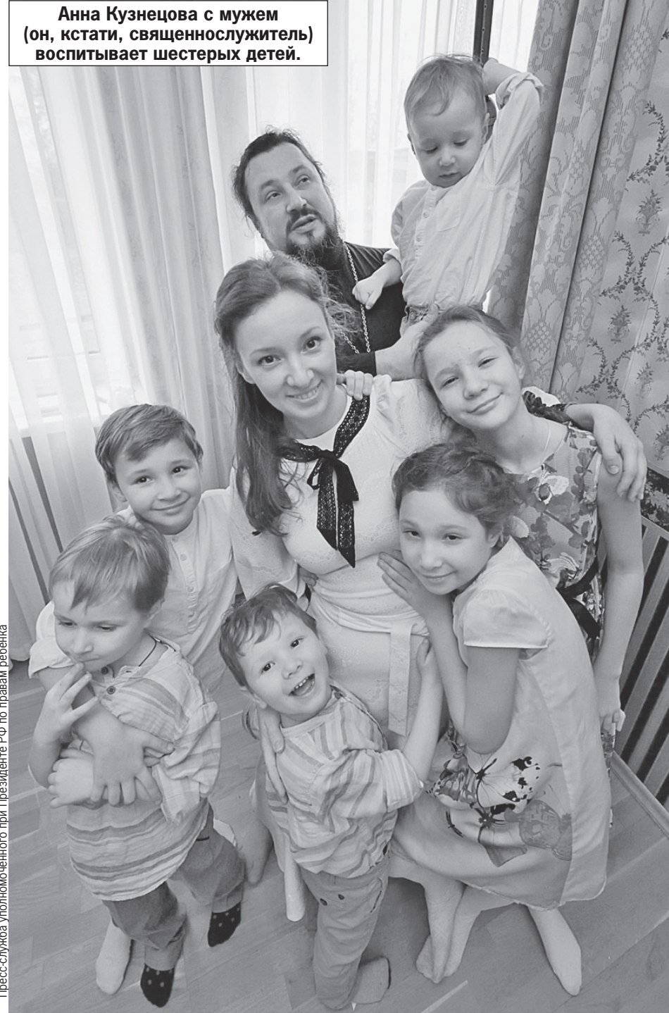
Пресс-служба уполномоченного при Президенте РФ по правам ребенка

Анна Кузнецова с мужем (он, кстати, священнослужитель) воспитывает шестерых детей.