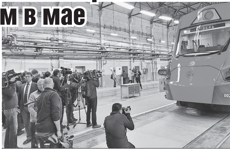
Увидев такую толпу иностранных акул пера и микрофона, на Тверском вагоностроительном заводе, похоже, удивились: они что, нашу «Иволгу» (поезд на фото) с космической ракетой перепутали?

- Посмотрел вашу новую продукцию - супер! Просто класс! - сказал он рабочим вагоностроителя. - Лучшее мирового уровня! И вас это