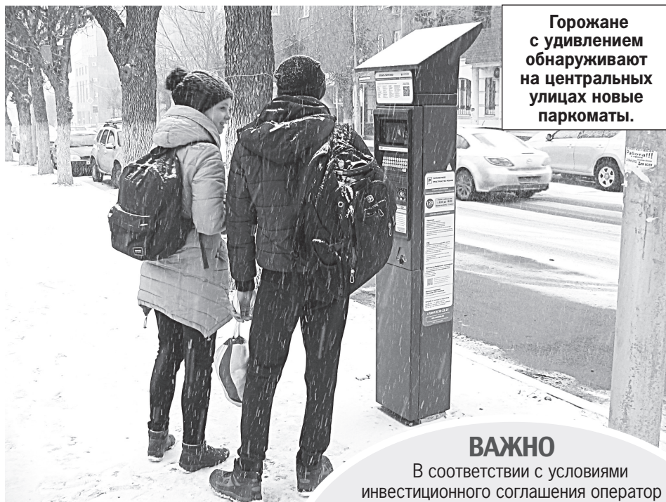
Горожане с удивлением обнаруживают на центральных улицах новые паркоматы.

На сегодняшний день в зоне платной парковки действует тариф 20 рублей в час. Останется ли плата прежней или автомобилистам придется раскошелиться на большую сумму? В администрации заверили, что «в ближайшее время установление дифференцированного тарифа в зависимости от улицы не планируется».