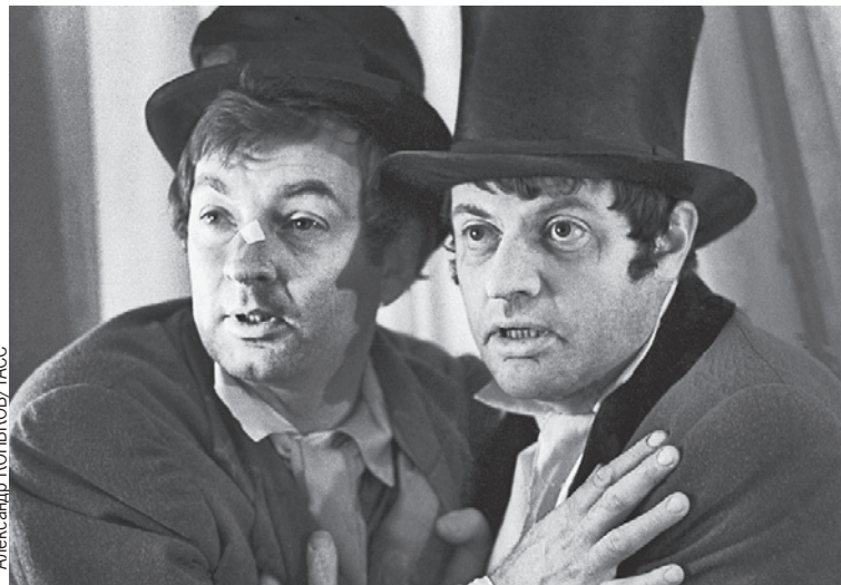
С Александром Ширвиндтом Державин дружил с детства. Артисты неоднократно играли вместе в кино и театре (на фото - фрагмент спектакля «Ревизор»).