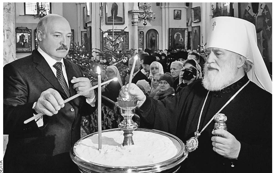
Александр Лукашенко вместе с Митрополитом Павлом зажег рождественскую свечу у Минской иконы Божией Матери в Свято-Духовом кафедральном соборе.

Среди лауреатов - Белорусский союз женщин, который возглавляет заместитель председателя Парламентско-