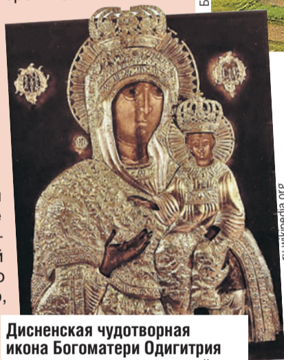
Дисненская чудотворная икона Богоматери Одигитрия хранит город и его жителей.

Есть в городе свои чудеса. В белоснежную Свято-Воскресенскую церковь стекаются тысячи паломников. Просят покровительства и заступничества у чудотворной иконы Богоматери Одигитрия. По легенде, святой лик приплыл в город по Двине три века назад, когда тут бушевали пожары. С молитвой и образом люди прошли по уцелевшим улицам, и... чудо, огонь отступил. Горожане верят, икона оберегает их от бед и напастей.