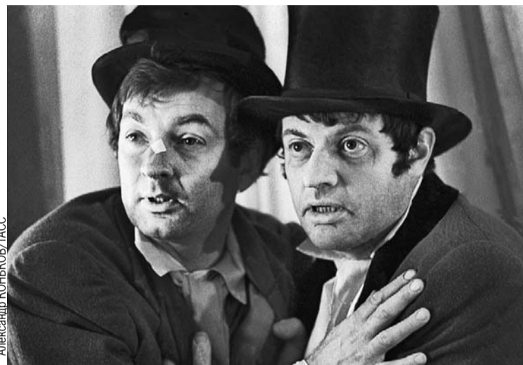
С Александром Ширвиндтом Державин дружил с детства. Артисты неоднократно играли вместе в кино и театре (на фото - фрагмент спектакля «Ревизор»).