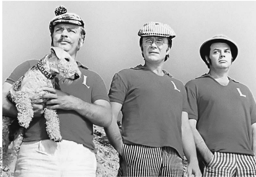
Джордж, Джи и Харрис в исполнении блистательного трио надолго стали для зрителей воплощением английских джентльменов, а их репризы ушли в народ.

«Для большинства телезрителей наши дурашливые, порой наивные сценки и репризы служили отдушиной в их зарегламентированной жизни, - говорил про «Кабачок» сам актер. - Это был оазис, свет