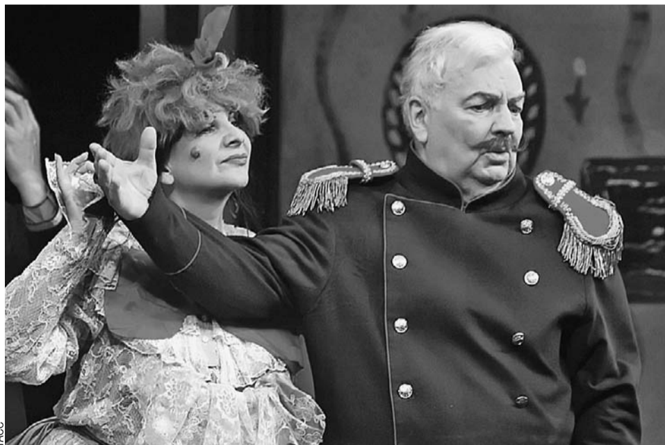
«Ромео мне уже не сыграть, как в молодости хотелось», - не раз говорил артист, но исполнил много других прекрасных ролей на сцене Театра сатиры.

Актер театра и кино, Михаил Державин родился в 1936 году в Москве. Окончил театральное училище имени Щукина. Работал в Московском театре имени Ленинского комсомола («Ленком»). С 1967 года - в Театре сатиры, где служил 49 лет и сыграл в десятках спектаклей. Самые яркие фильмы с его участием: «Трое в лодке, не считая собаки», «Зимний вечер в Гаграх», «Бабник», «Настоящий мужчина», «Старые клячи». Народный артист РСФСР, в Москве на Аллее российского кино рядом с «Мосфильмом» была открыта именная звезда Михаила Державина. Награжден орденом «За заслуги перед Отечеством» III степени, орденом Почета и орденом Дружбы.