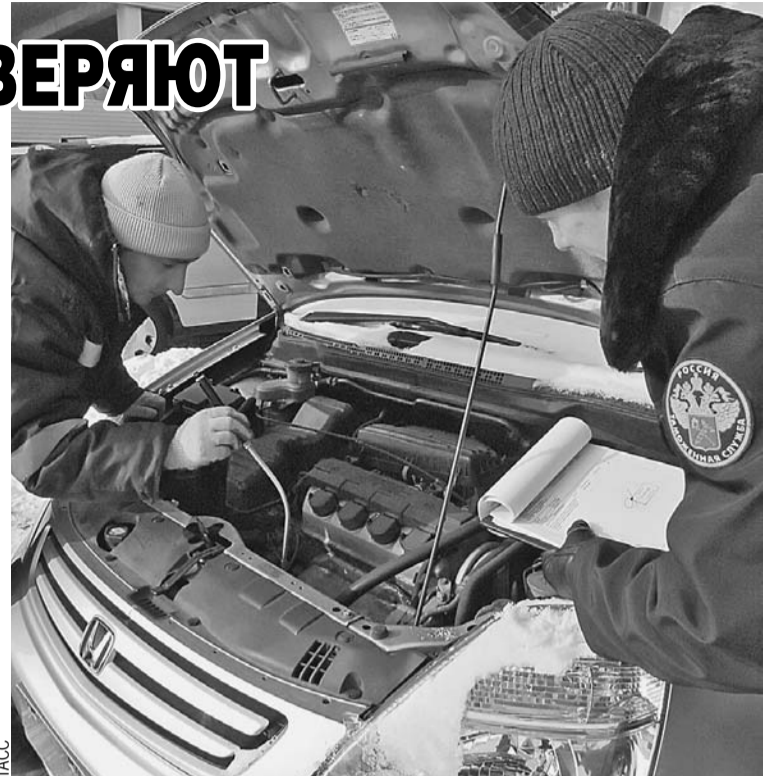
Пограничники смотрели не только документы пассажиров, но и сверяли данные на машины и грузы.

Очевидно, что причиной заторов и очередей на границе в праздники стал большой поток автомобилей, хлынувший из России в Беларусь и европейские страны на каникулы, а потом возвращающихся обратно. Поэтому и пришлось ввести особый