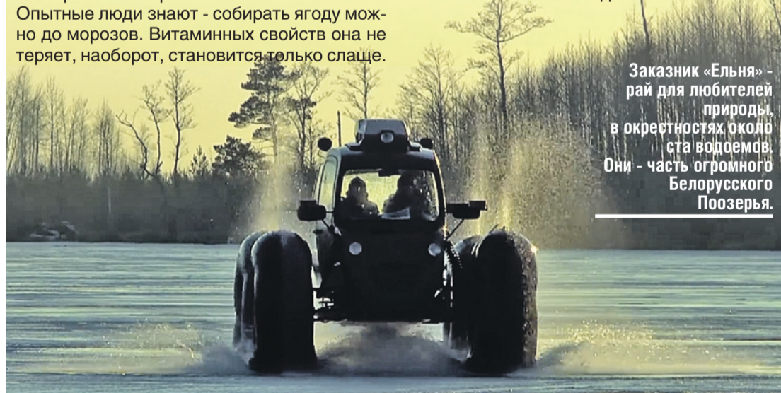
Заказник «Ельня» - рай для любителей природы в окрестностях около ста водоемов. Они - часть огромного Белорусского Поозерья.

Ельня - место гнездования редких пернатых: белой куропатки, кроншнепа, орлана-белохвоста. Неудивительно, что сюда едут приверженцы новомодного увлечения - наблюдения за птицами. Не сильны в орнитологии? Не беда. Сотрудники заказника покажут, кто есть кто в мире птиц. Хотите отдых «погорячее»? Заказывайте экстрим-экскурсию на великане-болотоходе, который прокатит вас с ветерком прямо через топи впечатлений хватит надолго.