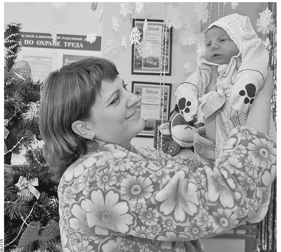
Вот такой подарок сделал малыш маме - родился 1 января и сразу стал для нее финансовой опорой.

● В 2018-м расширился перечень жизненно необходимых лекарств. Он пополнился шестьюдесятью новинками. Более всего противоопухолевых препаратов и иммунодепрессантов.