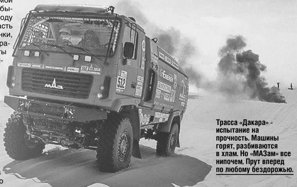
Трасса «Дакара» - испытание на прочность. Машины горят, разбиваются в хлам. Но «МАЗам» все нипочем. Прут вперед по любому бездорожью.

Хотя настоящая гонка только начинается. Из Перу участники переберутся