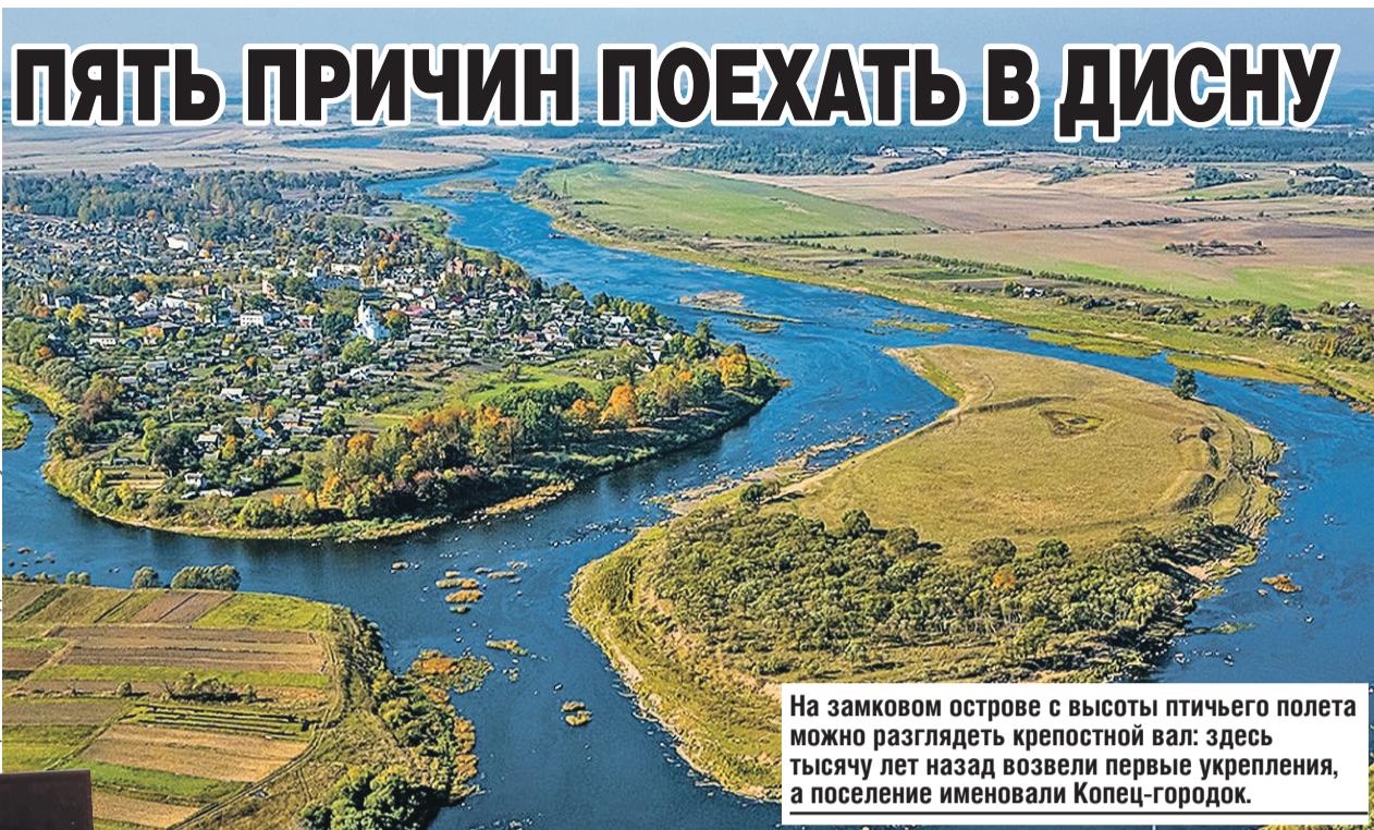
На замковом острове с высоты птичьего полета можно разглядеть крепостной вал: здесь тысячу лет назад возвели первые укрепления, а поселение именовали Копец-городок.