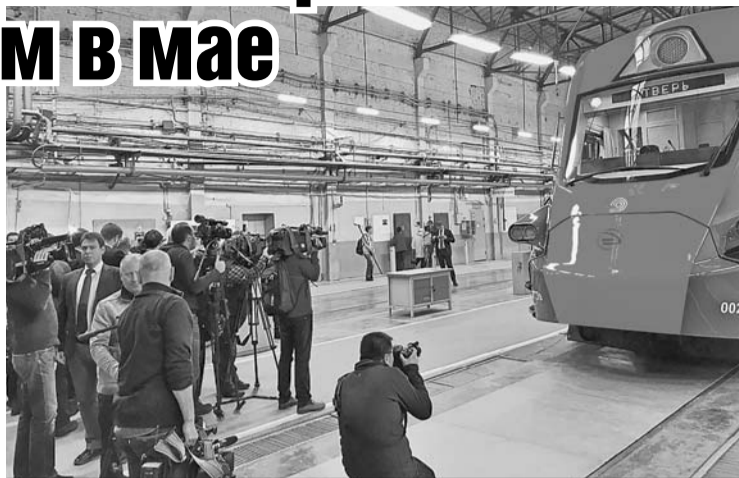
Увидев такую толпу иностранных акул пера и микрофона, на Тверском вагоностроительном заводе, похоже, удивились: они что, нашу «Иволгу» (поезд на фото) с космической ракетой перепутали?

- Посмотрел вашу новую продукцию - супер! Просто класс! - сказал он рабочим вагоностроителям. - Лучшее мирового уровня! И вас это