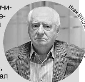
Иван ВАСИЛОВ/КМ media