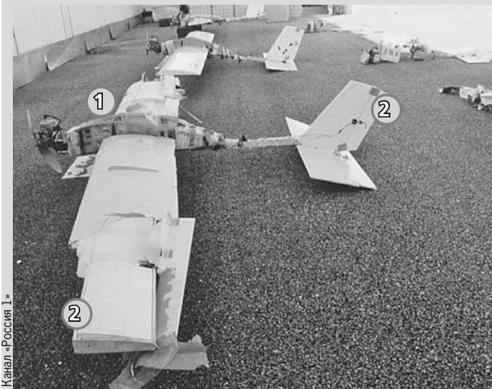
Минобороны России показало дроны террористов, которые удалось приземлить. Их электроника обмотана зеленым скотчем. Фюзеляж собран из досок ящика из-под фруктов (1). Крылья и хвост - из фанеры и пенопласта (2).

- Множество мин должно было взорваться, создав сплошное поле поражения. После этого дроны упали бы в Средиземное море, и никто бы не нашел следов. Но не вышло. Тут же выступил Пентагон, заявив, что все эти технологии «легко доступны на открытом рынке». Вот пусть поделятся, где находится этот «рынок» и какая спецслужба там торгует данными космической разведки. Теракт был задуман и исполнен квалифицированно. Пусть вас не смущает, что дроны были фанерными и обмотаны скотчем. Это сделано специально. Беспилотники из магазинов в диверсионных целях не используются, - пояснил Коротченко.