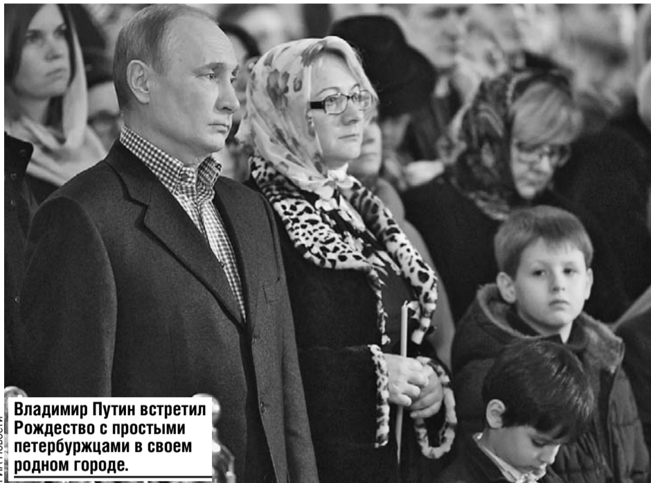
Владимир Путин встретил Рождество с простыми петербуржцами в своем родном городе.