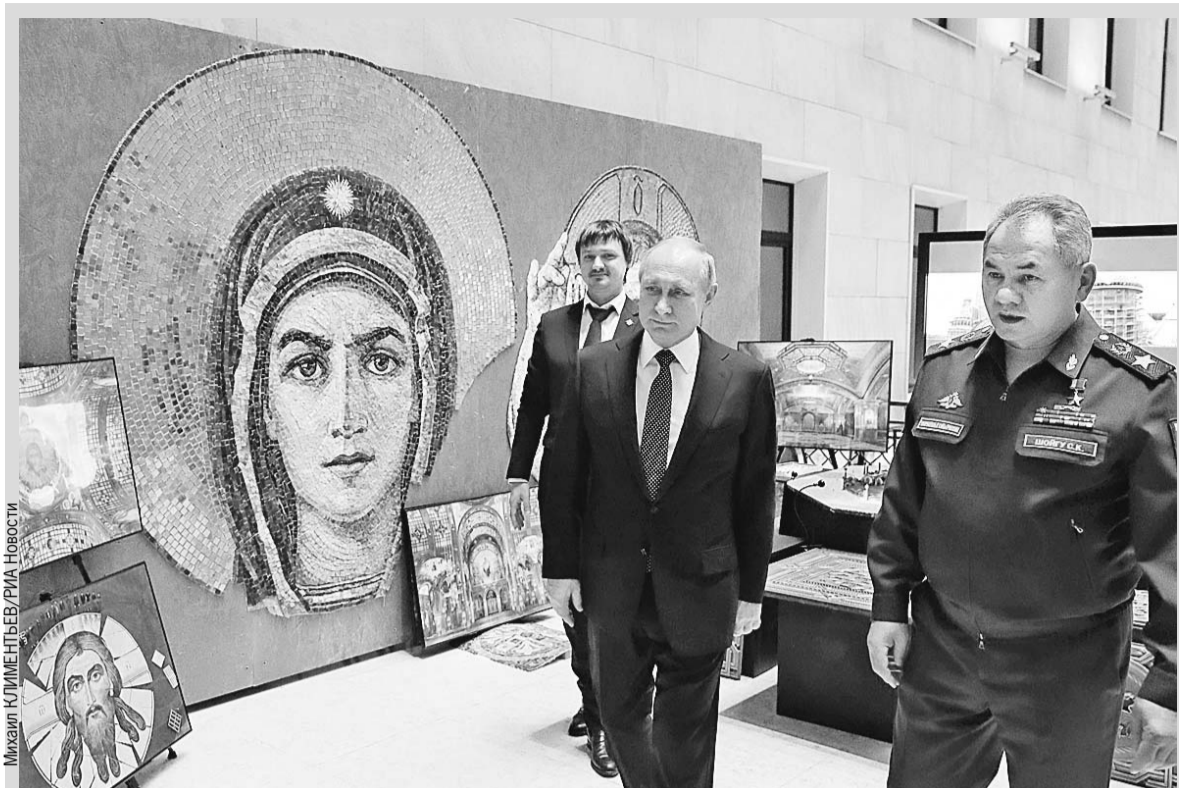
Владимир Путин приехал во вторник на ежегодную коллегию Минобороны. А перед этим Сергей Шойгу провел президента по выставке, на которой были не только новые вооружения, но и образцы внутреннего убранства Главного храма Вооруженных сил, который строится в Подмоскowie к 75-летию Победы.

- Я пью даже не чай, а заваренные, облитые кипятком травы с Алтая.