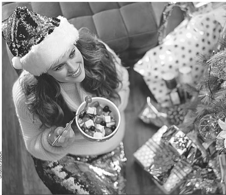
Даже полезной закуски должно быть в меру.

цепт. Картофеля кладите самый минимум, как будто это дорогой деликатес. Во-вторых, вместо покупного майонеза возьмите более легкую заправку (например, греческий йогурт или сметану) или сделайте домашний майонез. Так вы будете знать, что использовали самые свежие и натуральные компо-