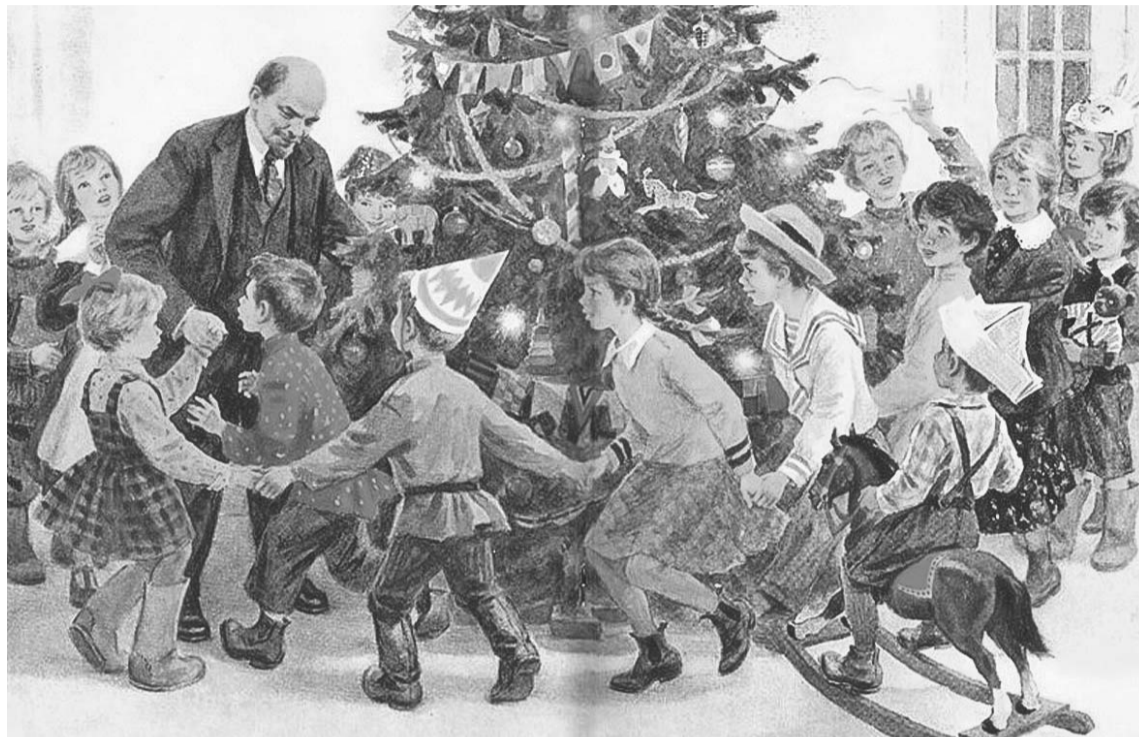
Детский новогодний хоровод с дедушкой Лениным. Поздравительная открытка. 1950-е годы.

ной хороминой на Красной площади, в Тайницком саду у зданий Старых и Новых приказов и у Лобного места, перед Спасскими воротами.