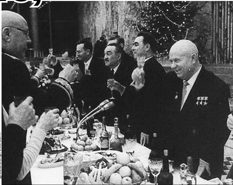
Маршал Советского Союза Семен Тимошенко (на фото - слева) поздравляет первого секретаря ЦК КПСС Никиту Хрущева с Новым годом. Справа от Никиты Сергеевича - его соратники Леонид Брежнев и Анастас Микоян. Москва, Кремль, декабрь 1963 г.

Постышев так и сделал: осудил «левый елочный загиб» и рекомендовал «положить ко-