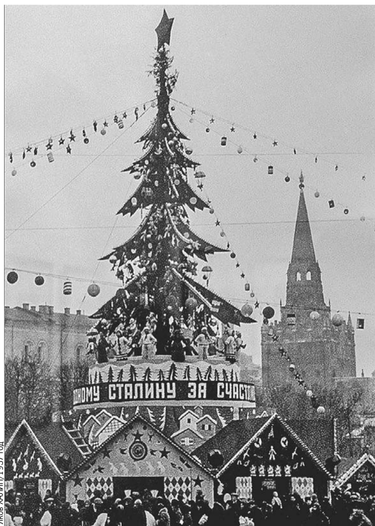
Москва, елка у Троицких ворот. В Кремле - товарищ Сталин, а на новогодней елке среди украшений - здравица в честь великого вождя. 1937 год.

Оказывается, в то время государь заложил не один, а целых три Александровских сада - Верхний, Средний и Нижний - от Угловой Арсенальной до Водовзводной башни: для «красоты, прогулок и праздных забав». Сегодня сад перестали делить на части: теперь он просто один Александровский. Но 200 лет назад народ охотнее всего шел именно к верхней большой рождественской и новогодней елке - у декоративного грота «Руины».