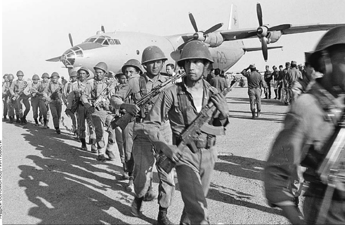
Советский спецназ высаживается в Афганистане. Весна 1988-го.

В самом СССР эта война поначалу держалась в секрете. Газеты и телевидение хранили молчание о ее размахе и потерях, сообщая лишь об исполнении «интернационального долга» в Демократической Республике Афга-