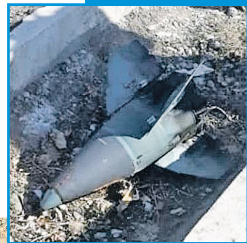
Головной обтекатель боевой части ракеты, поразившей «Боинг».

В итоге, несмотря на всю взаимную неприязнь, и Запад, и Иран неожиданно сходятся в одном: запуск той роковой ракеты «земля - воздух» произошел по ошибке. Похоже, это объяснение и можно считать наиболее близким к правде?