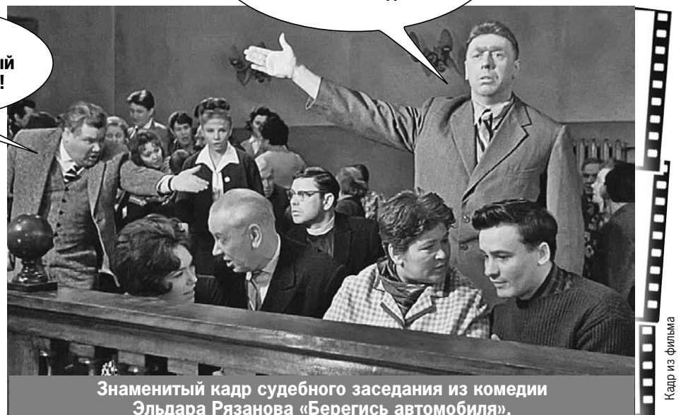
Знаменитый кадр судебного заседания из комедии Эльдара Рязанова «Берегись автомобиля».

- Для нас, элиты, должен быть особый Уголовный кодекс!