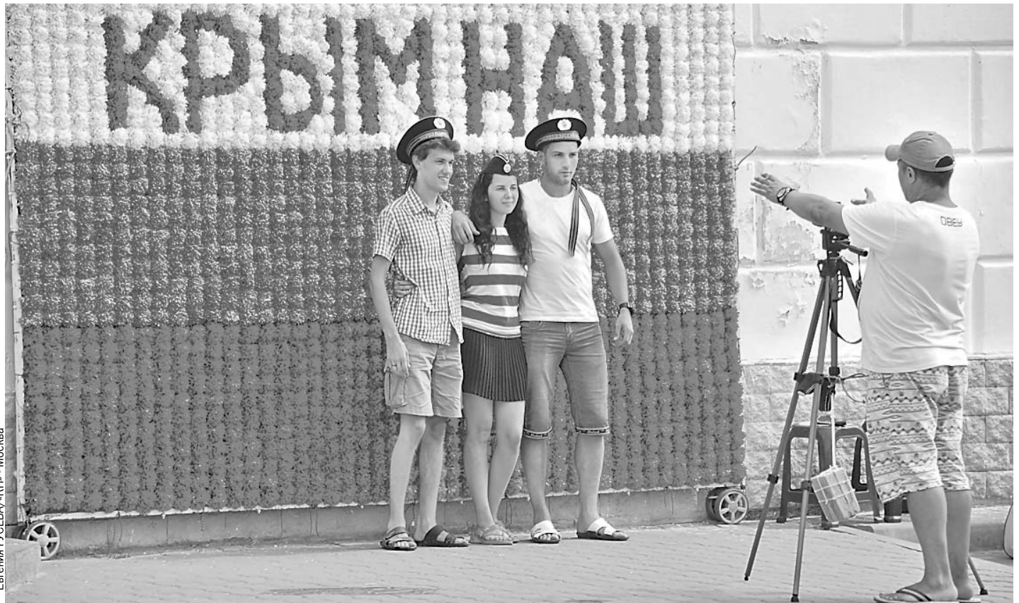
Евгения Гусева/«КП» - Москва

- С Крыма и ушла информация, - нервно смотрит в окно Майкл. - Вот что обидно.