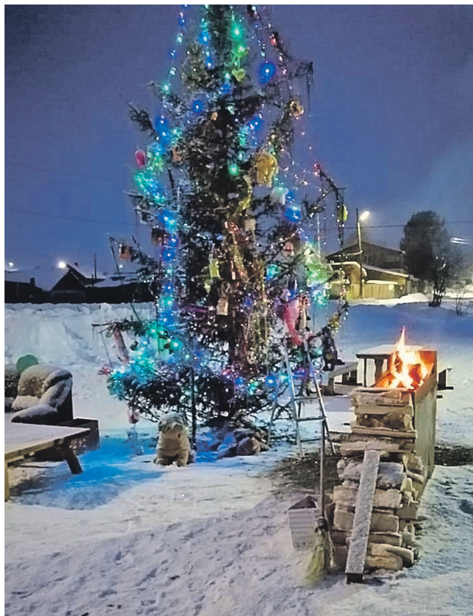
Не бог весть какая красота, но местным жителям это местечко нравилось - обустроили его всем селом.