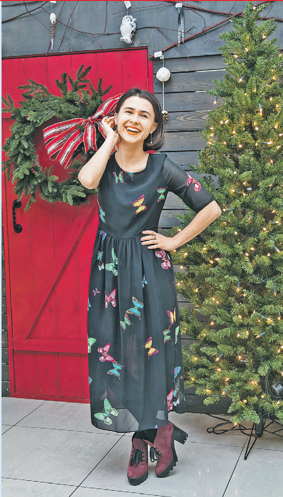
Мария ЛЕНЦ/«КП» - Красноярск