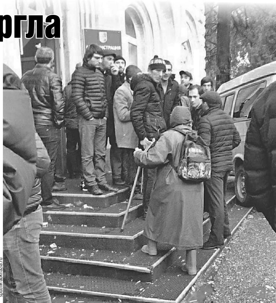
Бабушка пришла в Сухум ко дворцу за пенсией - а тут опять революция!

Хаджимба не захотел (или не смог) защитить даже своего вице-президента, которого побили какие-то влиятельные люди. Не