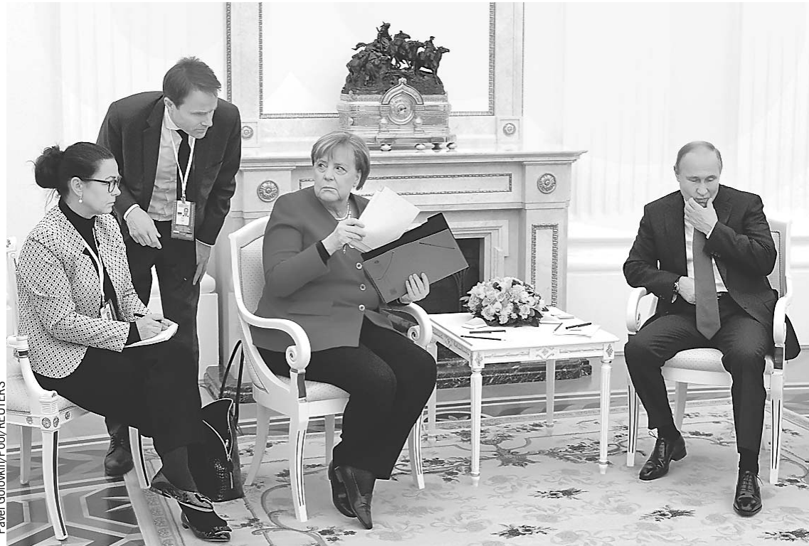
Канцлер Ангела Меркель прилетела в Москву, чтобы подтвердить президенту Владимиру Путину свою решимость сделать все ради получения газа из России напрямую.

стоятельно, без привлечения иностранных партнеров, - подтвердил Путин. - Вопрос в сроках. Это единственный вопрос, который встанет в этой связи. Окончание строительства будет отодвинуто на несколько месяцев.