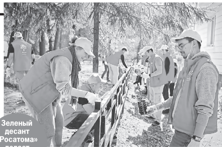
Зеленый десант «Росатома» делает природу чище.

«Росатом» реализует проекты в городах присутствия. В этом году к ним присоединился Энергодар, в котором располагается самая крупная в Европе атомная электростанция - Запорожская АЭС. Жители Энергодара переживают непростые времена, и семья «Росатом» решила их поддержать проведением марафона «Росатом вместе с Энергодаром». Так сотрудники Госкорпорации оказывают поддержку жителям