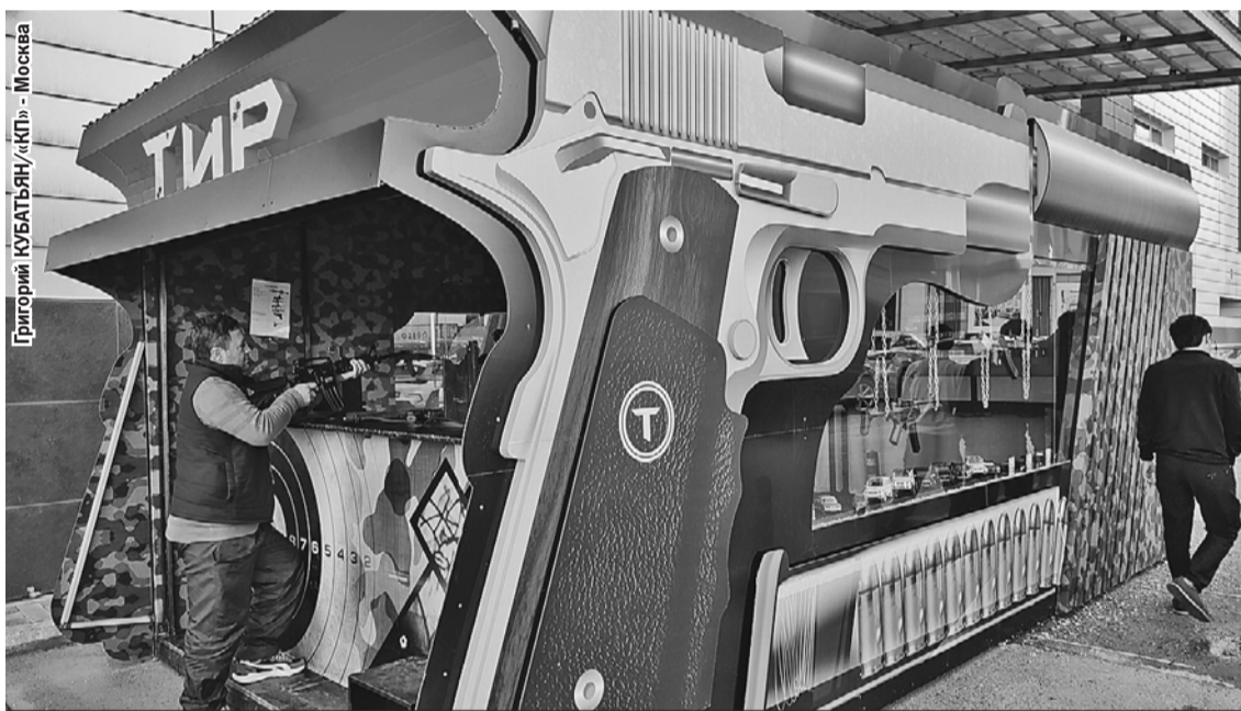
Если в Душанбе вам про кого-то скажут: «Он оружие в руках не держал, стрелять не умеет», это будет полуправдой. Тиров тут полно, и пострелять в них любят многие.

Решение есть. В России нужно реформировать миграционную систему, об этом уже и Путин сказал. А с Таджикистаном восстанавливать прежние экономические и культурные связи. Возвращать в республику русских специалистов, строить заводы. Но быть готовыми