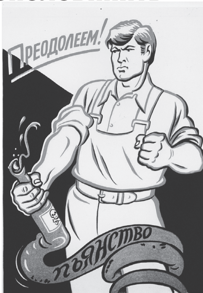
Врачи единодушны: алкоголь - яд. Поэтому если и принимать его, то в маленьких дозах.

Обратите внимание: даны цифры чистого спирта. Для конкретного алкоголя их нужно будет пересчитать в зависимости от крепости напитка.