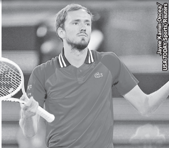
Даниил Медведев: «А меня-то за что в иноагенты, я вам что – Алла Пугачева?»

«В жизни каждый человек имеет право на свое мнение – так же как я имею право быть с ним не согласным. У всех свои причины думать так, а не иначе. Со своей стороны, повторяю: если будет возможность – с удовольствием пое-