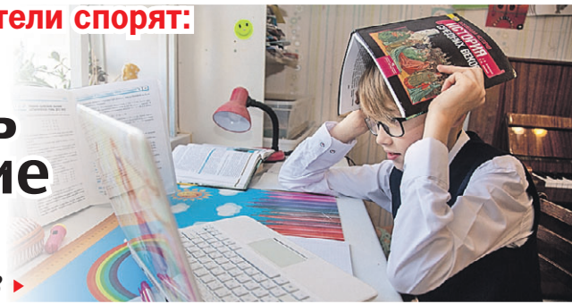
Николай ОБЕРИЧЕНКО/«КТ» - Пермь