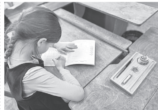
Семейный центр «Ладимир».

В Великом Новгороде создали классы по программе Русской классической школы.