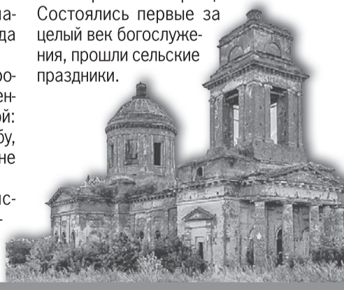
Храм Богоявления Господня расположен в селе Донская Негачевка Хлевенского района Липецкой области.

Благодаря проекту в поселке Грибоедово Тульской области над обезглавленным храмом появилась крыша, в селе Каменка Ленинградской области создан чертёж, по которому воссоздадут часть церкви. Для Георгиевского храма в Ивановской области проведено 3D-сканирование и разработан проект консервации. Состоялись первые за целый век богослужения, прошли сельские праздники.