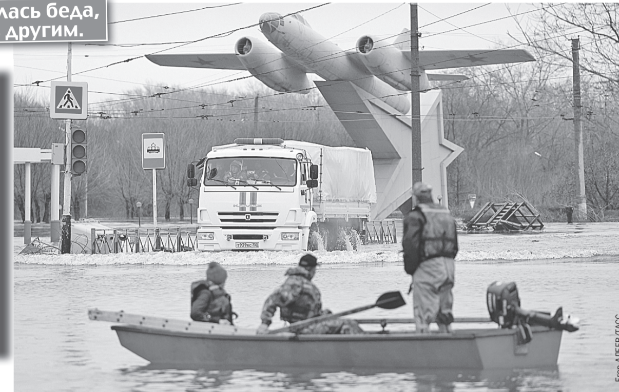
Спасатели вывозят пострадавших на лодках. Уровень воды в некоторых районах Орска выше 4 метров.