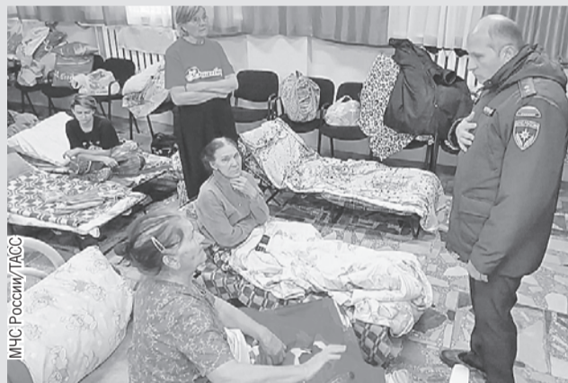
Глава МЧС Александр Куренков навестил людей в пункте временного размещения.

нистр отправился в зону бедствия еще в субботу вечером, после распоряжения президента) и губернатор Денис Паслер доложили главе страны о развитии ситуации около Орска. Кроме того, Путин поручил главе МВД не допустить мародерства в районах бедствия. И обеспечить охрану правопорядка, а также имущества граждан.