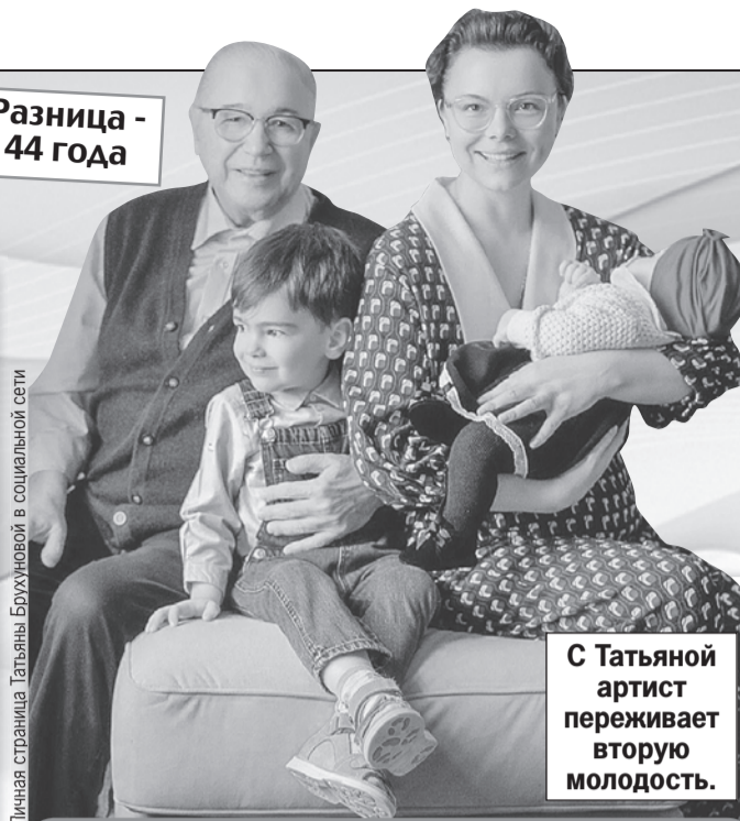
Личная страница Татьяны Брухуновой в социальной сети