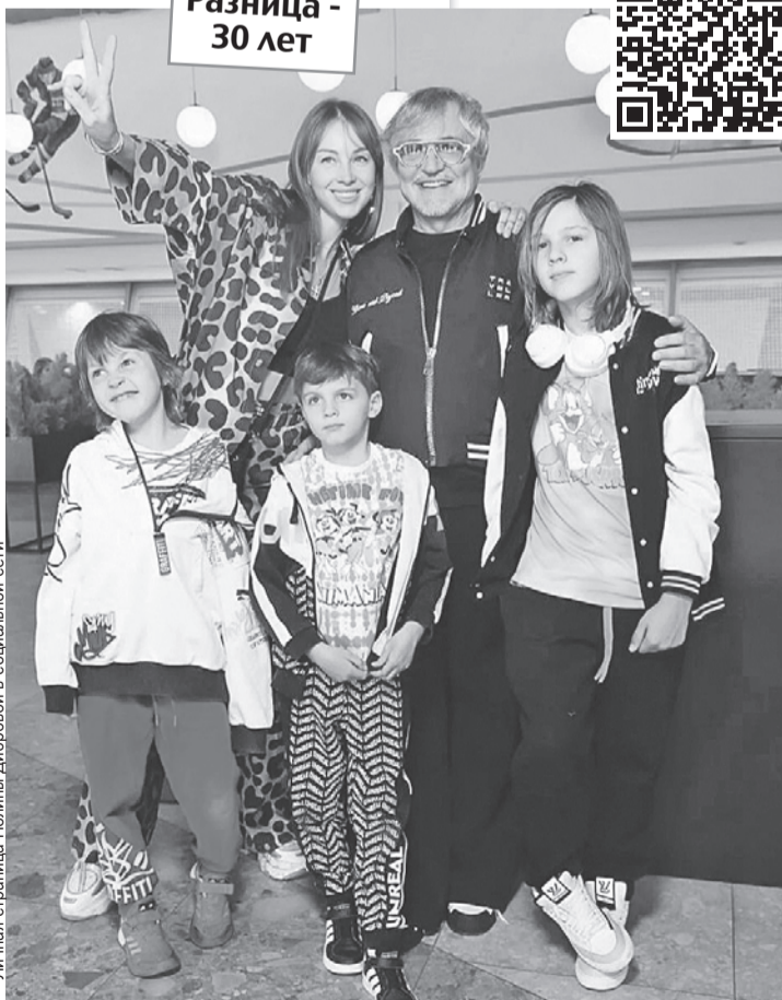
Личная страница Полины Дибровой в социальной сети