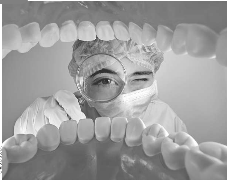
Стоматологи стараются зреть в корень. И считают: многие проблемы отрасли мы в состоянии решить своими силами. Но не все...