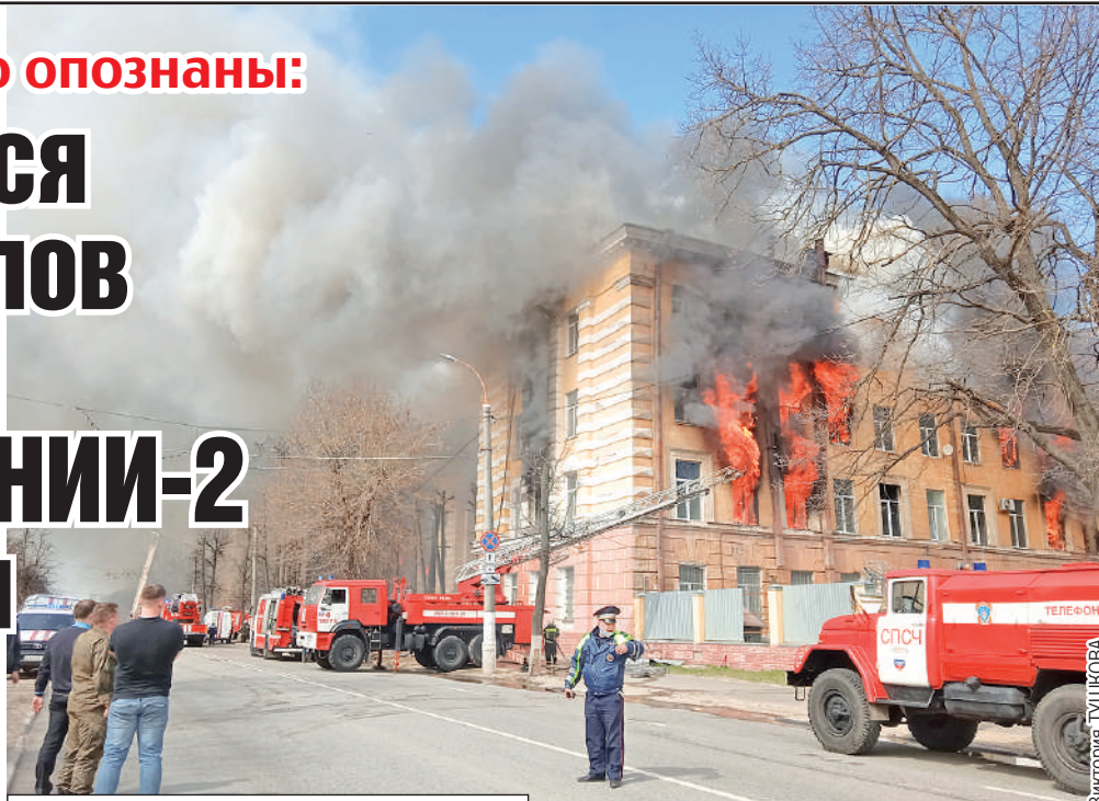
В причинах страшного пожара в здании НИИ-2 разбирается военная прокуратура.

Как и предполагали многие, первоначально озвученное число жертв оказалось не окончательным. В день ЧП, 21 апреля, было объявлено, что в огне погибли шестеро сотрудников НИИ. Но в дальнейшем при разборе завалов нашли ещё тела... Сейчас работы на пепелище продолжают, задействованы 75 человек и 9 единиц