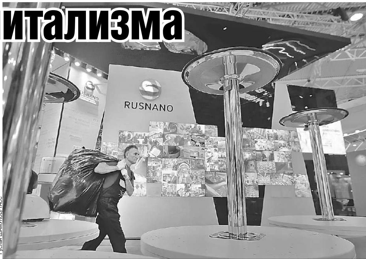
Конечно, были у «Роснано» и успехи. Но провалов - гораздо больше. В результате сотни миллиардов рублей были просто выброшены на помойку.