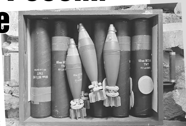
На складах нашлось много боеприпасов из стран НАТО, и прибыли они явно не вчера...

Главная достопримечательность Балаклеи - это старейший и чуть ли не крупнейший в Европе арсенал № 65. С 2014 года именно отсюда боеприпасы всех возможных калибров отправлялись в Донбасс - бомбить мирные города. В 2017 году на складах случился пожар,