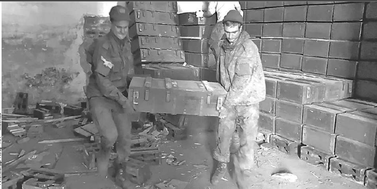
Александр КОЦ / «КП» - Москва

Тысячи тонн снарядов и мин оказались очень кстати для ведения спецоперации.