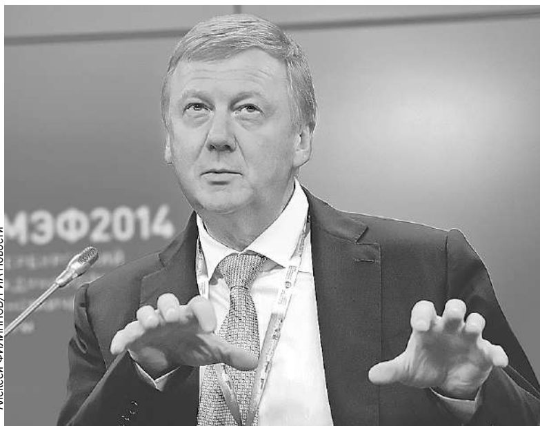
Анатолий Чубайс и его команда стали заниматься инвестициями и нанотехнологиями, не имея представления о том, как все это работает. Отсюда и такое количество провалов.