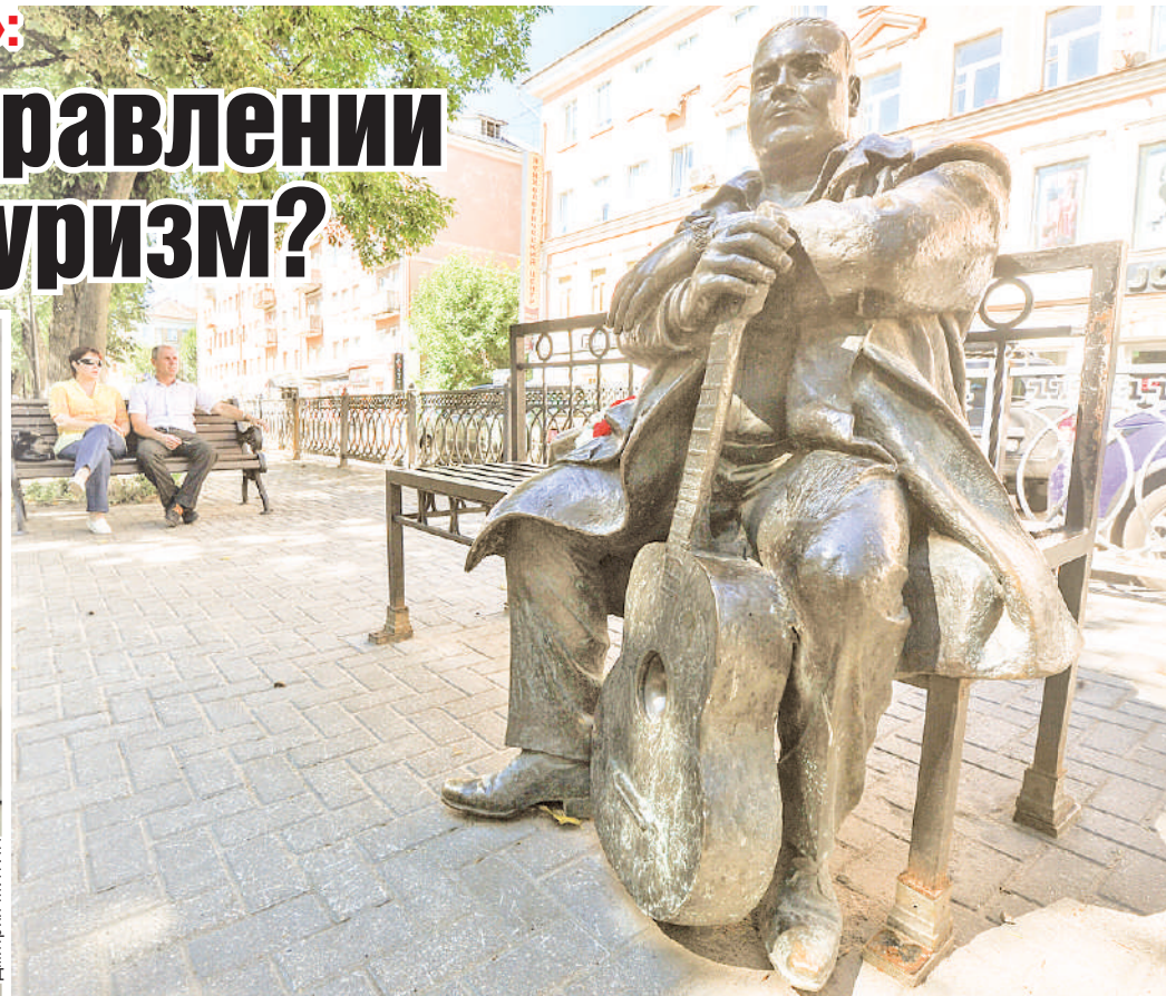
Фигуру Круга не раз хотели убрать с бульвара Радищева, но пока подвинуть бронзового шансонье не удалось.

- Знаете, сколько фигур бобров установлено в Бобруйске? А у нас козлов - ни одного! Городу нужны козлы, к ним будут приезжать люди, фотографироваться, рога тереть на удачу. Козёл - это необычно, забавно. Если в это вложиться, в ответ вы получите гораздо больше! Идей вообще огромное количество. И не только про козлов. Я ещё три музея ор-