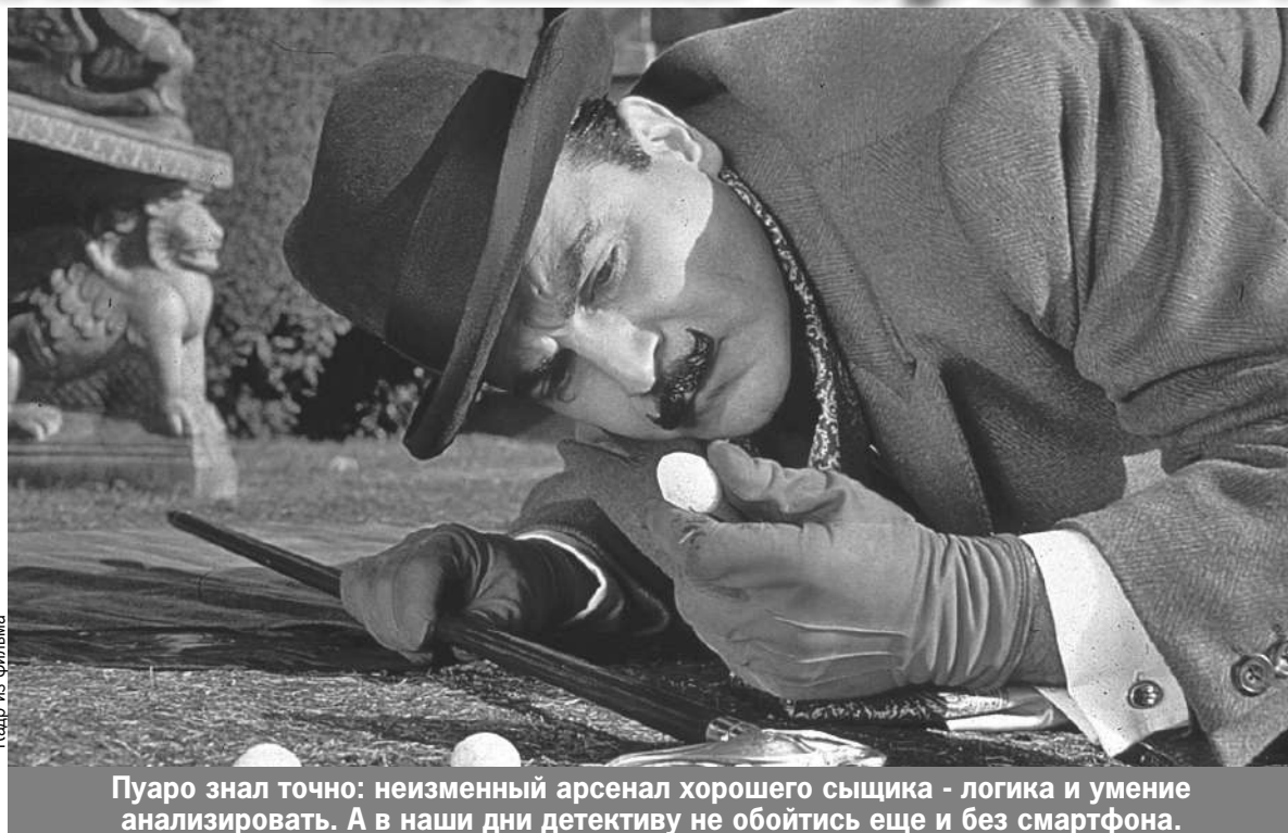
Пуаро знал точно: неизменный арсенал хорошего сыщика - логика и умение анализировать. А в наши дни детективу не обойтись еще и без смартфона.