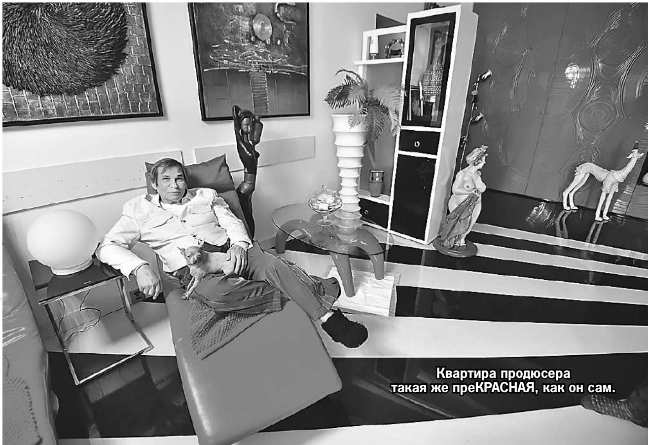
Квартира продюсера такая же прекрасная, как он сам.