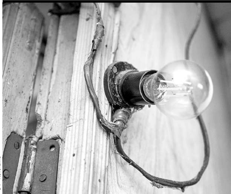
Аварийная проводка является угрозой пожара.