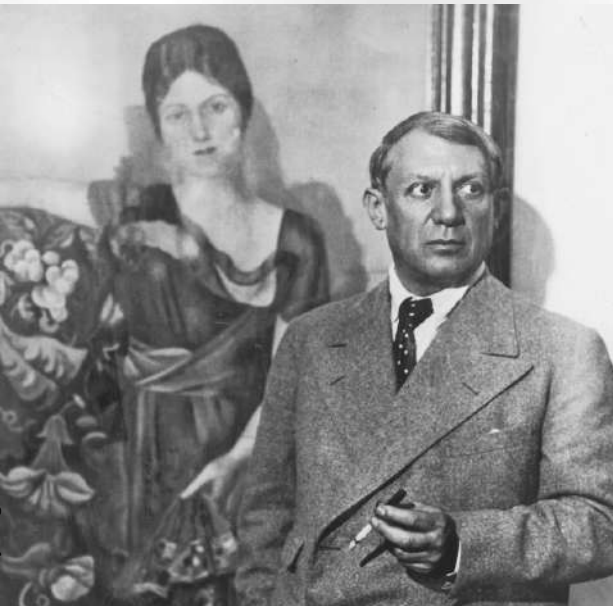
Пабло Пикассо и «Портрет Ольги в кресле».

шает уйти от Пабло, но тот, не желая по закону отдавать половину своего имущества жене, отказывает ей. «Каждый раз, когда я меняю женщину, я должен сжечь ту, что была последней. Таким образом я от них избавляюсь. Это,