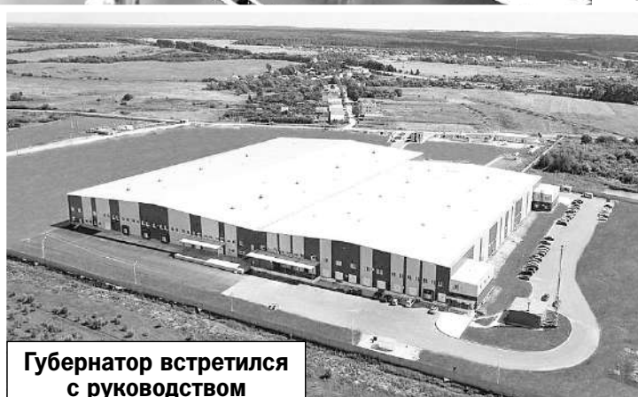
Губернатор встретился с руководством компании непосредственно на территории комплекса.

Общая площадь выкупленного комплекса составляет 27 тыс. квадрат-