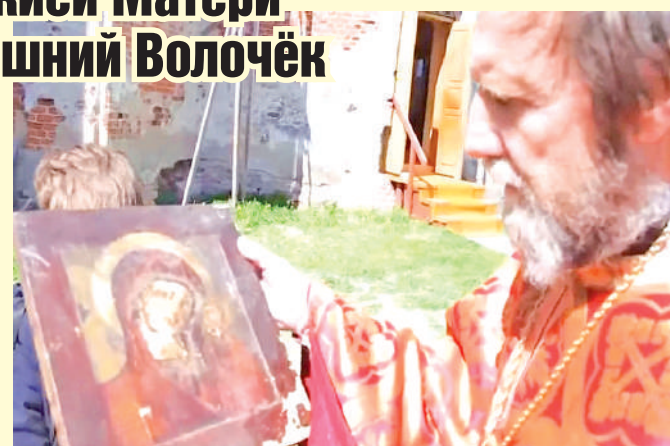
Несмотря на долгое пребывание в воде, икона хорошо сохранилась, виден лик Богородицы.

- Икону видели и мужчина с женщиной, но не захотели спускаться к воде. Берег реки Тверцы в этом месте достаточно крутой и илистый. Но образ Пресвятой Богородицы достали дети, которые приехали в этот воскресный день вместе с родными на престольный праздник, - рассказал настоятель храма протоиерей Андрей Храмов .