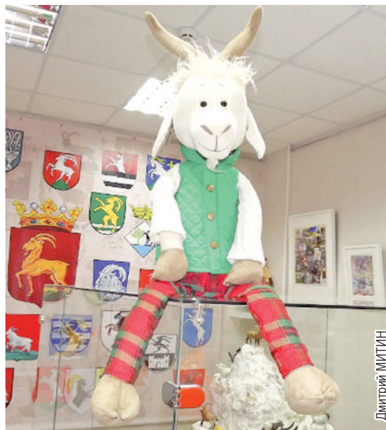
Музей козла с его уникальными экспонатами дальше развиваться уже не может - помещение не позволяет.

шева и Музей козла сегодня объективно являются тем, что называют точками притяжения. Круга любят и помнить будут ещё долго. Музей козла - совершенно уникальный и недооценённый проект в городе, чьим негласным символом исторически является это занятное животное.