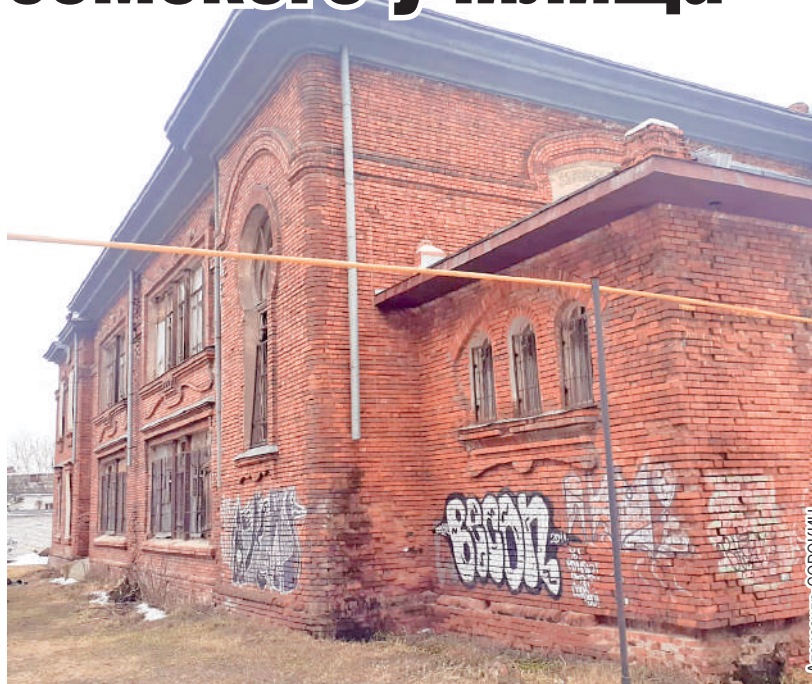
Кое-где старинное здание «украсили» граффити-рисунками.

Но вернемся в сегодняшний день. Начальная цена контракта - 69 млн 900 тыс. рублей. Указано, что это средства федерального бюджета. В ре-