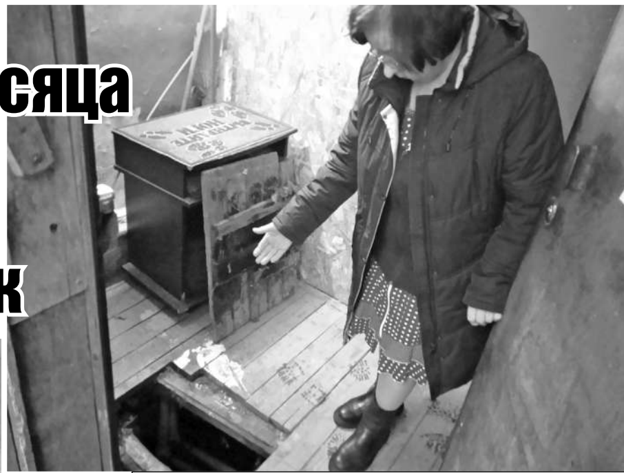
Жильцы существуют в условиях коммунальной катастрофы: канализацию прорвало, а по потолку и стенам бежит вода.

- В последний раз мы были в этом доме с прокуратурой где-то около недели-полтора назад. С крышей всё было в порядке: снег счищен, сосульки сбиты. Подвал был слегка подтоплен, но в городе сейчас, наверное, и нет неподтопленных подвалов, - сообщила «КП»-Тверь» по телефону специалист ГЖИ. - Управляющая компания насчёт ситуации в курсе. Мы им уже выдавали предостережение. Больше я вам ничего сказать не могу, бригады быстрого реагирования по осушению подвалов у нас нет.