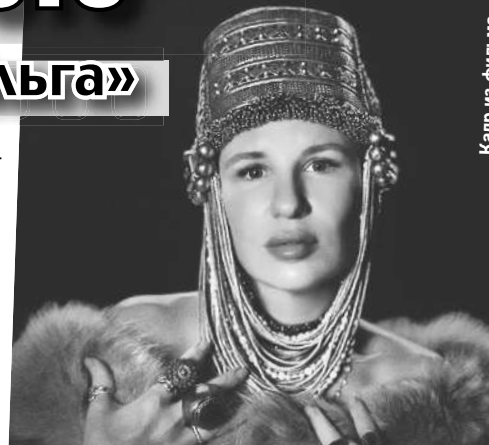
Валерия подумала-подумала... И утвердила на главную роль себя.

- Этот проект выводит меня как художника на новый уровень, - считает она. - Давно хотела снять историческое кино. Будет много ручной камеры, длинных кадров, которые