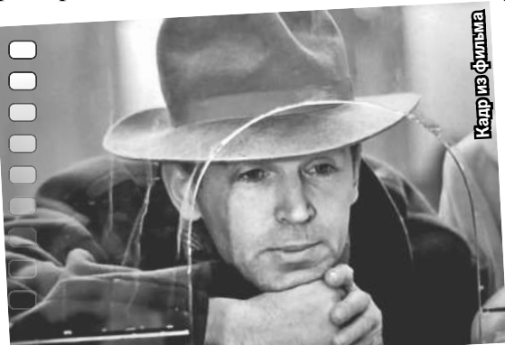
Принципиальный Ильин, сохранивший любовь, несмотря на войну («Пять вечеров»).

ный удар. Вот говорят, что любовь - опасное чувство, но еще страшнее - театр! Я уже написал диплом, я учился в кислородно-сварочном техникуме. Но я забыл про свой диплом, меня куда-то понесло! Мог ли я себе тогда представить, что Степанова, пронзившая мне сердце, станет моей партнершей в «Тартюфе» Анатолия Эфроса?».