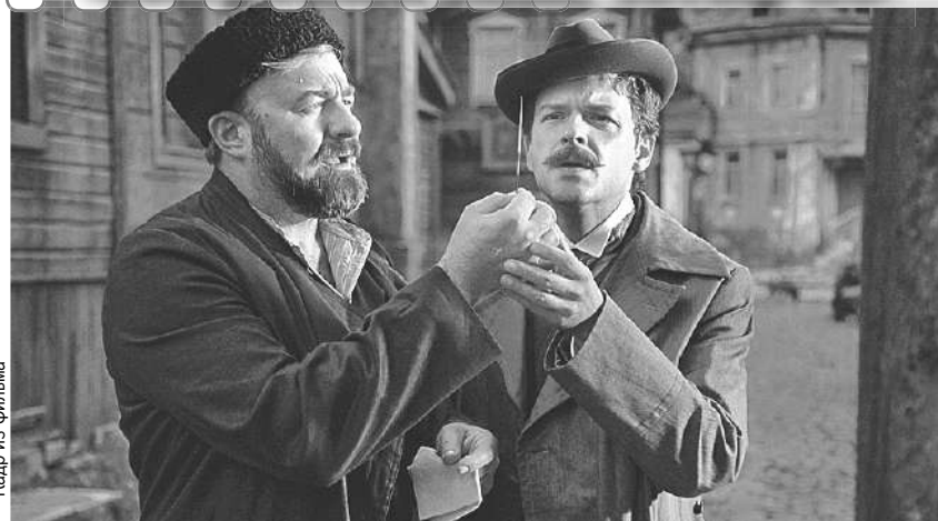
Гияровский (слева, Михаил Пореченков) и Станиславский (Константин Крюков) постигают зловецкие тайны московского дна.

Этот фильм снимает Карен Шахназаров , и сюжет исторического детектива весьма нетривиален. По крайней мере вместе будут взаимодействовать персонажи, которых совсем не ожидаешь увидеть рядом друг с другом, - Константин Сергеевич Станиславский и Владимир Алексеевич Гияровский .