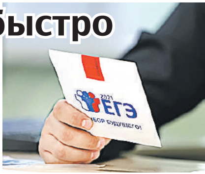
Мария ЛЕНЦУ/«КП» - Красноярск