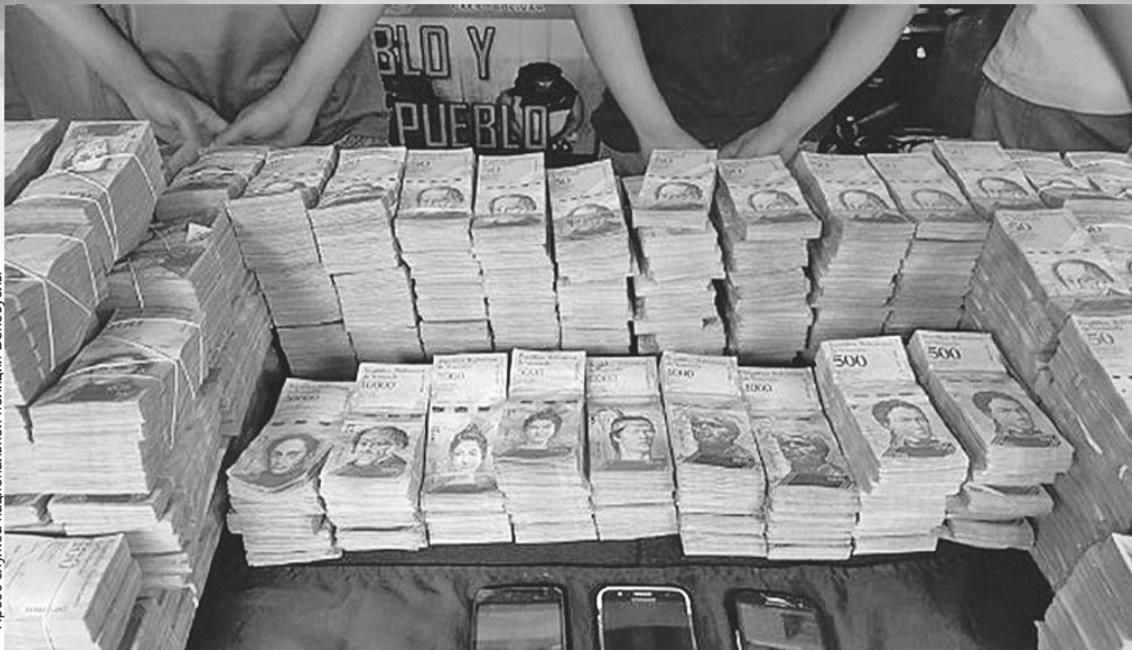
Это изъятые полицией Каракаса у подпольных менял венесуэльские деньги. Всей этой кучи едва-едва хватит, чтобы купить хотя бы пару килограммов картошки. Да и то раздобыть столько налички - это чудо по нынешним непредсказуемым венесуэльским временам.

Повальное использование карточек привело к постоянным очередям практически везде. Поход в магазин может затянуться на полчаса, а то и больше, ведь процедура ввода информации в платежный аппарат здесь небыстрая: надо предъявить паспорт, который дотошно просмотрят, потом указать сумму (которую еще несколько раз перепроверяют, чтобы не набить лишним