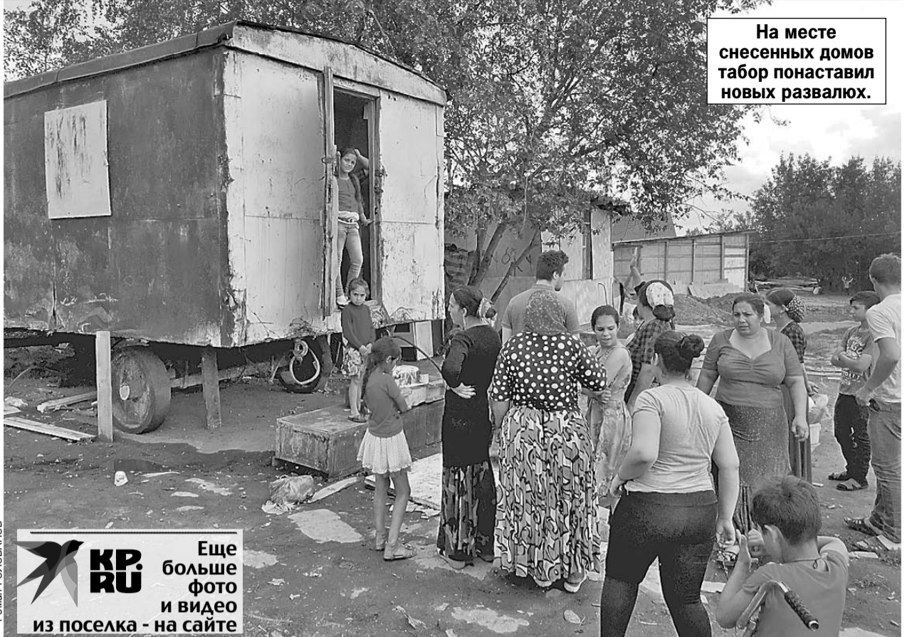
На месте снесенных домов табор наставил новых развалюх.

А как смотрит на проблему тульская власть? За чашкой кофе мы поговорили с депутатом Тульской областной ду-