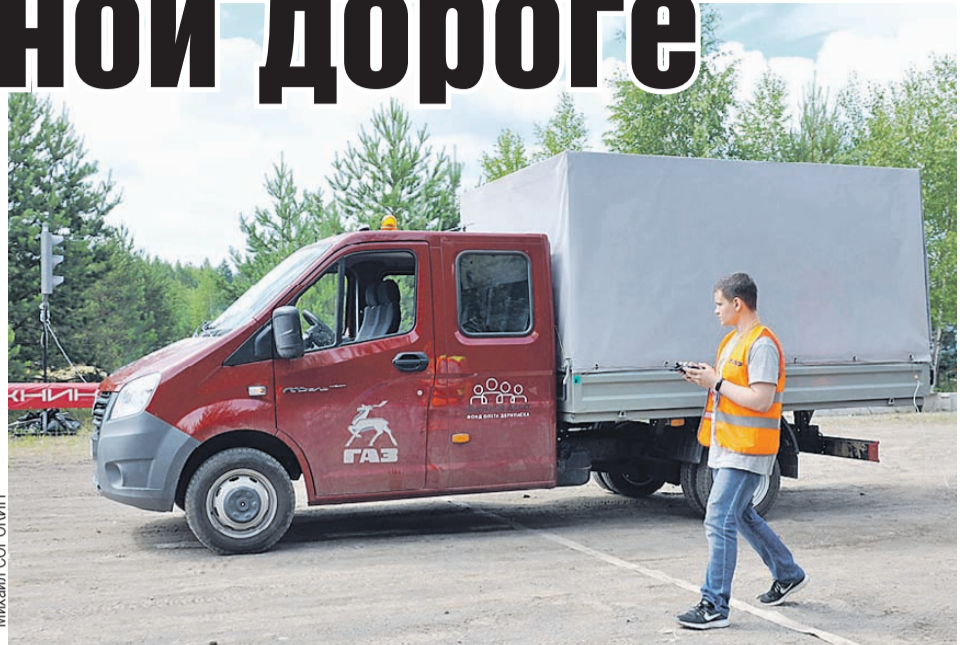
Беспилотник «ГАЗель NEXT» на студенческих соревнованиях «Робокросс».

ГАЗ первым из российских производителей стал заниматься беспилотниками. Еще в 2010-м компания начала участвовать в программе «Робототехника», и вот уже девятый год беспилотные машины, переоборудованные командами ведущих технических вузов страны, разъезжают по полигону. С 2017-го к основному регламенту соревнований добавлены задания по разработке автоматизированных систем помощи водителю ADAS (Advanced driver assistance systems). Добавлены не просто так: стратегия развития ГАЗа предусматривает планы по оснащению транспортных средств подобными системами, чтобы снизить риски ДТП, происходящих по вине человека, и сделать владение техникой удобнее. Это такие функции как предупреждение о сходе с полосы движения, экстренное автоматическое торможение перед внезапно возникшим препятствием, интеллектуальное ограничение скорости, предупреждение