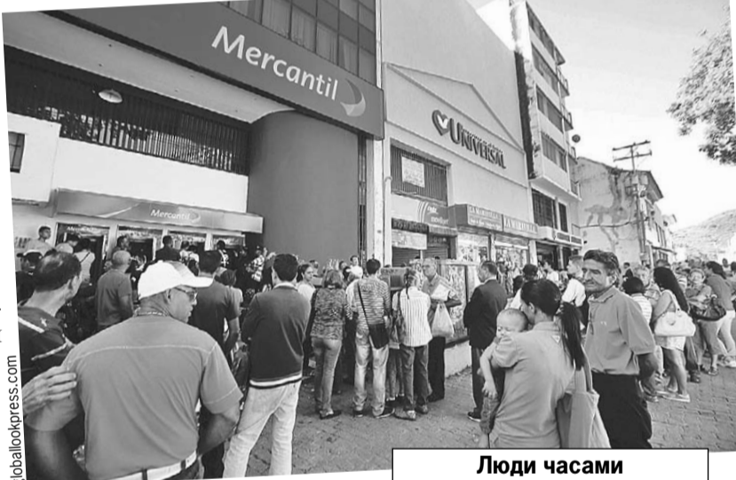
Люди часами простаивают у банкоматов, а на руки им выдают самые мизерные суммы.