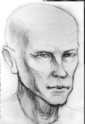
СУ СКР Нижегородской области

Читательница «Комсомолки» предположила, что незнакомец из парка и человек на фотороботе очень похожи. А вы как считаете?