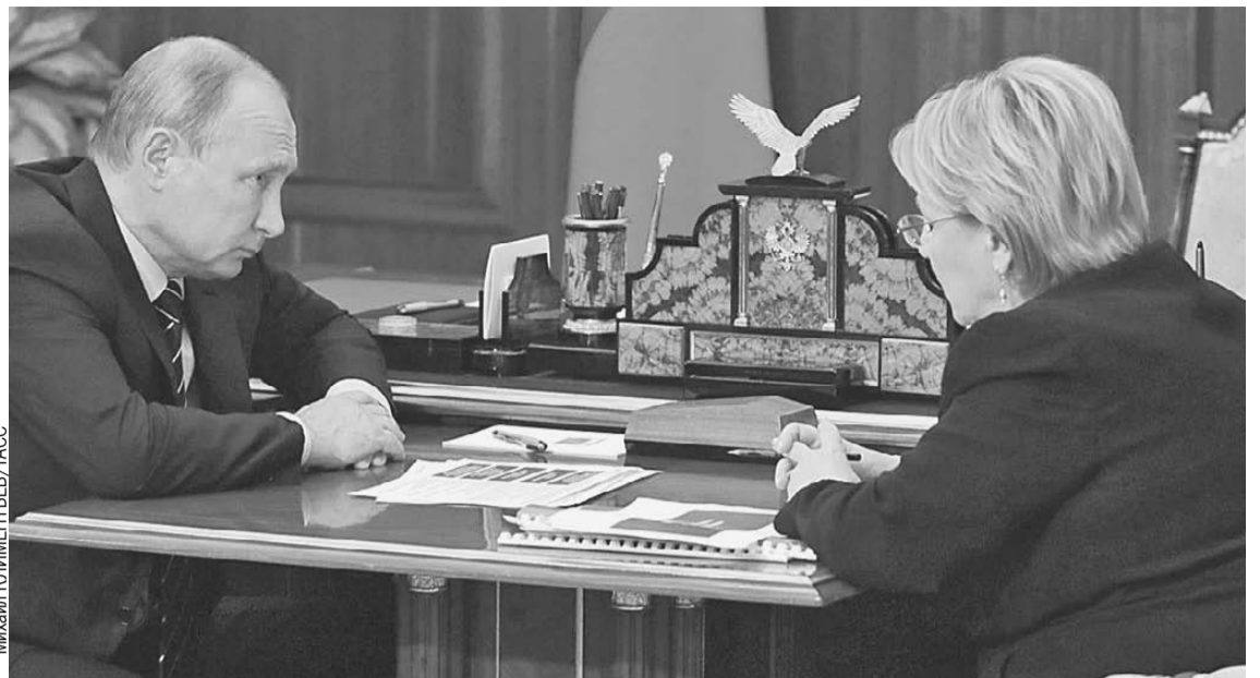
Вероника Скворцова доложила президенту, что к 2021 году проблема недоступности врачебной помощи перестанет существовать даже в самых отдаленных уголках страны.

- Уровень поднялся с 20 тысяч до более 110 тысяч, - рас-