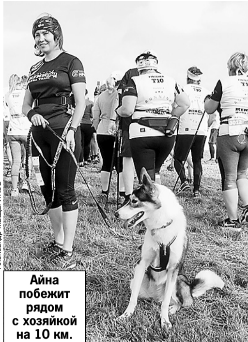
Айна побежит рядом с хозяйкой на 10 км.

В 7.30 у стартового коридора собрались 900 бегунов, их ждал самый оживленный маршрут в 30 километров. Бегуны срывались с места в три приема по 300 человек. В первом старте вместе со спортсменами рванул черный лабрадор на поводке, бедняга, уже в этот утренний час начинало жарить солнце. Всю дистанцию он не пробежал, сошел раньше. А люди держались, несмотря на жару, их активно подбадривали болельщики.