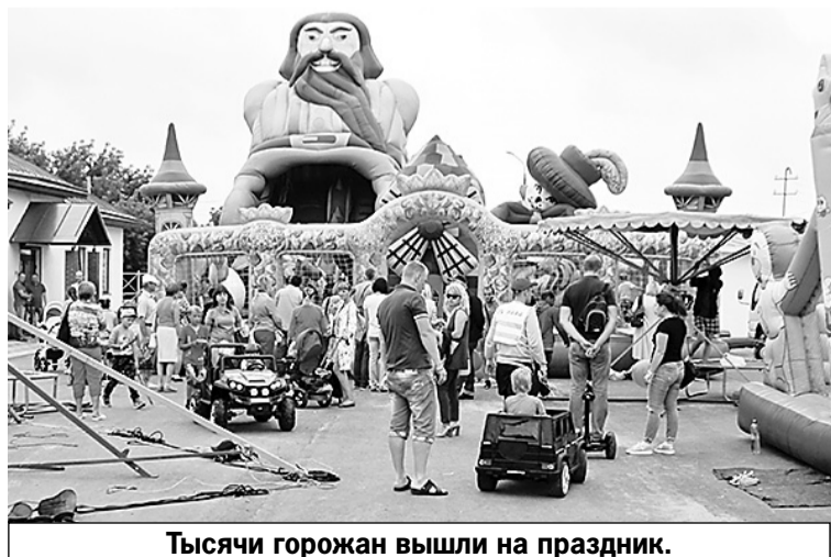
Тысячи горожан вышли на праздник.

К юбилею в городе была отремонтирована районная поликлиника, культурно-досуговые центры, школы и детские сады, преобразились дворы, сквер имени Патоличева, городская площадь, открыт туристический информационный центр. Возрожден промысел гороховецкой рубленой игрушки, посажена аллея знаменитой владимирской вишни и многое другое. В ближайших планах - открытие современного стадиона и строительство набережной Клязьмы. Гороховец стал настоящим украшением Малого Золотого кольца России. Администрация области проделала колоссальную работу, чтобы город достойно встретил 850-летие.