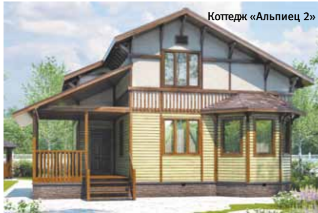
Коттедж «Альпиец 2» «Альпиец-1» 9,0x9,0 м (каркас) — 1 633 230 руб. 1 306 590 руб. «Альпиец-2» 11,0x11,0 м (каркас) — 2 158 650 руб. 1 726 920 руб. Срок строительства: 45-50 дней