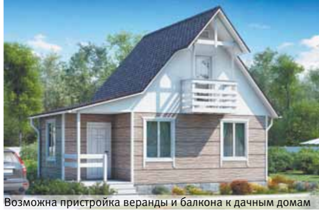
«Престиж К-150» 6,0x5,0 м (каркас) — 375 000 руб. 291 320 руб. «Престиж Б-100» 6,0x5,0 м (кл. брус) — 435 430 руб. 365 760 руб. «Престиж Б-150» 6,0x5,0 м (кл. брус) — 509 170 руб. 427 700 руб. Срок строительства: 6 дней