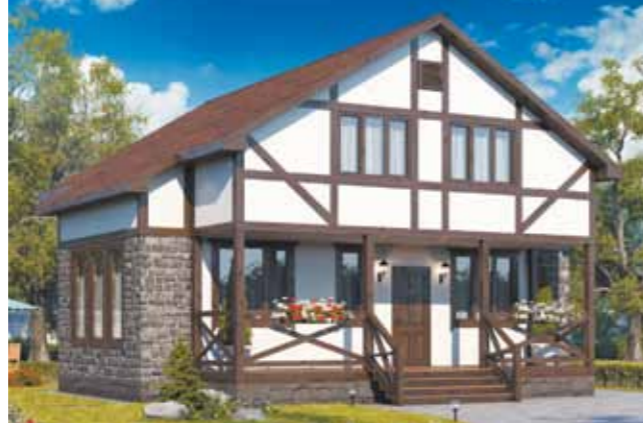
«Феникс-3К» 10,0x10,0 м (каркас) — 1 515 550 руб. 1 098 800 руб. «Феникс-3Б» 10,0x10,0 м (кл. брус) — 1 650 380 руб. 1 388 800 руб. Срок строительства: 30-45 дней