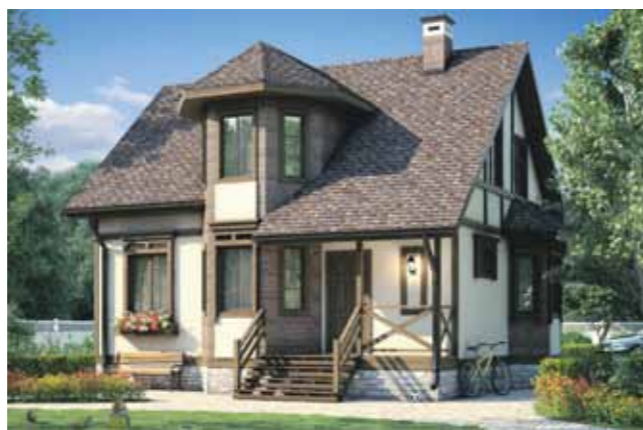
«Яхрома» 8,0x9,7 м (каркас) — 1 650 750 руб. 1 355 500 руб. «Яхрома БК-140» 8,0x9,7 (кл. брус) — 1 904 320 руб. 1 578 870 руб. Срок строительства: 45-65 дней