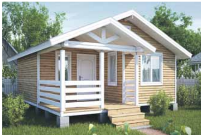
Возможна пристройка веранды и балкона к дачным домам Бани для круглогодичного использования по цене от 165 700 руб. Печь в подарок