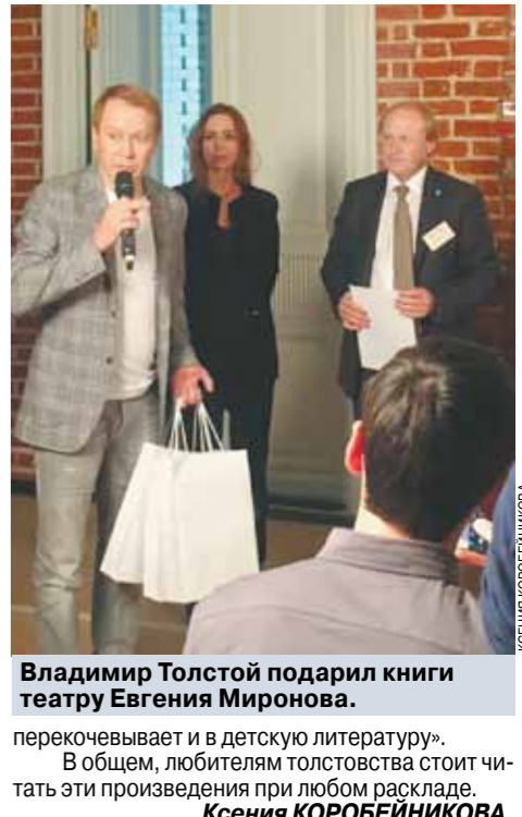
Владимир Толстой подарил книги театру Евгения Миронова.

Шеварнадзе. На Шнура, такого сегодня модного и всенародного, должен прийти зритель. И Шнур действительно совсем не тот, что в своих «отморозченых» песнях. Он тут белый и пушистый. Понимающий. Умный и проникновенный. Не ругающийся ни на раз матом!