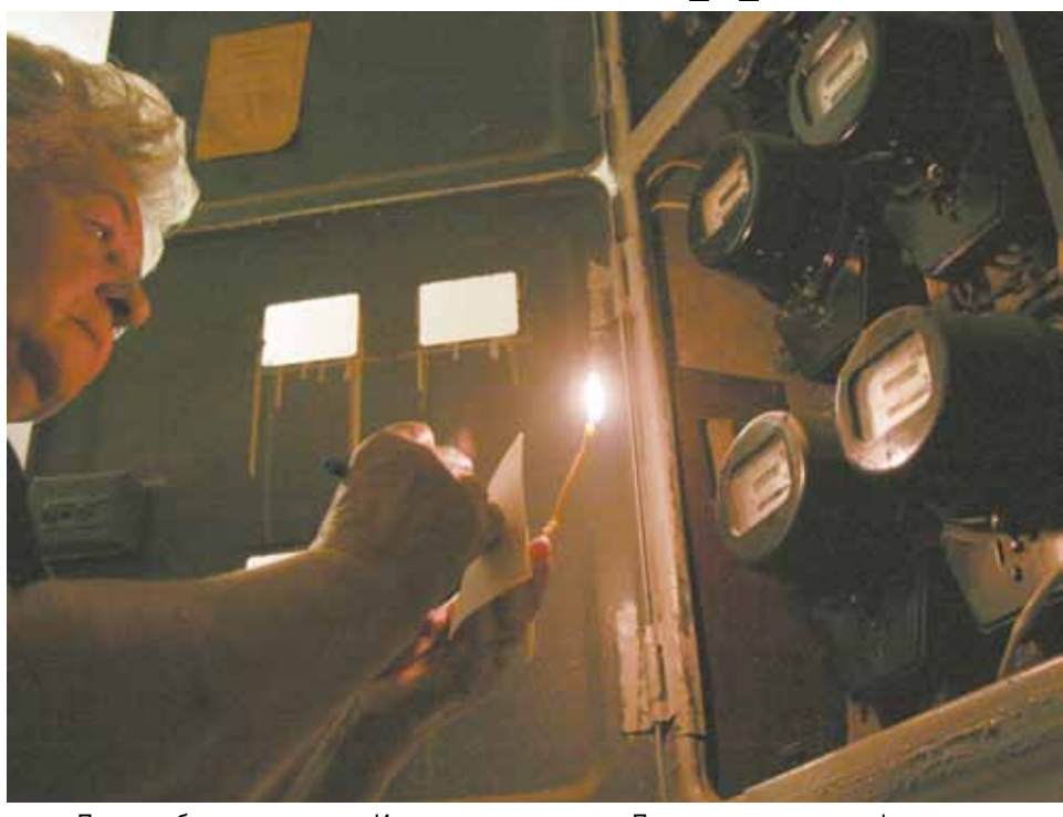
...После публикации статьи «Инвалидам и чернобыльцам уменьшили льготы по оплате электричества» в редакцию газеты посыпались звонки. Наши читатели явно не справились с напылением эмоций, которые вызвали у них платежи с новым порядком начисления льгот.

Отсортировали не отсортич чиновники введение новой нормы — большой вопрос. Между тем, как уже писал «МК», от жилищно-коммунальных инициатив властей уже серьезно пострадали самые незащищенные категории.