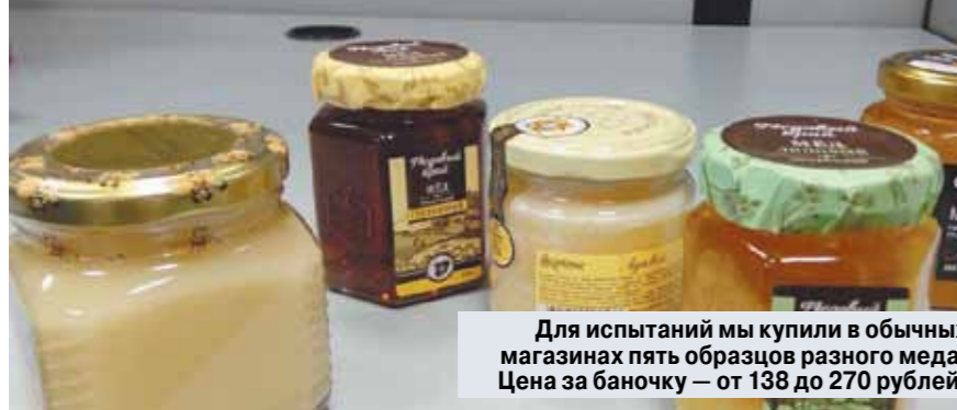
Для испытаний мы купили в обычных магазинах пять образцов разного меда. Цена за баночку — от 138 до 270 рублей.

«МК» провел экспертизу любимого лакомства Винни-Пуха