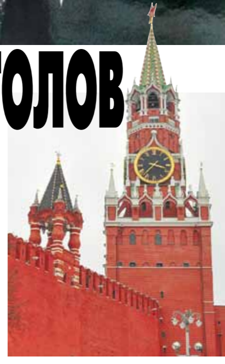
Читайте 4-ю стр.