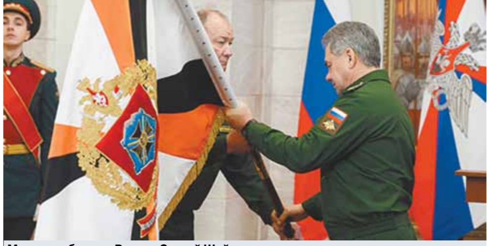
Министр обороны России Сергей Шойгу представил в четверг руководящему составу Южного военного округа нового командующего войсками округа. На эту должность назначен генерал-полковник Александр Дворников, который до этого возглавлял российскую группировку войск в Сирии.

В состав дивизии вошли мотострелковые, танковые, артиллерийский, зенитный ракетный полки, а также подразделения связи, разведки и материально-технического обеспечения.