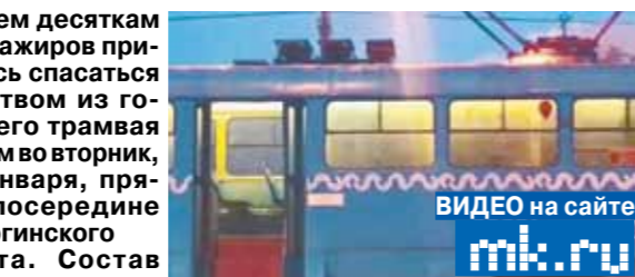
ВИДЕО на сайте mk.ru