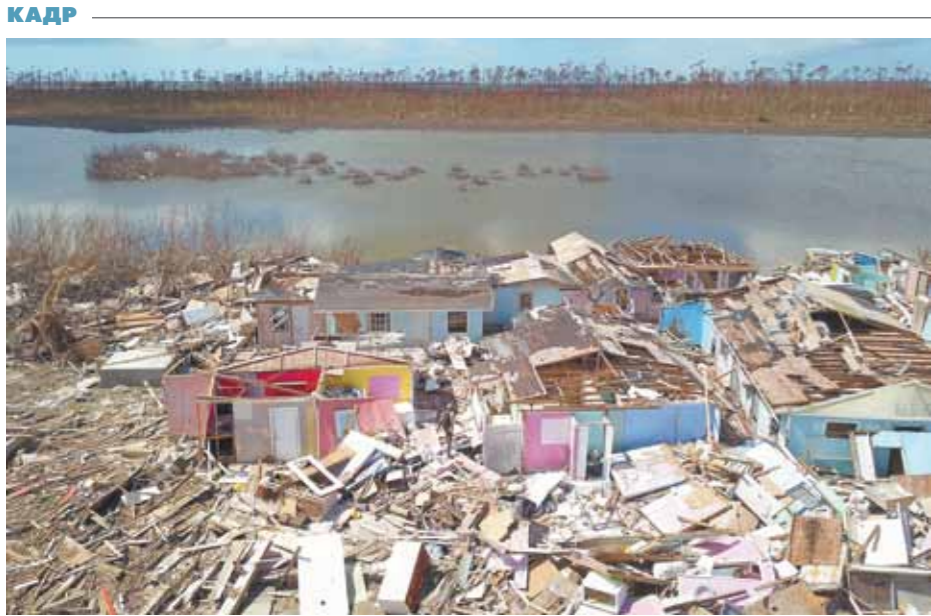
Ураган «Дорнани», пронесшийся над Багамскими островами, по предварительным подсчетам нанес ущерб в размере около 7 млрд долларов.