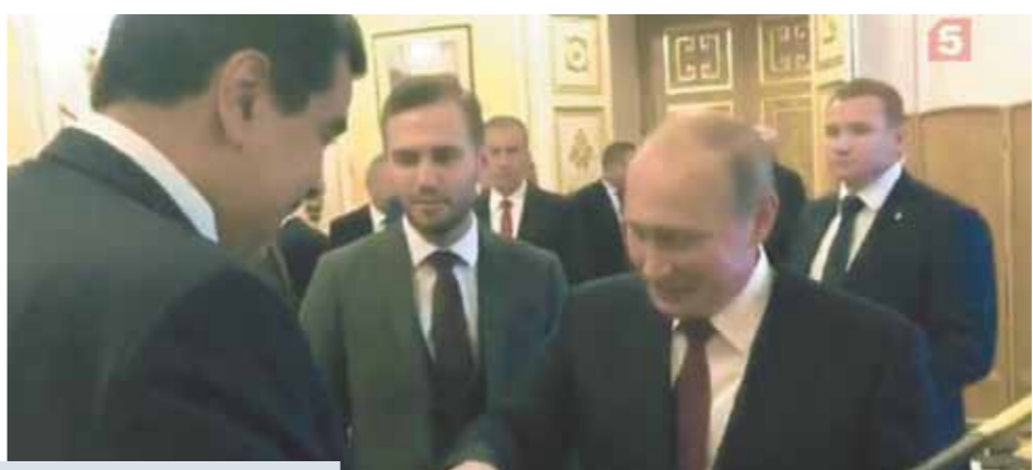
Путин отдал Мадуро монетку за подаренную саблю.

Кстати, на Генассамблее ООН, наверное, что-то важное решали. Но запомнится