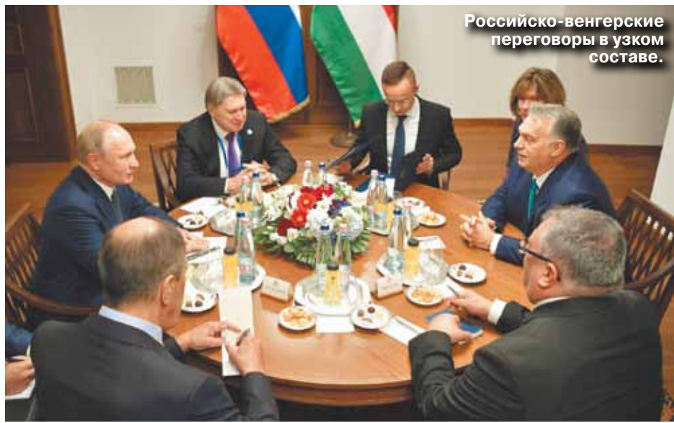
Российско-венгерские переговоры в узком составе.

Это тем более удивительно, что каких-то десять лет назад нынешний премьер не скрывал своих антироссийских настроений. Все изменилось после победы на выборах и личного знакомства Орбана с Владимиром Путиным. Между двумя лидерами, что называется, искра пробежала. Венгерский политик быстро осознал, что конфликт с Москвой для него непродуктивен, тогда как сотрудничество — особенно в энергетической сфере — может принести вполне ощутимые дивиденды. Договорившись о расширении поставок российского газа на экономически выгодных условиях, Орбан смог претворить в жизнь социальный проект «режичокентеш», направленный на снижение коммунальных платежей, и тем самым обеспечить собственное политическое долголетие. Теперь от него уже не услышишь про страну-агрессора, которую цивилизованная Европа должна поставить на место. Россия, по словам Орбана, это «великая и древняя империя», а Путин — успешный президент, которому евробюрократы зачем-то пририсовали рога и копыта. «Чтобы вас считали хорошим европейцем, вам придется изображать Путина в образе черта», — заявил премьер в недавнем интервью, отметив, что Венгрия не будет притрагиваться к общему