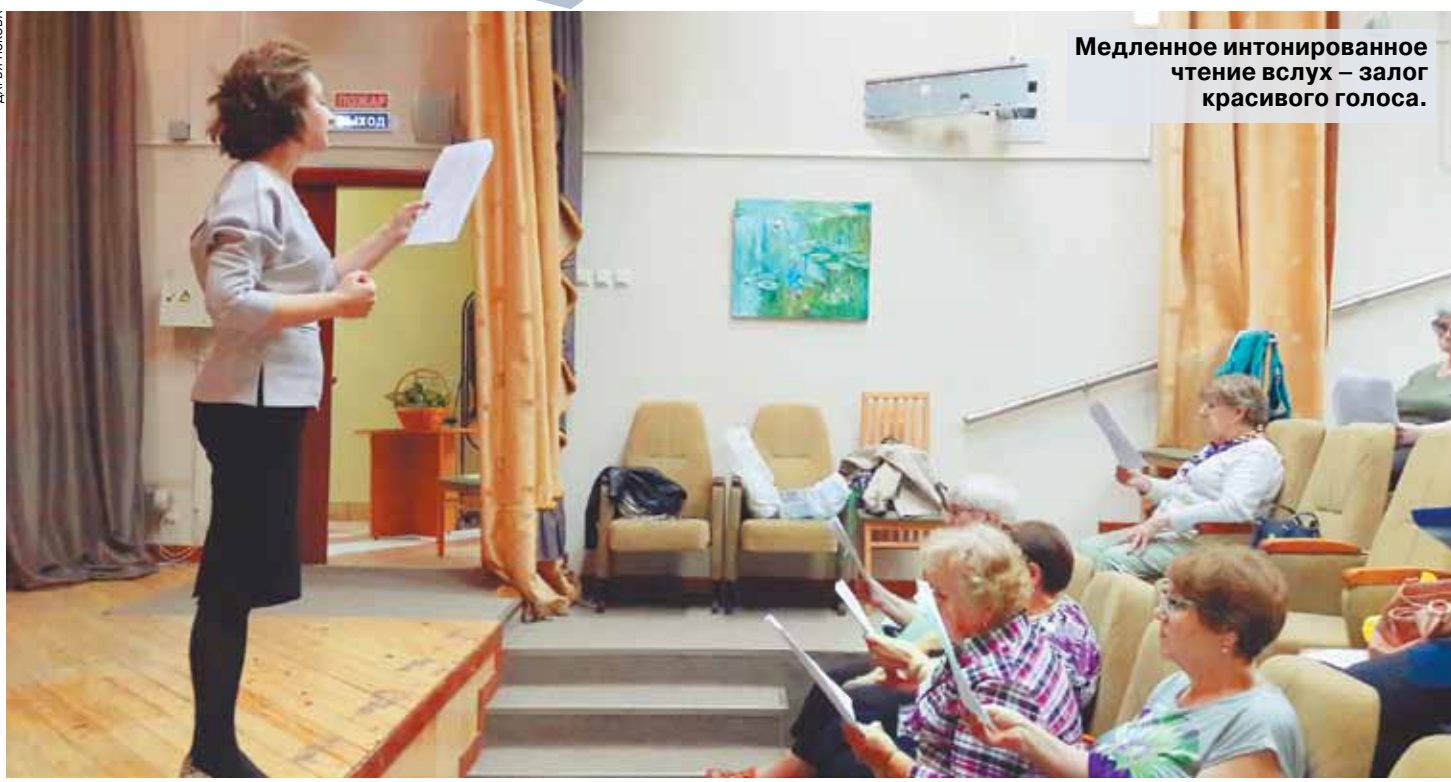
Медленное интонированное чтение вслух — залог красивого голоса.

Голоса у тебя в голове Безусловно, камера — хороший тренажер, чтобы научить людей говорить четко, ясно и выразительно, как настоящие дикторы.