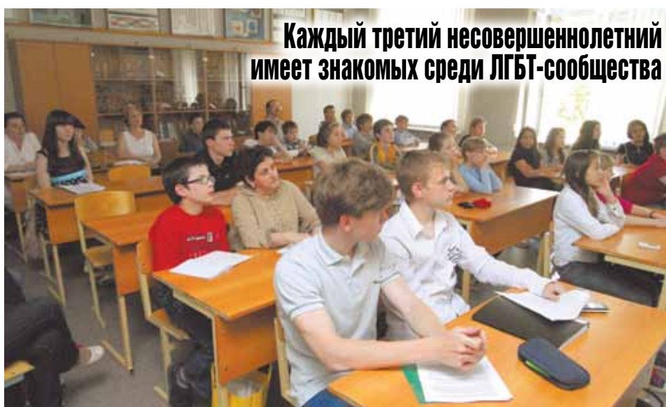
Каждый третий несовершеннолетний имеет знакомых среди ЛГБТ-сообщества