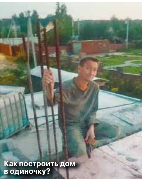
Как построить дом в одиночку?

ним не совладала. Сказали, что нужны родители покрепче, с большим ресурсом.