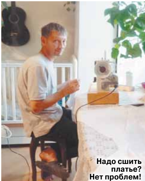
Надо шить платье? Нет проблем!