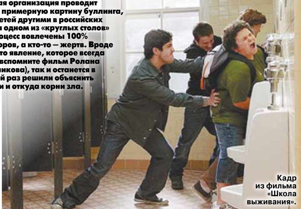
Кадр из фильма «Школа выживания».

Время от времени та или иная серьезная организация проводит исследования, чтобы составить хотя бы примерную картину буллинга, или, другими словами, травли одних детей другими в российских школах. Дошло до того, что недавно на одном из «круглых столов» некий эксперт заявил, что в данный процесс вовлечены 100% школьников: кто-то в качестве экзекutors, а кто-то — жертв. Вроде как нейтральных здесь нет. Неужели это явление, которое всегда существовало, даже во времена СССР (вспомните фильм Ролана Быкова «Чучело» по повести В.Железниковой), так и останется в разряде вечных? Эксперты в очередной раз решили объяснить родителям, что делать в такой ситуации и откуда корни зла.