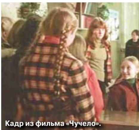
Кадр из фильма «Чучело».