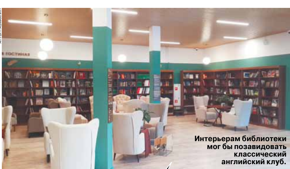
Интерьер библиотеки мог бы позавидовать классический английский клуб.

— Понимаете, мы с мужем приватизировали квартиру в долгие... — немолодая женщина в «шумной» гостиной что-то объясняет даме помоложе — видимо, юристу или риелтору. Идем дальше: две подруги, также вполне