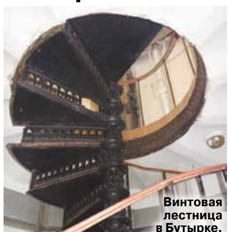
Винтовая лестница в Бутырке.

уголовник, современный эск обмелчал? — Скрыть в современном информационном пространстве почти ничего невозможно. Сбежать из СИЗО сложно, а станет еще сложнее. К силе и спецподготовке охраны добавляются технические новшества. Но главное здесь, конечно, люди — их выучка, внимание, профессионализм и самоотдача.