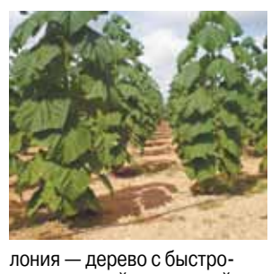
лония — дерево с быстро-развивающейся корневой

Закрытый полигон «Кучино», который расположен в подмосковной Балашихе, ждет преобразование. Министерство благоустройства Московской области совместно с министерством экологии и природопользования намерены высадить здесь 300 саженцев павлонии. Деревья привезли из питомников, расположенных под Казанью и Тулой. «Пав-