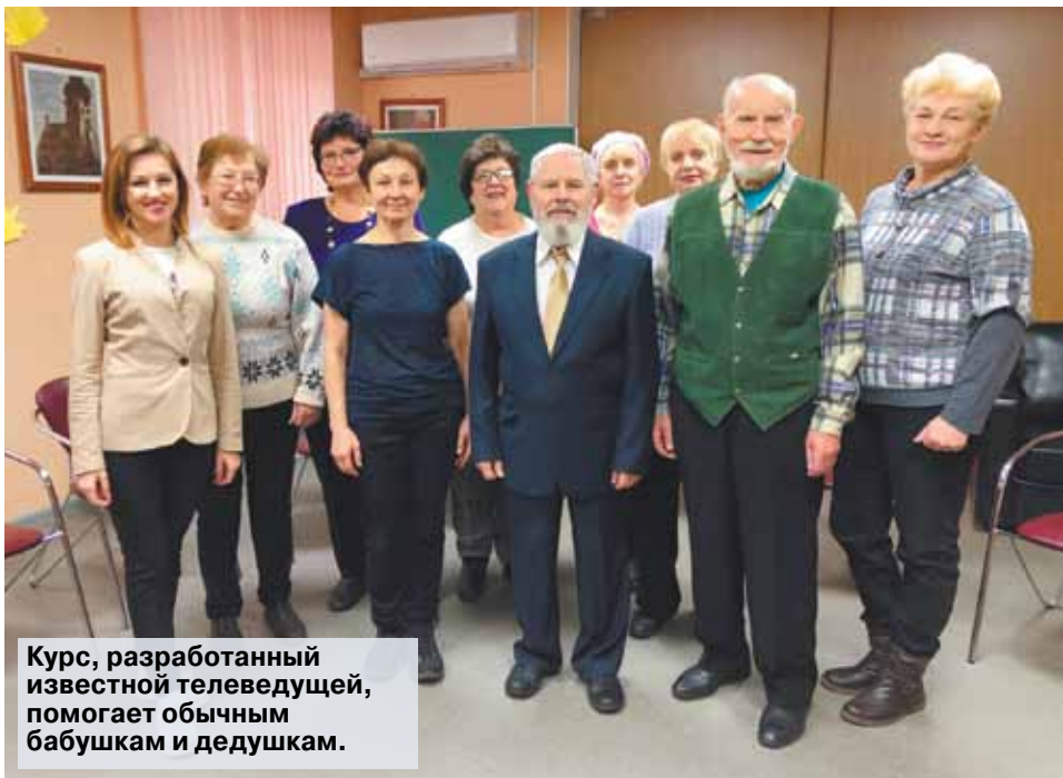
Курс, разработанный известной телеведущей, помогает обычным бабушкам и дедушкам.

Уловка — послушать собственный голос со стороны — используется также при обучении профессиональных дикторов. Едва ли не каждый человек, впервые услышав свой голос в записи — на диктофоне или на видеосъемке, — очень удивляется: мол, неужели это я так говорю? Объяснение простое: собственный голос человек воспринимает сразу по двум каналам — наружному (губы, наружное ухо,