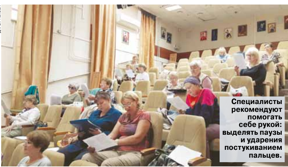
Специалисты рекомендуют выделять паузы и ударения постукиванием пальцев.

баранная перепонка, слуховые косточки, струны-резонаторы внутреннего уха) и костному (через кости черепа во внутреннее ухо). Голос со стороны — только по наружному, воздушному каналу. И почти всегда этот голос кажется нам менее красивым, чем тот, что звучит у нас в голове. Следовательно, работать надо именно с «внешним» голосом, а не с тем, который мы себе придумали, и для этого требуется на время заблокировать костный канал (для этого нужны наушники).