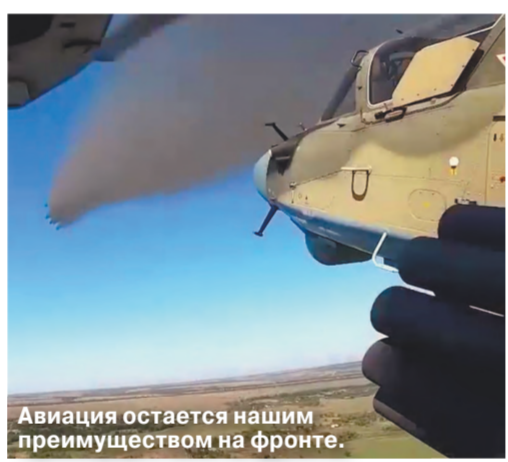
Авиация остается нашим преимуществом на фронте.