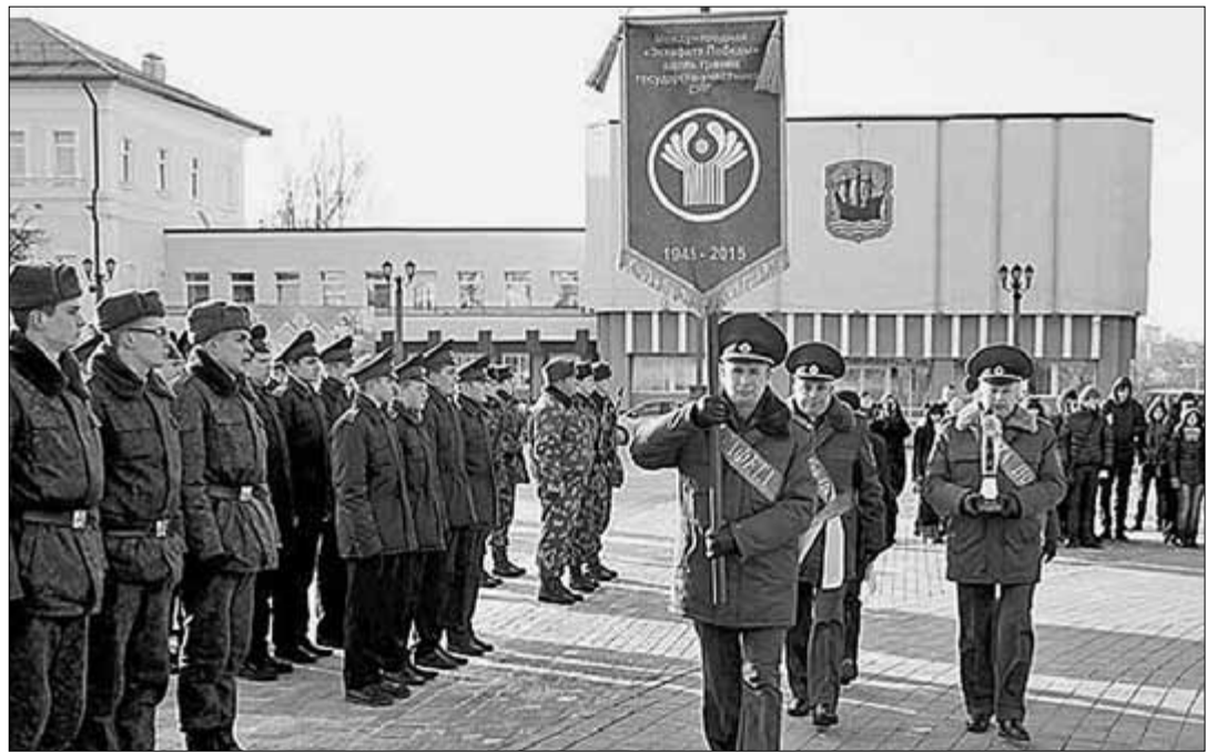
Международная эстафета «Победа-70» прибыла в белорусский город Полоцк, где на одной из площадей состоялся митинг. Проходящая вдоль границ СНГ эстафета приурочена к юбилею Победы в Великой Отечественной войне.