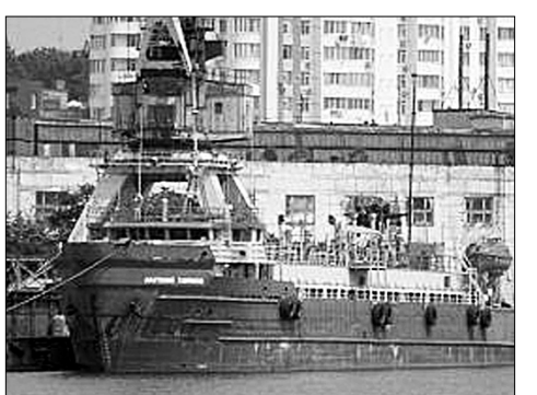
Амур Shipping 2515 LTD, зарегистрированная на Сейшельских островах, задокументировала два экипажа, работавших на судне в 2015 и 2016 годах, весьма крупную сумму — почти четыре миллиона рублей. Получить заработанные моряки смогут только после продажи корабля. Но, как известно, оценка и продажа судна на счёт погашения долга могут растянуться на очень длительный срок.