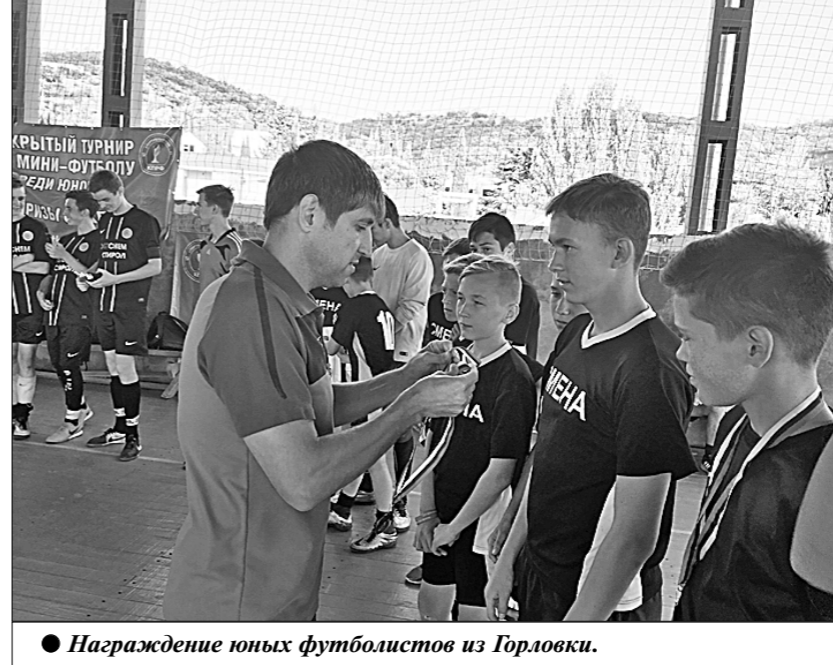
Награждение юных футболистов из Горловки.

победителями, обыграв в финале команду СК КПРФ (Крым). В турнире также приняли участие несколько местных детских коллективов, а самые юные футболисты