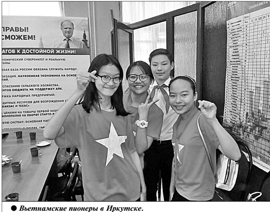
Вьетнамские пионеры в Иркутске.

Делегации вьетнамских комсомольцев и пионеров посетили Россию