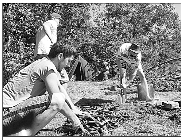
Разжечь костёр — целая наука.