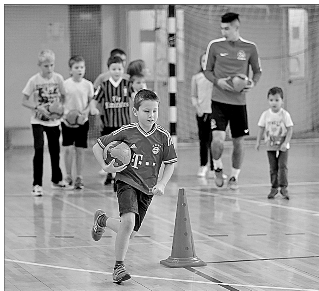
● Тренировка юных футболистов Академии СК КПРФ.

— Если суммировать сказанное тобой кратко, то мини-футбол стал базовым видом спорта для клуба на его начальной стадии развития. А как это развитие шло дальше?