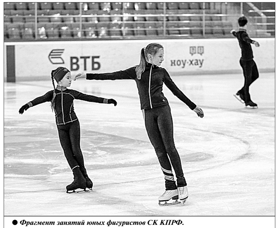
● Фрагмент занятий юных фигуристов СК КПРФ.

КПРФ начала и продолжает развивать крупный проект, целью которого является не только привлечение широкого внимания к уникальному, если сравнить с другими парламентскими партиями, направлению работы с молодёжью, но и реальное увеличение партийных рядов за счёт того самого молодого поколения, представители которого активно участвуют в упомянутом проекте либо живо им интересуются.