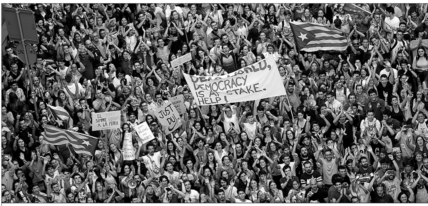
● Одной из главных информационных тем уходящего года стали события в Каталонии, где 1 октября по инициативе властей испанской автономии состоялся референдум о независимости, победу на котором одержали сторонники суверенитета. Однако Мадрид, объявивший плебисцит незаконным и нарушающим Конституцию королевства, не признал его итоги и в ответ на принятие каталонским руководством декларации о независимости ввёл в области прямое правление, распустив местный парламент, отправив в отставку правительство автономии, арестовав бывших министров и назначив досрочные выборы. «Страсти по референдуму» (так окрестили происходящее мировые СМИ) сопровождалась многотысячными демонстрациями приверженцев отделения Каталонии от Испании.