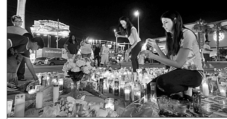
● Митингующие 365 дней подтверждали печальное лидерство США среди ведущих мировых держав по числу смертей от огнестрельного оружия на душу населения. Расстрел церковных прихожан, учеников школ, посетителей кинотеатров и ночных клубов — лишь краткий перечень трагедий 2017 года, самой страшной из которых являлся бойня в Лас-Вегасе, крупнейшей в истории США массовой убитостью, когда 64-летний пенсионер-миллионер Шивен Пэддок открыл пальбу из окна своего гостиничного номера, убив 58 посетителей казино-фешевала.