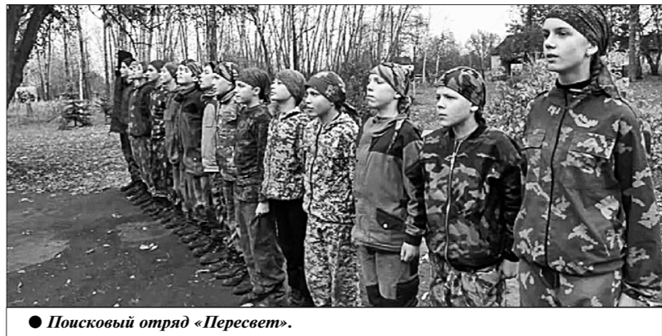
● Поисковый отряд «Пересвет».

воспитание детей в школе. Там якобы надо оказывать исключительно «образовательные услуги», и, желательно, за дополнительную плату. И ничего другого учителя интересовало не должно.