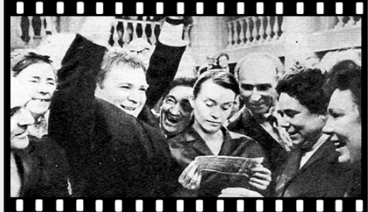
● Кадры из фильма «Зигзаг удачи».

Звание самого главного новогоднего фильма Советского Союза долгое время принадлежало «Карнавальная ночь» Эльдара Рязанова, пока его не потеснила другая картина этого же режиссёра — «Ирония судьбы». Но между этими двумя лентами мастер снял ещё одну, не менее замечательную, новогоднюю комедию «Зигзаг удачи», которая почему-то не стала столь популярной. И тем не менее история незадачливого фотографа Орешкина, выигравшего 10 тысяч по облигации государственного займа, заслуживает зрительского внимания.