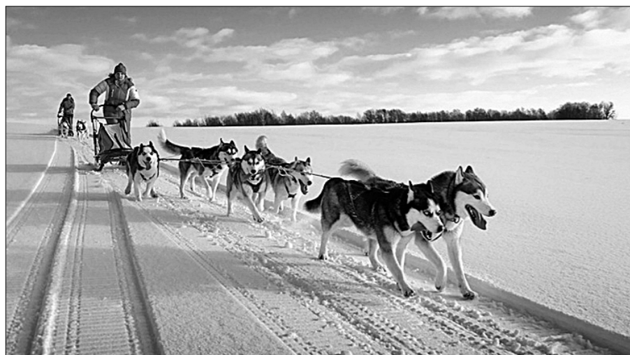
Собачья упряжка из некогда насущного средства передвижения превратилась в оригинальное зимнее развлечение. Сегодня катание на собачьих упряжках — один из самых популярных видов активного зимнего отдыха в странах Скандинавии и в Северной Канаде, на Аляске, в Сибири, в Прибалтике, да и не только, сообщает интернет-портал skartoy.ru.