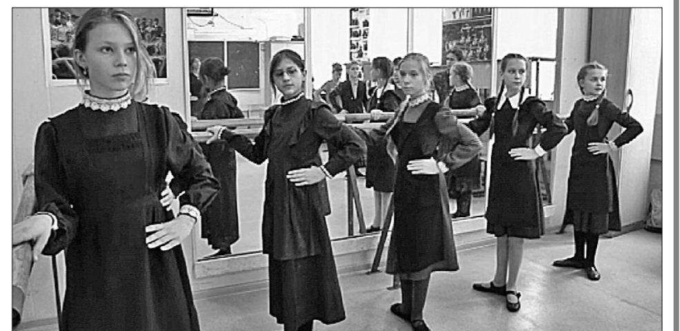
● Занятия хореографией.

Действительно, в 1990-х годах либеральные «реформаторы» фактически запретили