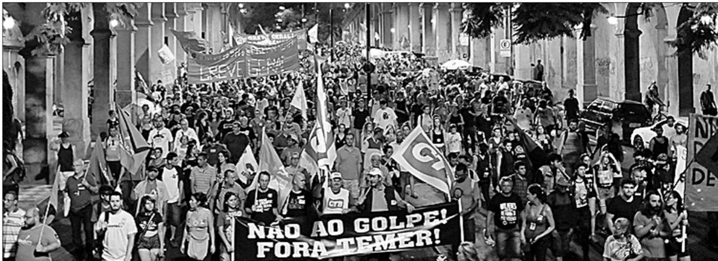
● Дестабилизация социально-экономической ситуации в Латинской Америке, вызванная приходом к власти в ряде государств правых политиков, породила масштабное недовольство жителей региона. Заметную протестную активность проявили бразильцы, восставшие против пенсионной и трудовой реформ президента Мишела Темера. Неoliberalные преобразования главы государства, которые приведут к существенному повышению возраста выхода на заслуженный отдых, нападкам работников негосударственных предприятий в плане увольнения сотрудников и изменения условий их контрактов, фактически лишат полномочий профсоюзы и трудовые инспекции, пробудят народный гнев. Начиная с весны в Бразилии не прекращались многотысячные манифестации с требованием отставки Темера, оказавшегося в центре очередного коррупционного скандала и ушедшего от ответственности благодаря своим сторонникам в парламенте.