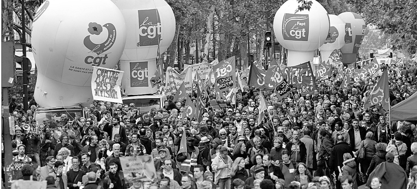
● Обнищание населения, увеличение числа бездомных, инфляция, рост цен и безработица, антинародные реформы, подчёркивающие экономическую несостоятельность властей, привели к очередной волне социальных протестов в Европе, особенно во Франции, где профсоюз и левые политические силы продолжили борьбу за права наёмных работников, устраивая забастовки и многотысячные демонстрации против «усовершенствований» Трудового кодекса. Однако многомесячное противостояние с новым президентом страны Эммануэлем Макроном, выразителем интересов крупного международного капитала, окончательно утвердившим реформу, начатую его предшественником Франсуа Олландом, завершилось поражением трудящихся: 28 ноября документ принял Национальная ассамблея.