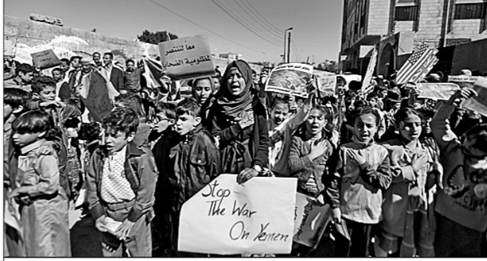
● Год Пешуха оказался тяжелейшим испытанием для жителей Йемена: в наиболее густонаселённом государстве Аравийского полуострова развернулась крупнейшая гуманитарная катастрофа на планете. Трёхлетняя гражданская война, усугублённая интервенцией военной коалиции во главе с Саудовской Аравией, в ноябре блокировавшей все наземные, воздушные и морские порты страны, мощнейшая вспышка эпидемии холеры, нехватка лекарств, воды и продуктов обернулись голодом и гибелью тысяч людей, в том числе детей.