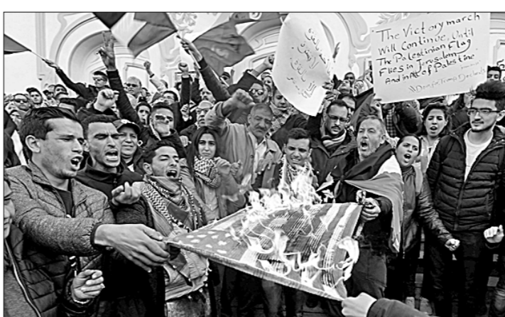
● Скандальное заявление главы Белого дома Дональда Трампа об официальном признании Иерусалима столицей Израиля и переносе туда посольства США из Тель-Авива спровоцировало широкое возмущение во всём мире. Крайнее негодование это решение вызвало в государствах с мусульманским населением, где в ходе массовых манифестаций протестовали скандировали антиамериканские и антиизраильские лозунги, жгли флаги обеих стран и чучела их президентов, призывая последователей ислама объединиться и начать священную войну против США и Израиля.