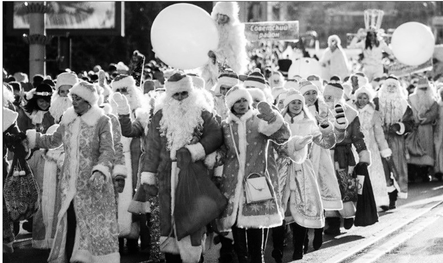
● Театрализованное шествие Дедов Морозов и Снегурочек под названием «Волшебное созвездие Нового года» проходит по центральным улицам городов республики, вызывая большую радость и у взрослых, и у детворы.