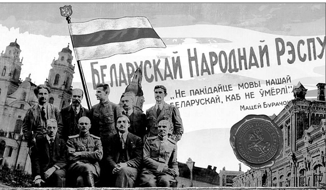
● Плакат. 1918 год.

Направляя и расставляя кадры бэнэровских «белорусизаторов» в белорусской культуре и науке В.М. Игнатовский — народный комиссар просвещения БССР, член ЦК КПБ и в то же время сам активный «белорусизатор». В его работах, которые были изданы в 1920-е годы в Советской Белоруссии, под прикрытием вульгаризированного понимания марксистской методологии изложены все основные химеры «белорусизаторов»: противопоставление белорусов и русских, отрицание единства древнерусской народности, пропаганда ан-