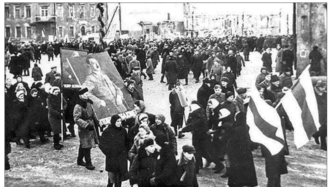
● Нацистская демонстрация на площади Свободы в Минске. 1943 год.