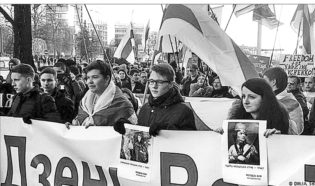
Акция «День Воли» в Минске 25 марта 2016 года.

Идеологически этой частью государственной деятельности занимались псевдодемократы в лице «Белорусского народного фронта» (БНФ). В частности, в программной статье гаваря БНФ Зенона Позняка «О русском империализме и его опасности» была сформулирована антирусско-белорусская и антисоветская направленность так называемого национального возрождения в Белоруссии. В этой статье ненависть и клевета на русский народ и советскую действительность достигли стадии маниакальности. «Россия — это имперское общество с неограниченным сервилитным сознанием». «Это лоскутный народ без очерченной национальной территории». «Беларусь вылетит из СНГ». «Наш путь — это путь балтийских стран, путь возвращения в европейскую цивилизацию». «Будут запрещены все коммунистические организации на Беларуси». «Наша нация глубоко и тяжело больна».