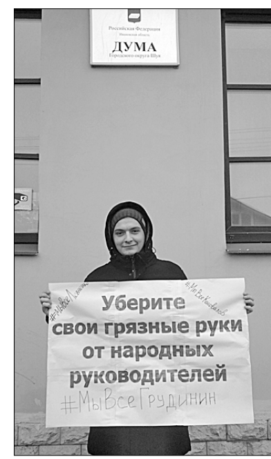
Шуйского горкома КПРФ. Ивановская область.

чинна средних лет. Подойдя к молодежи, он засыпал ребят многочисленными вопросами, касающимися мнимых зарубежных счетов Грудниина. На все прозвучавшие вопросы молодежь спокойным тоном дала разъяснения. Судя по всему, на этом аргументы оппонента закончились, и он попытался задвинуть комсомольцев своим авторитетом, представившись депутатом Госдумы и помощником Жириновского, но и это не вызвало у молодежи ни капли смущения. Затем внезапно появившаяся женщина начала упрекать ребят в том, что ими проводится фотофиксация всего происходящего. И начала изображать, что тоже про-