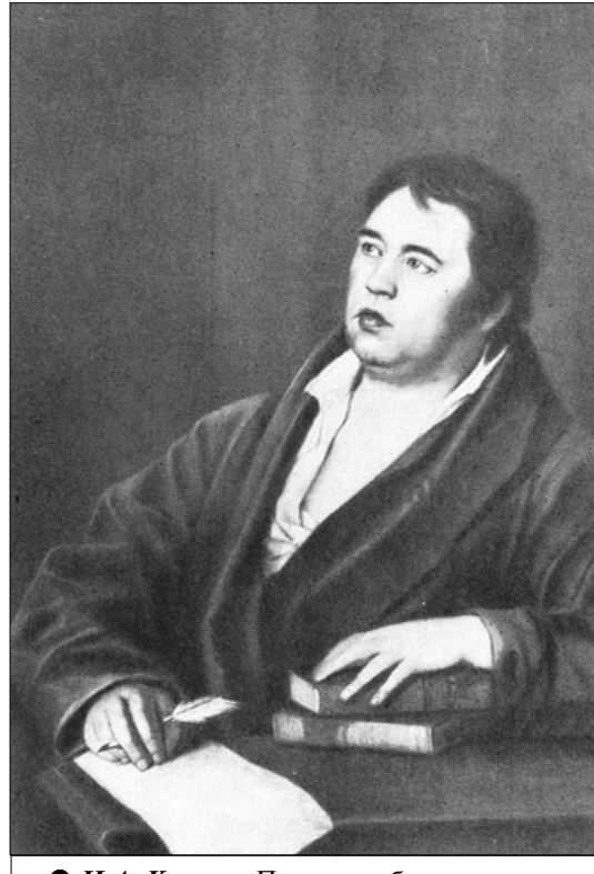
● И.А. Крылов. Портрет работы художника Р. Волкова. 1812.

ГОРЬКОЕ ИЗВЕСТИЕ об оставлении русскими войсками Москвы, о пожарах, уничтоживших почти весь древний город, породило у всех взрыв возмущения действиями фельдмаршала Кутузова, допустившего такое. Кто-то даже обвинял его в измене. Но однажды в гостиную Оленина буквально ворвался Александр Иванович Тургенев, который был вхож в высшие государственные сферы и всегда знал последние новости. Волнуясь, он поведал о посылке Наполеоном бывшего французского посла в Российской империи графа Лористона в ставку Кутузова при подмосковном селе Тарутине с