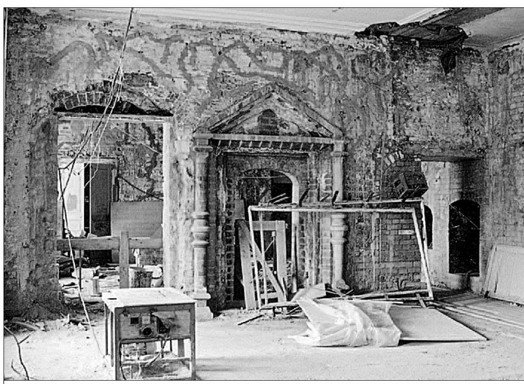
● Из таких руин был восстановлен Международный Центр Рерихов.

В 1995 году МЦР, согласно особым условиям договора долгосрочной аренды и в соответствии с плановым заданием правительства Москвы, обязался восстановить утраченные в 1920-х годах постройки усадьбы Лопухиных — часть северного флигеля и каретный корпус. Для этого после разработки соответствующей проектной документации, прошедшей все необходимые согласования правительства Москвы и министерства культуры РФ, а также получения разрешений и ордеров на производство работ музей осуществил первый этап работ, связанный с подготовкой фундамента: построил подземную ограждающую конструкцию — «стену в грунте» (из монолитного железобетона глубиной до 14 метров), обязательную в условиях плотной застройки исторического центра Москвы. «Стена в грунте» была сдана по акту Мосгоргеостресту, который подтвердил, что положение подземной части полностью соответствует согласованному строительству. В настоящее время эта конструкция поставлена на кадастровый учёт как объект незавершённого строительства.