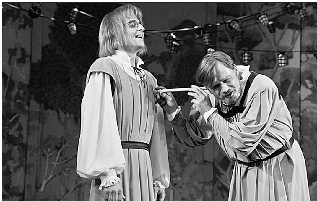
«Не хочу, чтобы ты выходила замуж за принца».