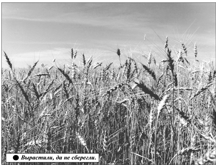
● Вырастали, да не сберегли.