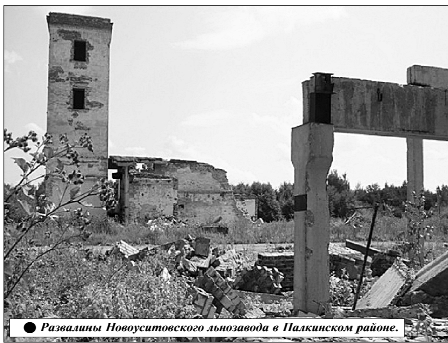
● Развалины Новоустовского льнозавода в Палкинском районе.