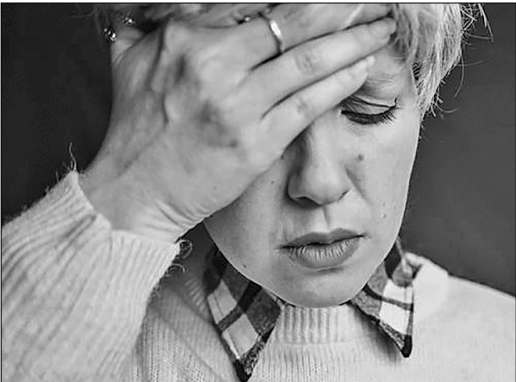
● Большинство немцев — в стрессе от коронавируса и его последствий.