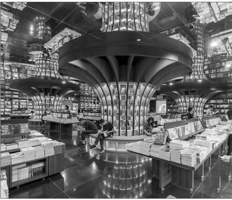
(«Жэньминь жибао» онлайн).

КНИЖНЫЙ магазин «Чжуншугэ» в шанхайском районе Сюйхуэй стал культурным символом китайского мегаполиса после его открытия в 2013 году. Привлекая большое внимание туристов и местных жителей, он считается самым красивым книжным магазином в Китайской Народной Республике. И, разумеется, здесь, как говорится, есть всё: и классика, и последние литературные новинки. И вот магазин снова начал, как и до эпидемии коронавируса, заполняться людьми, среди которых особенно много молодёжи.