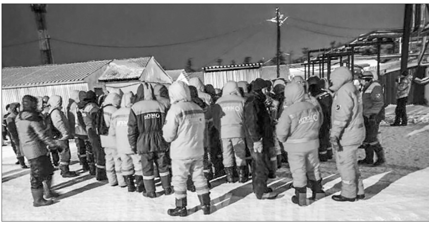
В ходе проверки будет дана оценка соблюдению трудового законодательства, в том числе в части своевременной и в полном объёме выплаты заработной платы, обеспечения безопасных условий труда», — говорится в официальном сообщении прокуратуры Сахалинской области.

Прокуратура Ногликского района поручено дать оценку соблюдения трудовых прав работников ООО «Нефтегазкомплектмонтаж», зарегистрированного в городе Солнечногорске Московской области. Обособ-