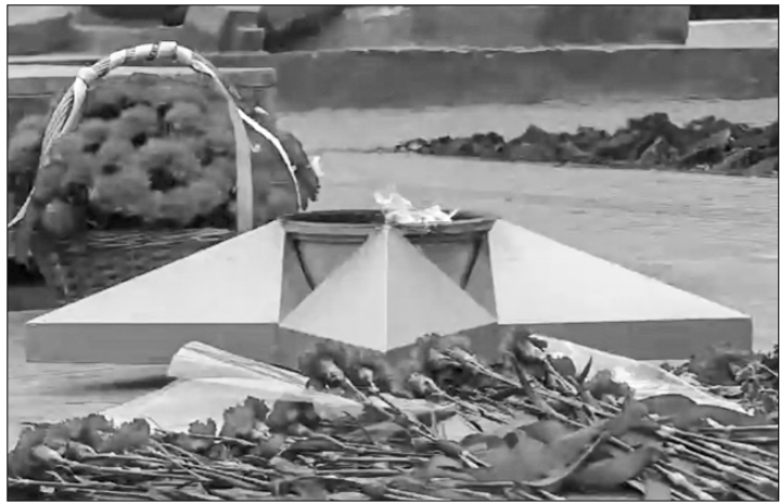
3 декабря жители города Мелитополя Запорожской области торжественно отметили День Неизвестного солдата. Горожане, среди которых были и представители учащейся молодёжи, пришли к Вечному огню с Красными Знамёнами Победы. Они почтили память советских воинов, павших без вести в битвах с гитлеровскими захватчиками, и российских солдат, погибших в боях с украинскими буржуазными националистами в Запорожской области.