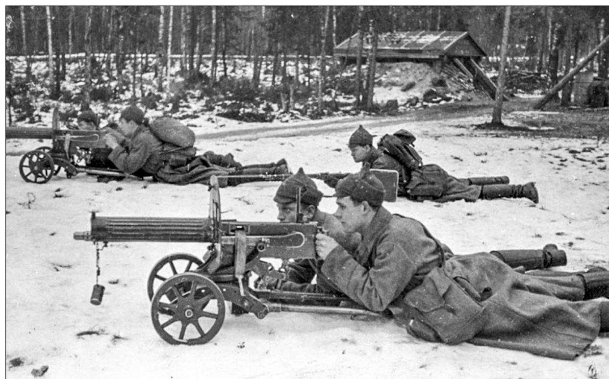
Расчёты пулемётов «максим» РККА.