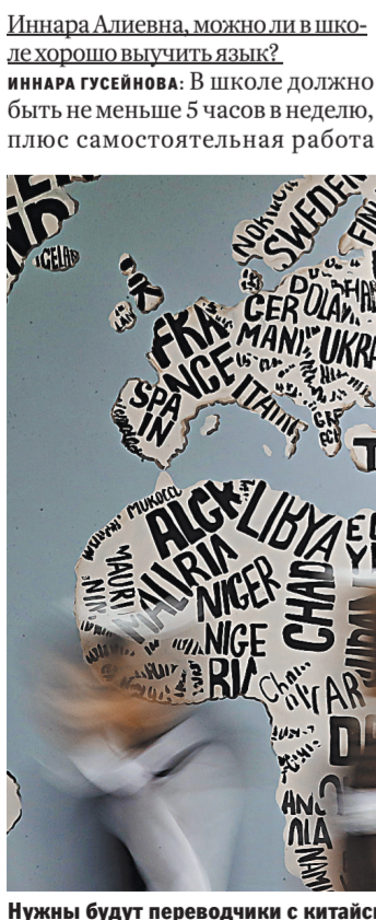
Нужны будут переводчики с китайского, языков стран СНГ, английского, хинди, португальского, всех языков ЕС.

дома. Допустим, учитель на уроке рассказывает правило, а дома можно взять одну страницу текста на иностранном языке, выпи- сать 10 выражений и попытаться составить с ними небольшой рас- сказ. Уверена, что результат будет уже через три месяца. Слож- нее всего дается изучение перво- го иностранного языка. Родной язык мы учим интуитивно, а тут речь идет о формировании вто- ричной языковой личности. Мы изучаем иностранный язык осознан- но, и это требует неких интел- лектуальных усилий. Сколько учить, чтобы хорошо знать? Язы- ком надо заниматься всю жизнь. И мы сегодня говорим о необхо- димости непрерывного лингви- стического образования.