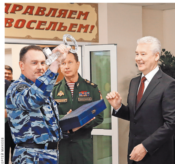
СИМВОЛИЧЕСКИЙ КЛЮЧ ОТ НОВОЙ БАЗЫ РОСГВАРДИИ ЕЕ СОТРУДНИКАМ ПЕРЕДАЛ МЭР СТОЛИЦЫ СЕРГЕЙ СОБЯНИН.

На территории комплекса работает и Центр кинологической службы. Вольеры рассчитаны на 70 служебных собак. Есть и помещения для карантина. Для выгула питомцев выделена отдельная площадка, а для тренировок построен целый городок с препятствиями. Четвероногие воспитанники учатся искать взрывоопасные вещества в метро и общественных местах столицы.