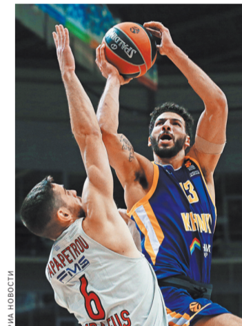
«Химки» в Евролиге побеждают чаще, чем в Единой лиге. Вот и вчера они уступили УНИКСу.

Накануне состоялся два матча, результаты которых важны в плане распределения путевок в плей-офф для команд, находящихся в нижней половине таблицы. Только восемь сильнейших клубов по итогам «регуляри» продолжат борьбу в турнире с выбыванием.