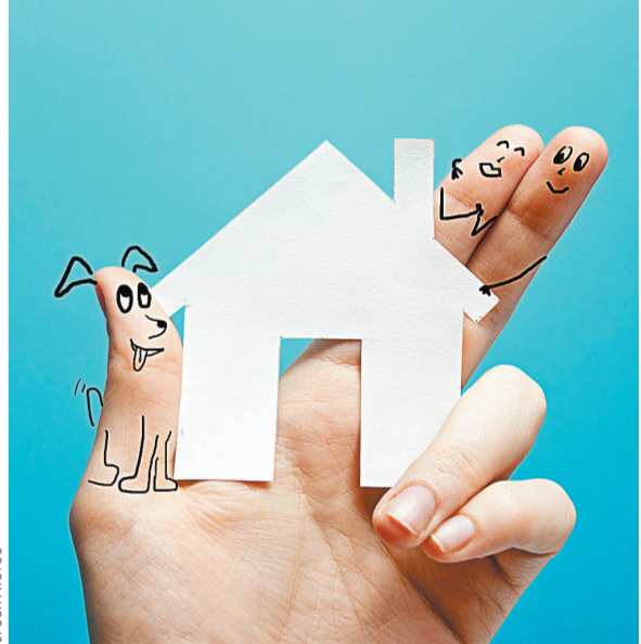
Все больше людей целенаправленно копят деньги на квартиру, чтобы на пенсии получать гарантированный доход от сдачи ее в аренду.