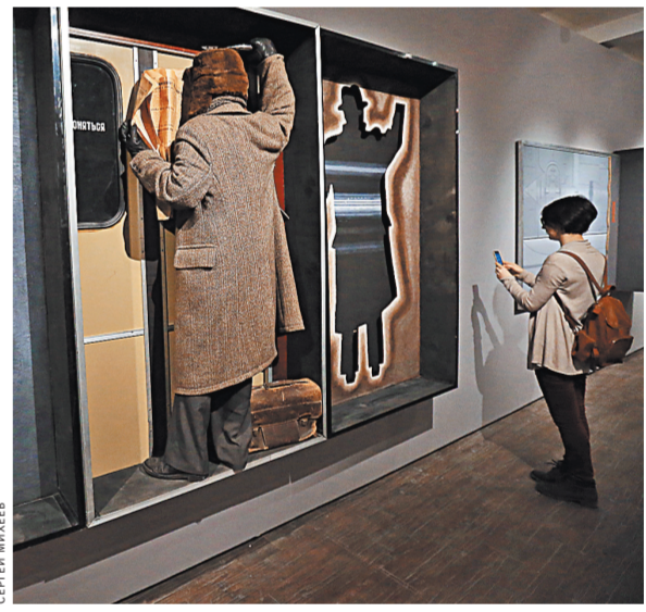
Монументальные триптихи Янкилевского исследователи сравнивают со створками средневековых алтарей.

Свою знаменитую «Дверь» он посвятил памяти родителей своих родителей