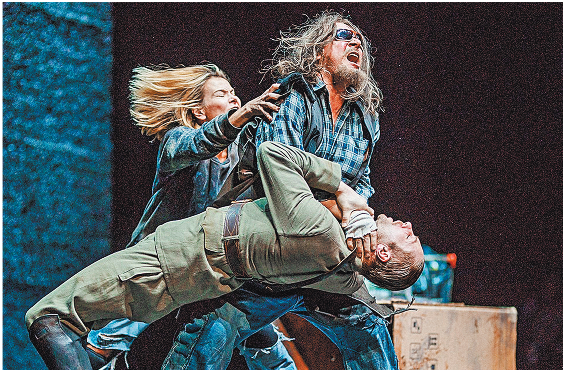
ПРЕСТАВЛЕНИЕ РЕЖИССЕРА АНДРЕЯ КОНЧАЛОВСКОГО