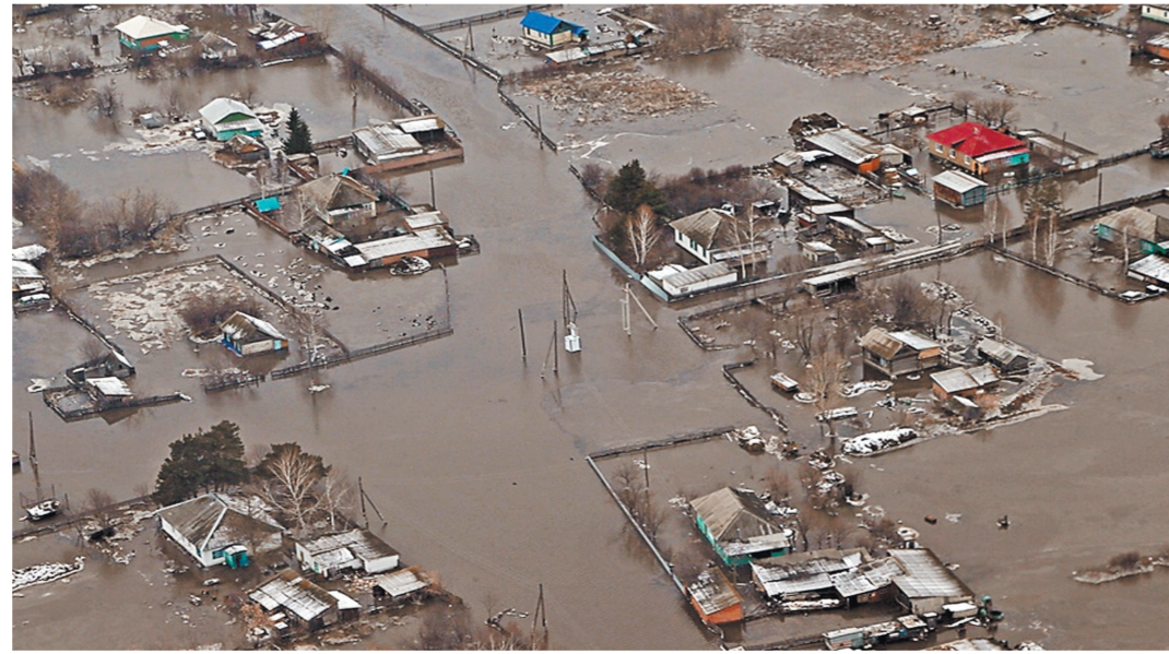
ПРЕСС-СЛУЖБА АДМИНИСТРАЦИИ АЛТАЙСКОГО КРАЯ

Вечеру 26 марта талые воды затопили уже 970 жилых домов и более двух тысяч приусадебных участков в 37 селах и в Белокурихе. Из зоны бедствия эвакуировали почти 800 человек. В го-