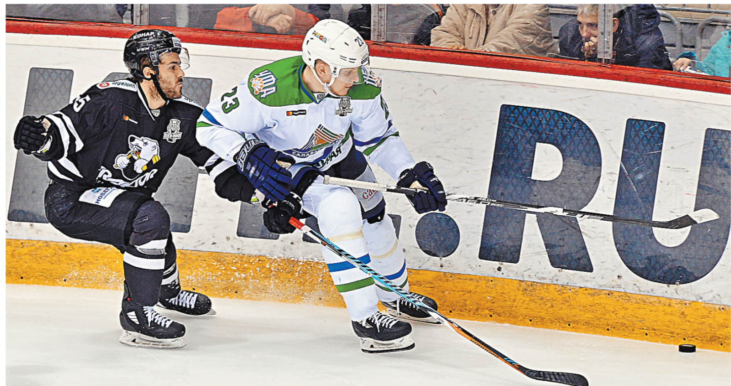
Хоккеисты «Трактора» в шестом матче серии буквально «проехали» по сопернику.

Напомним, что год назад на Совете директоров было принято решение, что в сезоне-2017/2018 не выступят «Медвешчак» (Загреб), который не подал соответствующие документы на участие в турнире, и новокузнецкий «Металлург», который замкнул рейтинг клубов по всем параметрам. Соответствующий рейтинг является комплексной оценкой клубов по совокупному набору объективных критериев.