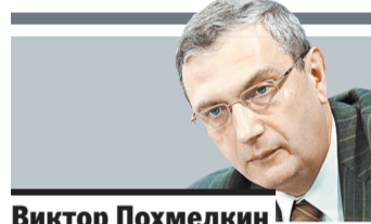
Виктор Похмелькин председатель движения автомобилистов России

НИКАКОГО нарушения прав автомобилистов в установке средств автоматической фиксации в зоне действия временных дорожных знаков я не вижу («РГ», 1 и 9 полосы). Законодательству это не противоречит.