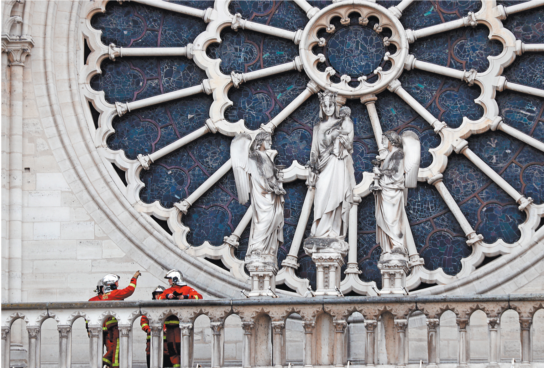
Витражи, чудом уцелевшие при пожаре, еще предстоит обследовать специалистам.

ЕЛИЗАВЕТА ЛИХАЧЕВА: Судя по всему, он оказался меньше, чем мы предполагали той ночью, когда кадры горящего собора создавали полное ощущение, что это снимки из ада. Казалось, что собор горит внутри. К счастью, он конструктивно устоял. Да, сгорели крыша, шпиль и паннакидо, которое, вероятно, восстановлению не подлежит. Все эти элементы были творением французского архитектора и реставратора XIX века Эжена Эммануэля Виолле-ле-Дюка. Консилуму предстоит решить, в каком виде реконструировать шпиль, потому что на гравюрах XV века он тоже присутствует. Как я понимаю, уцелели витражи, и сейчас будет принято срочное решение об их фиксации и демонтаже. Есть опасение, что свинцовая рама была повреждена, и витражи могут рассыпаться. Скорее всего, «розы» соберут на полу собора в новую раму и вставят обратно. Пострадал орган — но не столько от высоких температур, сколько от воды, которой его залили. Очень хотелось бы узнать судьбу деревянного хора. Это уникальный позднесредневековый хор со сценами Жития и Страстей Христовых, и там, на минутку, есть портретные изображения всех французских королей. В общем, специалисты