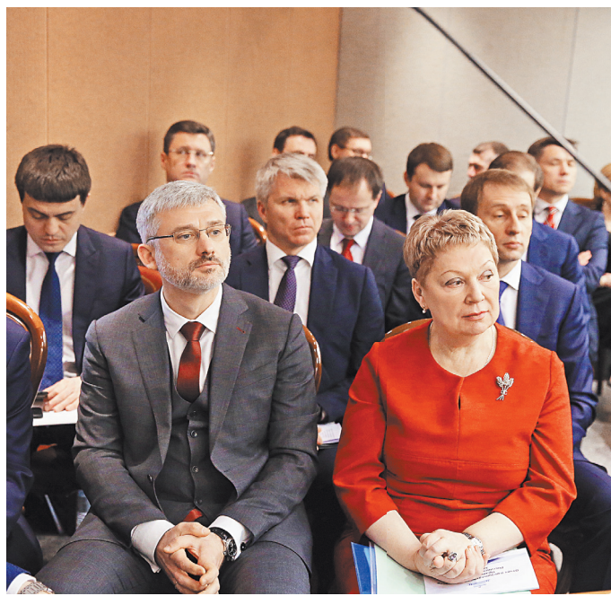
Представляя Госдуме ежегодные отчеты о результатах своей деятельности — конституционная обязанность правительства России. Традиционно при выступлении главы правительства в зале присутствуют члены кабинета министров.