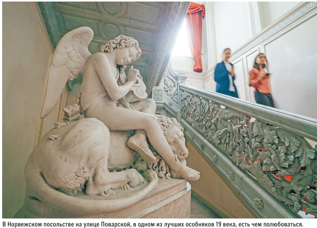
В Норвежском посольстве на улице Поварской, в одном из лучших особняков 19 века, есть чем полюбоваться.