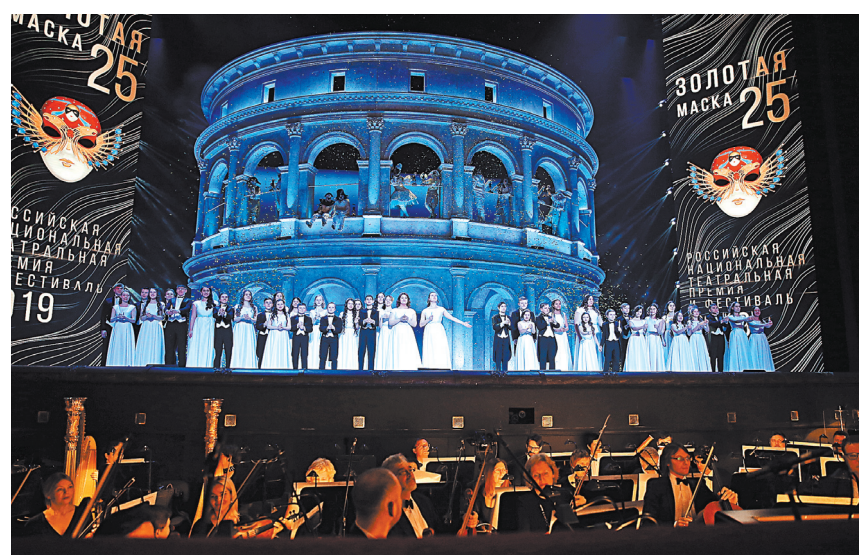
Коридор свершившихся надежд и обманутых ожиданий: «Золотая маска» отмечала юбилей.