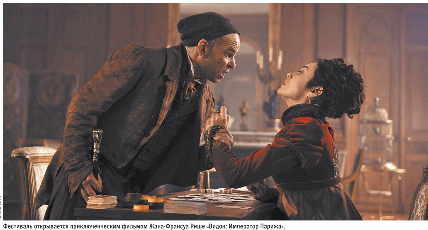
Фестиваль открывается приключенческим фильмом Жана-Франсуа Рише «Видок: Император Парижа».

цеприятная правда о событиях тридцатилетней давности, когда советские войска были выведены из Афганистана, видимо, помешал руководству ММКФ продемонстрировать, что кинематографическое братство существует не на словах, а на деле. Так что завершит фестиваль документальный фильм «Встреча с Горбачевым»; режиссеры Вернер Херцог и Андре Сингер сняли его в 2018 году. ●