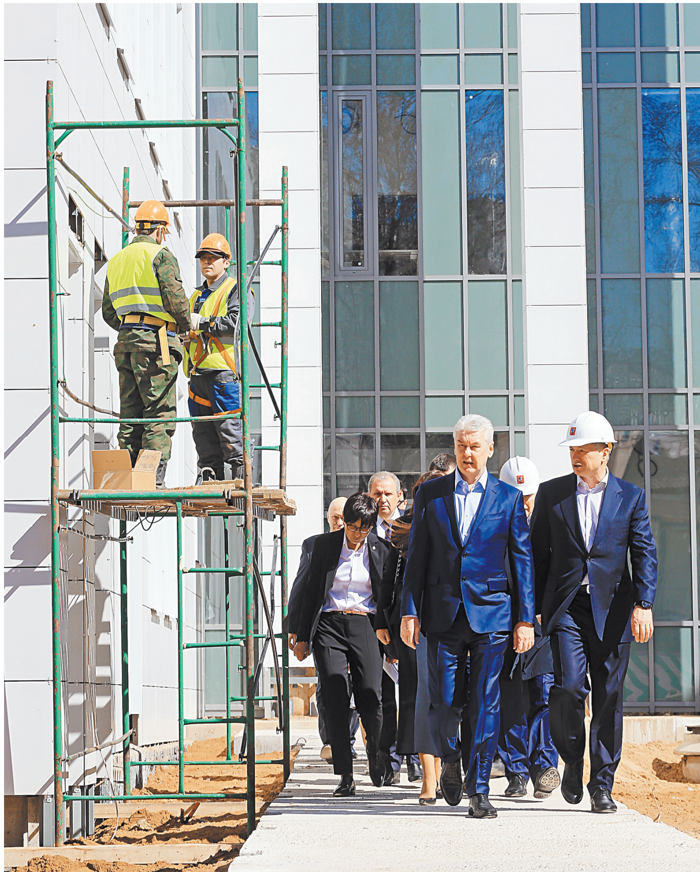
Городские власти обещают, что и в ходе ремонта поликлиники будут продолжать прием пациентов.

— Фото смотрите на сайте rg.ru/sujet/1560