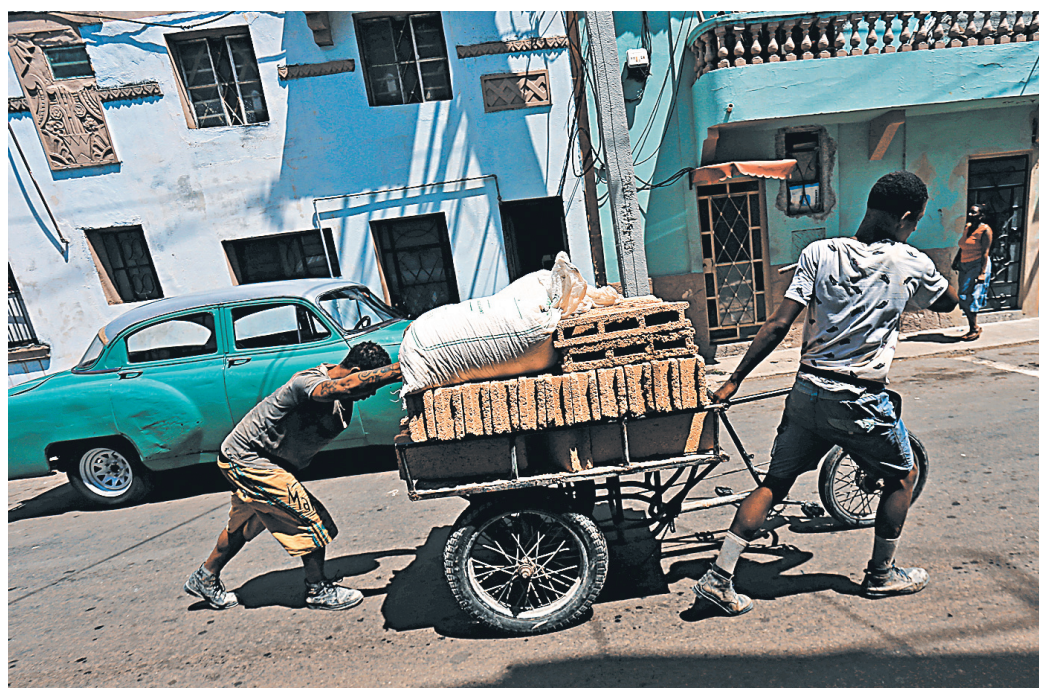
Новые санкции Белого дома ударят и по рядовым кубинцам, и по европейскому бизнесу.

собственность, конфискованную после революции на Острове свободы 1959 года.