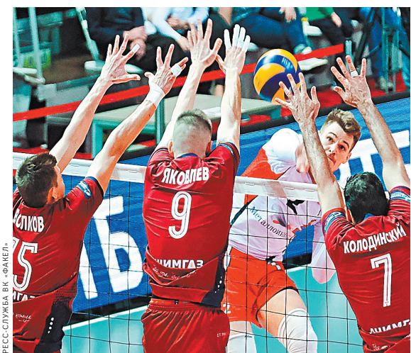
Волейболисты новоуренгойского «Факела» (на переднем плане) дожали белгородцев на тай-брейке третьего матча.

Тем временем в женской Суперлиге определился первый участник «золотой» серии. Им стал дебютант элиты «Локомотив» (Калининград), повторно обыгравший «Динамо-Казань» — 3:0 на берегах Волги. «Железнодорожники» уже запустили для себя пропуск в европейскую Лигу чемпионов-2019/20. В битве столичного «Динамо» и «Уралочки-НТМК» предстоит третий матч, он пройдет 20 апреля в Москве. ●