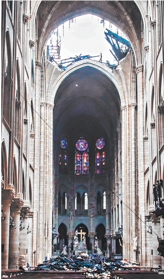
Теперь на месте крыши знаменитого собора зияет огромная дыра.

чит, ответственность за него несет муниципалитет. Недаром святости, эвакуированные при пожаре, отнесли в Отель-де-Виль — парижскую мэрию. После Великой французской революции Нотр-Дам просто стоял и медленно разрушался. Француз — ребята прижимистые, никто тогда не хотел тратить деньги на его реставрацию, велись разговоры о том, что его вообще пора разобрать и построить на этом месте что-то новое, красивое, с колоннами.