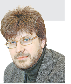
Федор Лукьянов , профессор-исследователь НИУ «Высшая школа экономики»