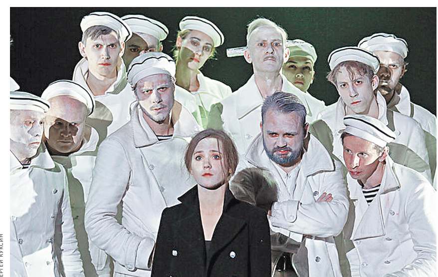
Лучший драматический спектакль — «Оптимистическая трагедия» Александринского театра.

КИНО Что нельзя пропустить на Московском фестивале