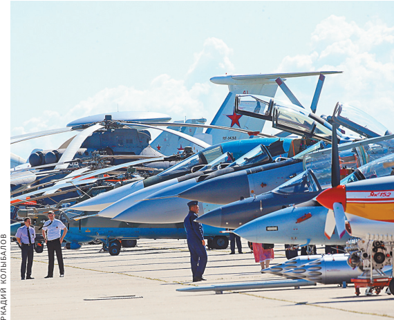
Российская экспозиция на салоне МАКС-2019 значительно расширится, многое будет показано впервые.

Салон пройдет в Жуковском с 27 августа до 1 сентября. И это уже решенный факт. А ведь недавно в СМИ даже вбрасывалась информация о переносе авиасалона в Кубинку. Но МАКС-2019 пройдет там, где проходит уже почти тридцать лет. ●