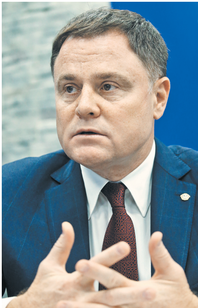
Владимир Груздев: Тарифы на моральный вред установить невозможно, но можно разработать ориентиры для судов.

Далее по каждому направлению разработать коэффициенты, взяв в качестве отправных точек МРОТ, прожиточный минимум в регионе, курс рубля и т.п. В конечном счете можно разработать формулу расчета, которая привязывала бы размер компенсации как к существу нарушения, так и к реальной экономической ситуации. Но, повторюсь, пока это только обсуждаемое предложение. Тем более что звучат и другие мнения: никаких методик и формул в этом случае быть не может, не стоит даже пытаться что-то здесь придумать.