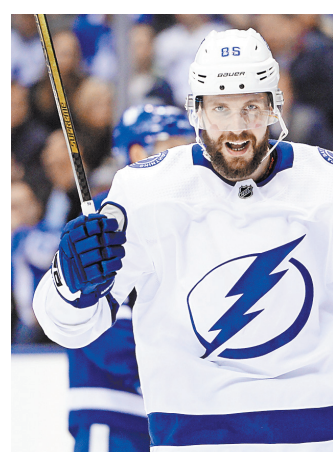
Никита Кучеров закончил сезон в «Тампе», но может помочь сборной России на чемпионате мира.

Но в плей-офф произошли удивительные метаморфозы. «Жаке́ты» с ходу ввязались в два голевых матча, наглухо закрыв лидера «Тампы» Никиту Кучерова. Форвард выдал шикарный сезон, набрав в «регулярке» 128 очков и побив казавшийся вечным рекорд Александра Могильного для россиянина в НХЛ. 26 лет назад Могильный, напомним, выиграл 127 баллов по системе «гол плюс пас». Но в Кубке Стэнли Кучеров не показал ничего. Разозлившись, он грубо сыграл против соперника во втором матче и третью игру серии пропустил. Без Никиты «Тампа» тоже проиграла. А в четвертом матче, прошедшем накануне, главный бомбардир «молний» сделал две голевые передачи. Но этого было мало. Уступая 3:4, главный тренер гостей пошел ва-банк и заменил вратаря Андрея Василевского на шестого полевого игрока. После чего «Тампа» пропустила еще три гола, еще в пустые ворота. Начало этого издевательского поединка, кстати, Artemiy Panarin. В итоге 7:3 в матче, и фаворит с треском вылетает из плей-офф.