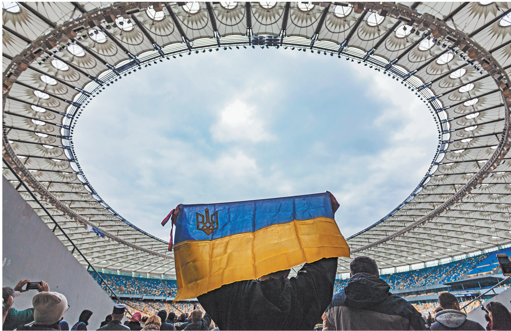
Украинцы уже начали бронировать места на стадионе «Олимпийский», где 19 апреля пройдут дебаты.