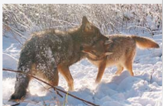
ВОЛКИ В ДЕЛЬТЕ ВОЛГИ 7 стр.