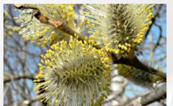
ПАСХА И ВЕСНА 23 стр.