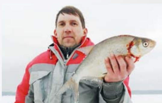
ЛЕЩ ИЗ ЛУНКИ 15 стр.