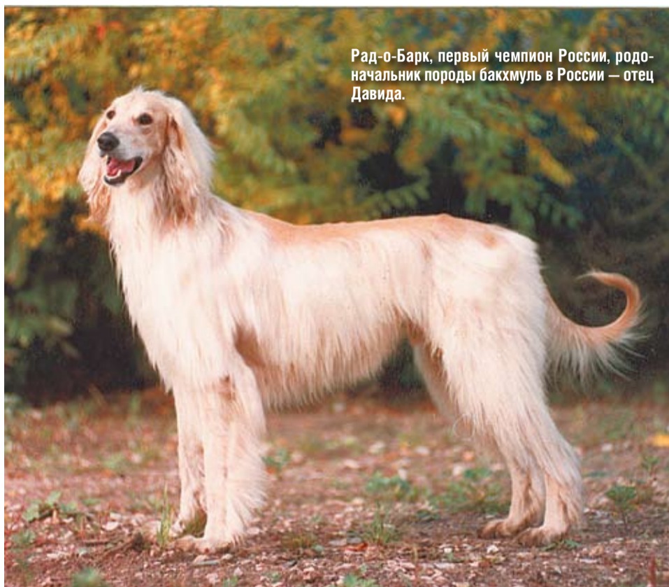
Рад-о-Барк, первый чемпион России, родоначальник породы бакхмуль в России — отец Давида.