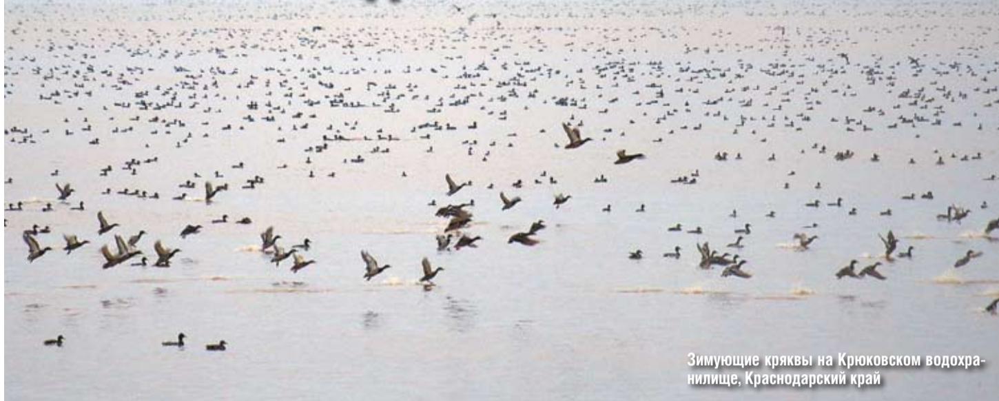
Зимующие кряквы на Крюковском водохранилище, Краснодарский край

Результаты исследований, в том числе по охотничьим птицам, не всегда уместно сразу выносить на суд широкой общественности. Часто эти итоги рассматриваются как промежуточные, требующие дальнейшего анализа и обсуждения с коллегами.