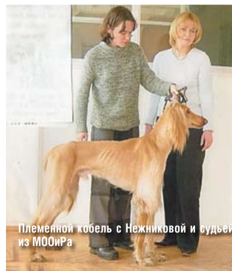
Племенной кобель с Нежниковой и судьей из МОИРа