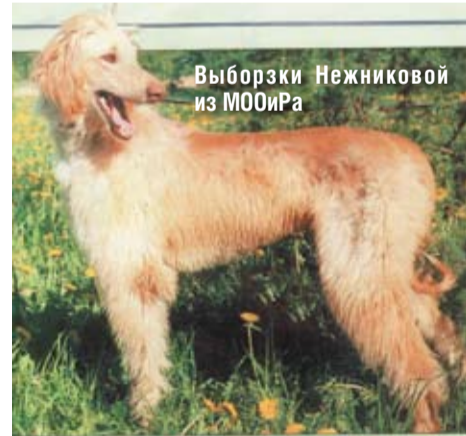
Выборзки Нежниковой из МОИРа