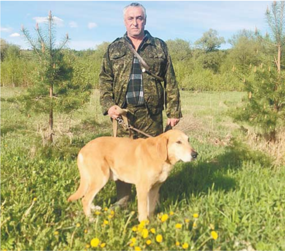
Фото Евгения ВОРОБЬЕВА

Сегодня хотелось бы рассказать о русском охотнике-гончатнике Евгении Сергеевиче Воробьеве.