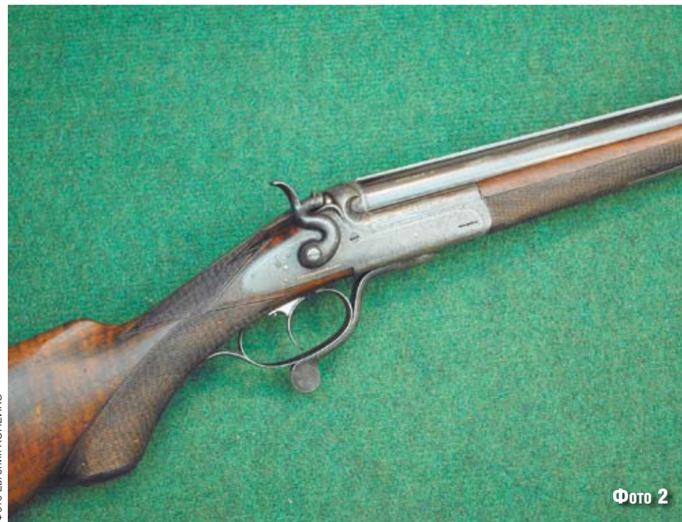
Фото 2

Бывают и другие подделки под фирменное оружие, распознавать которые приходится не только по сохранившейся маркировке и другим обозначениям, чего не всегда хватает, но и по времени преобразования фирмы, что весьма важно, а также изменения названия. Конечно, требуется соответствующий опыт и доскональные знания, но это обобщенные принципы идентификации. Но так можно и опознать нелегитимный предмет, признаки которого раскрывают истинный период производства, с которым не совпадает предполагаемое время работы фирмы, и сберечь собственные средства.