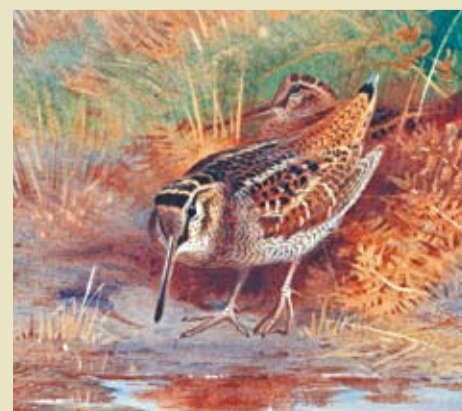
Иллюстрация Арчибальда ТОРБЕРНА