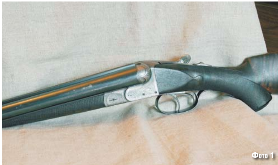
Фото 1

Требование к вопросам простое и только одно: точная, полная формулировка. На вопросы читателей отвечает наш консультант Евгений Геннадьевич КОПЕЙКО. Вопросы и ответы нумеруются в порядке возрастания из номера в номер «РОГ», что в дальнейшем позволит быстро найти нужные сведения.