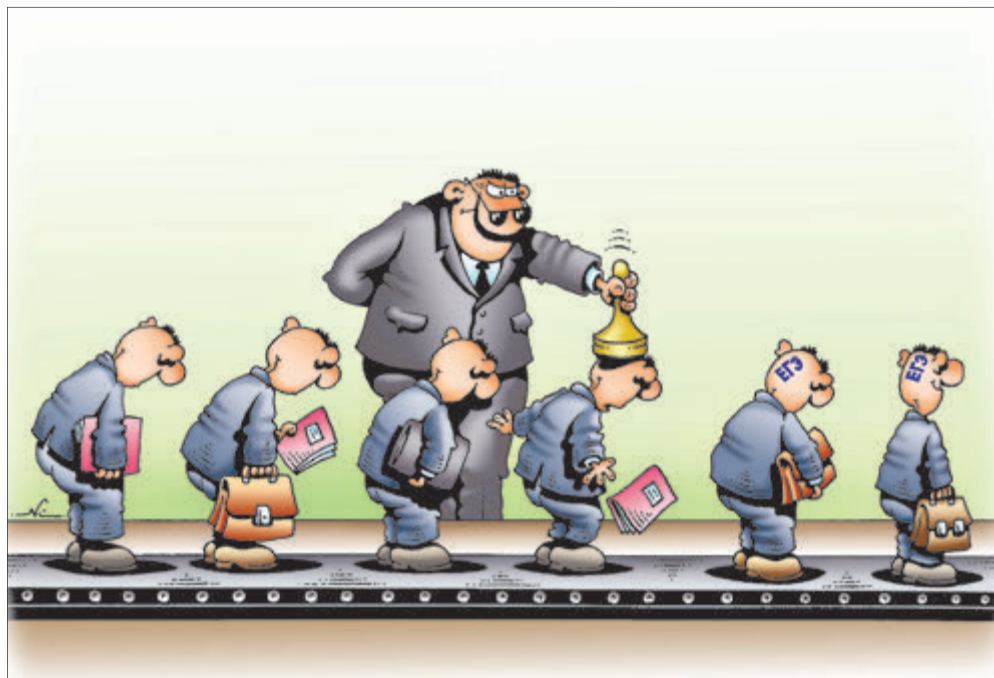
ИЛЛЮСТРАЦИЯ ИГОРЬ КИЙКО (ARTOOBANK)

Как объяснить провал? Говорят, виноваты гаджеты и... решебники (ужасное слово!). Ученики, поставившие на службу электронные шпаргалки, не знают элементарных основ, зачастую даже таблицу умножения. И как их винить, если в обычных школах на алгебру отводится всего три часа в неделю, на геометрию – два. С введением ЕГЭ учителя заняты натаскиванием учеников на уровень В, чтобы как можно больше школьников набрали минимальный балл. Результаты экзамена прямо влияют на заработки педагогов и даже на показатели эффективности работы губернатора. В прошлом