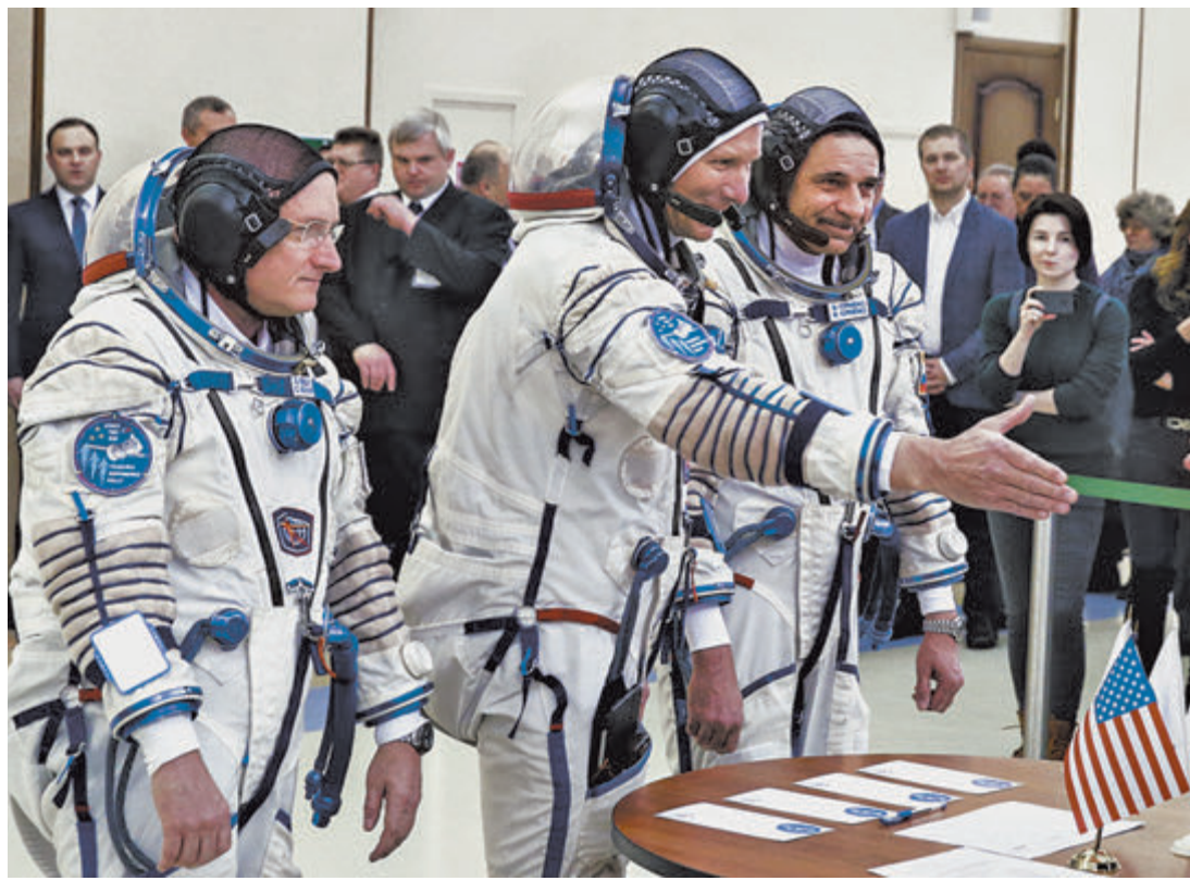
Американский астронавт Скотт Келли и российские космонавты Геннадий Падалка, Михаил Корниенко готовы бить рекорды.

До зачисления в отряд Падалка был военным летчиком. Прямою, он готов рубить и неприятную для начальства правду-матку. Два