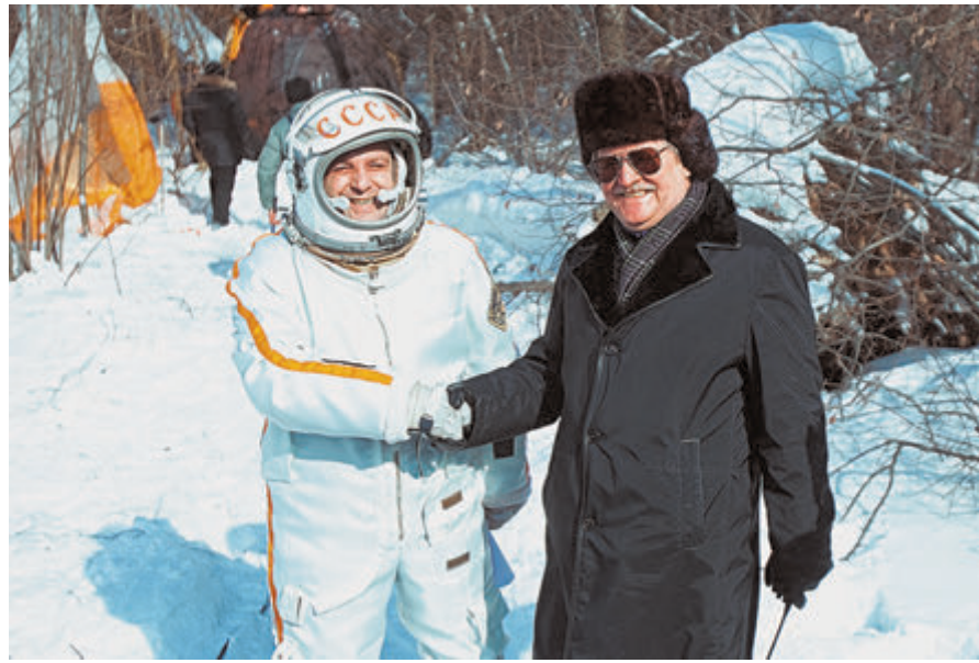
Юрий Кара на съемочной площадке фильма «Главный».

– Первый фильм мы сделали вместе. Работали слаженно и продуктивно. Студия даже предложила выдвинуть «Королева» от Украины на «Оскар». Но в украинском Минкульте под предлогом того, что фильм снят на русском языке, выдвижение за-