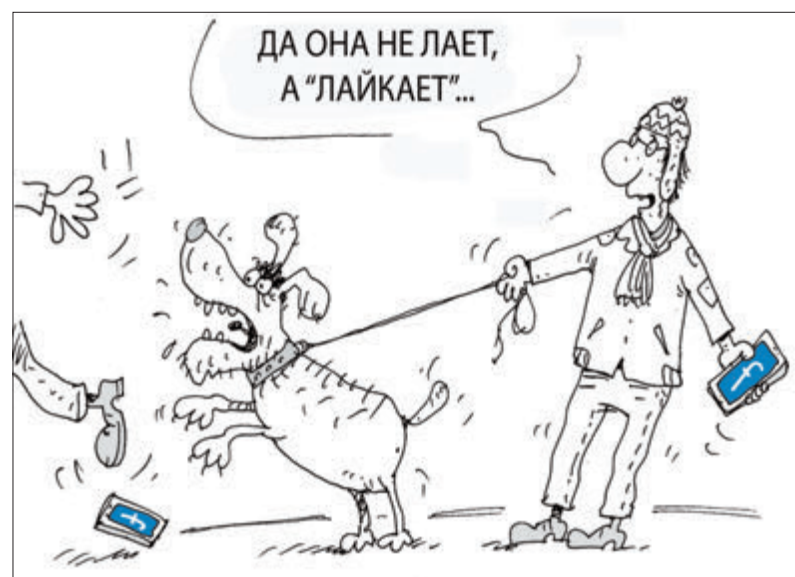
ИЛЛУСТРАЦИЯ СЕРГЕЯ ПАНКРАТОВА

В Германии резко возросло количество неплатежей за пользование смартфоном. Должники – молодежь до 25 лет. Попав в разряд злостных неплательщиков, они выкручиваются по-разному. Одни обращаются за помощью в бюро по долгам, другие же пускаются во все тяжкие, пока фирма не отключит связь, потом заключают договор с другой компанией, с третьей... Такие современные кошки-мышки с предсказуемым финалом. Предпринимчивый юноша из Ганновера, когда ему перекрыли кран в четырех фирмах, умудрился оформить контракт на... своего деда. Представьте изумление дедули, когда ему, всегда скуповатому и щепетильному в расчетах, выкатили огромный счет за скачанные игры, музыку и порносюжеты.