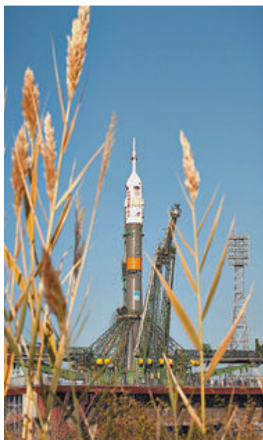
«Союз ТМА-16М» на стартовой площадке.

Американские СМИ уделяют полету особое внимание. Ни один астронавт США никогда прежде не улетаел в космос так надолго. Для Америки это важный шаг, особенно учитывая вполне возможный пилотируемый полет