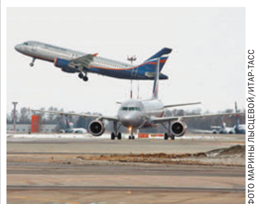
Аэробусы A-320 компании «Аэрофлот» на новой взлетно-посадочной полосе в аэропорту Шереметьево.