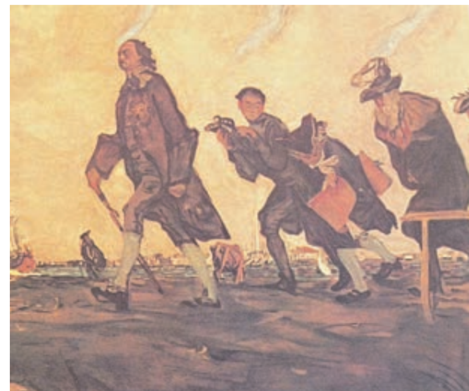
ИЛЛЮСТРАЦИЯ ИЗ ОТКРЫТЫХ ИСТОЧНИКОВ

Куда там мы со своими нынешними жалобами на ЖКХ и самодурство чиновников! Вот раньше... За выброшенный в Неву мусор злоумышленника били кнутом и ссылали на каторжные работы. А для того чтобы собрать камень для мощения улиц и проплектов, городские власти обложили всякого едущего и плывущего специальной податью: все подводы с товарами и хлебом, каждое судно, приходящее к пристаням, обязаны были сдать в общий котел определенное количество диких камней, из которых потом и сооружались мостовые. С подвои полагалось по три камня, с корабля – от 10 до 30 штук. А с тех, кто не довел, взымали за каждый недостающий камень по 10 гривен – огромные по тем временам деньги!