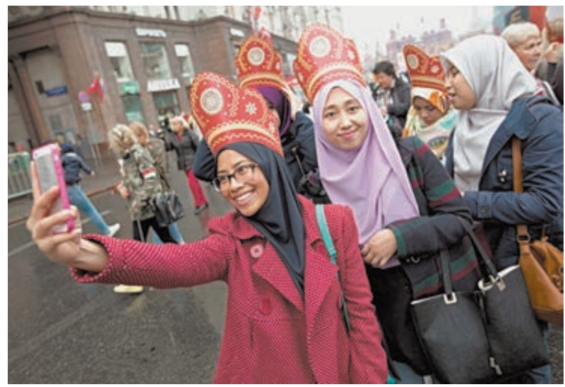
Несмотря на дождь, настроение гостей на Дне города было солнечным.

Что нужно современному туристу? Пешеходные зоны, парки, гостиницы, музеи, кафе. Конечно, удобный транспорт, понятные уличные указатели, туристическая полиция, которая может помочь. Да и город должен быть чистым и красивым. Именно за эти вопросы активно взялись в Москве несколько лет назад. Сегодня она на равных конкурирует с ведущими мировыми