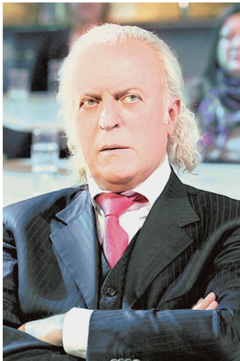
Илья Резник хочет разобраться в этом вопросе...

Или другая, поразившая своим цинизмом история, случившаяся в 2010 году. Тогда РАО предъявило претензии органи-