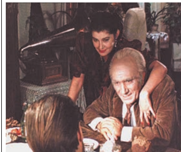
Вот и Горбатый обещал Шарипову: «Чик – и ты уже на небесах...»

Процедура предстоит непростая. При подаче в суд заявления о собственном банкротстве нужно предъявить подробный список своих кредиторов – и перечень собственных должников. Отдельно составить документ о своих долгах государству: неуплаченные налоги,