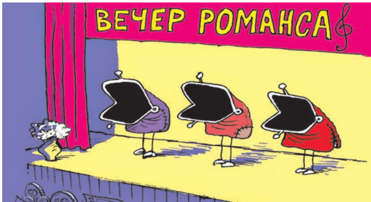
ИЛЛЮСТРАЦИЯ ДУБИНИНА ВАЛЕНТИНА, CARTOONBANK.RU

Как показали исследования и расчеты независимых экспертов, прожиточный минимум в России занижен по крайней мере в полтора раза. Это подтверждают и многочисленные интернет-комментарии наших бедствующих сограждан, которые на форумах, в социальных сетях горько рассказывают о своем житье-бытье. Вот лишь одно из таких писем: «Живу в Алтайском крае. Средний доход на человека в нашей семье – 15 тысяч рублей. Я не обедаю, просто не хватает на это денег. В последние два года нет возможности купить зимнюю одежду, обувь (донашиваем, латаем). Не ездим в отпуск. Да и по вечерам, и в выходные никуда не ходим. Хватает только на обязательные платежи и на еду. А потому 15 тысяч на человека – это и есть самый настоящий порог бедности. Мария».