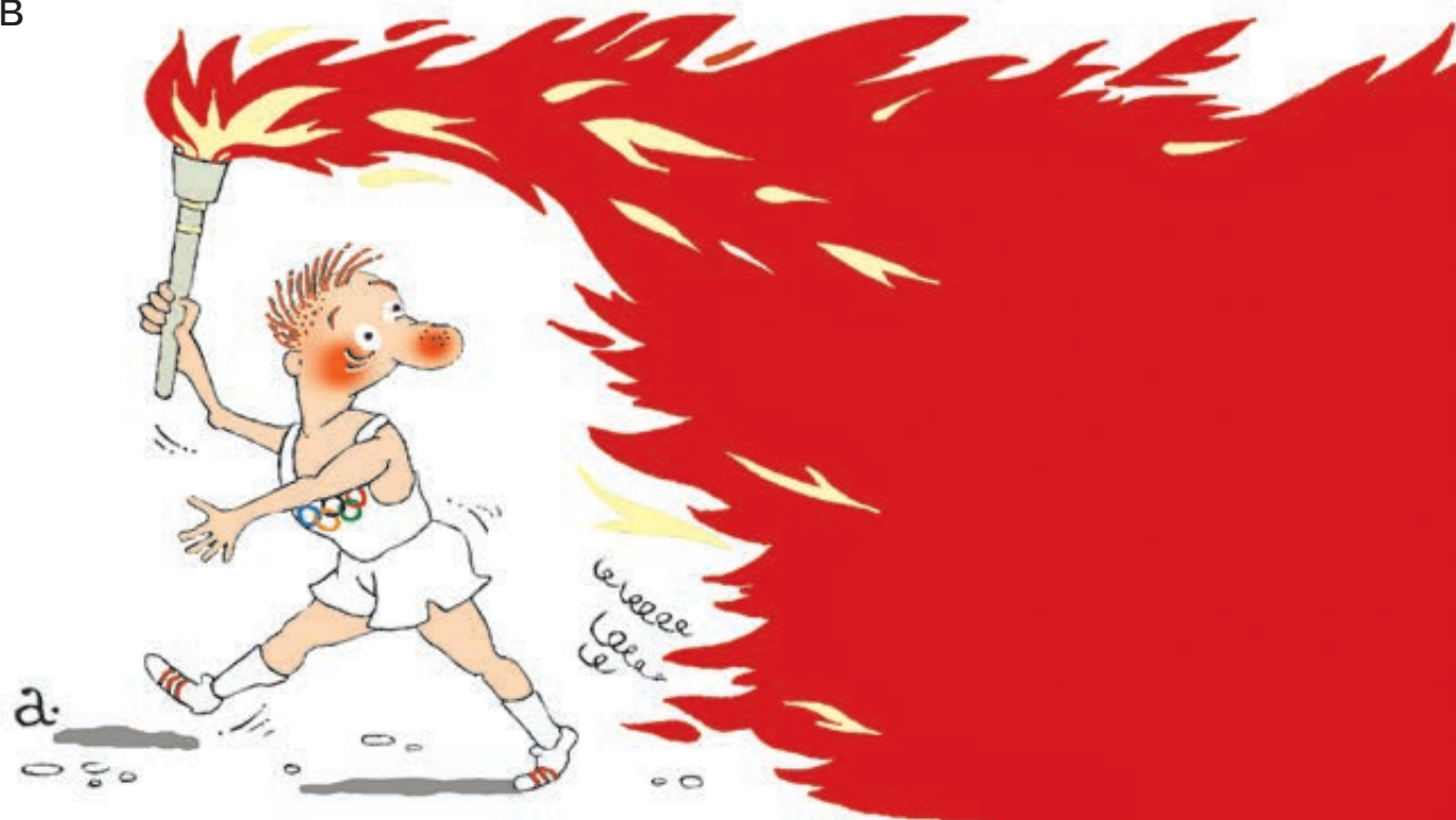
ИЛЛЮСТРАЦИЯ СЕРГЕЯ КОЗЛОВА/ВАСИЛИИ АЛЕКСАНДРОВ

Можно, конечно, порвать в очередной раз рубаху на груди: сами виноваты, не надо было есть все эти мельдонии горстями. Но вот что интересно: поговорил с двумя коллегами по цеху спортивных журналистов из «Чистой», как стеклышко, Европы, где о допинге вообще никогда не слышали. И у тех в голосе больше озабоченности, чем радости и торжества. Не про шансы на медали рассуждают, как в былые времена, а про то, что останется от спорта вообще и от олимпийского в частности. И вопрос этот витает в воздухе.