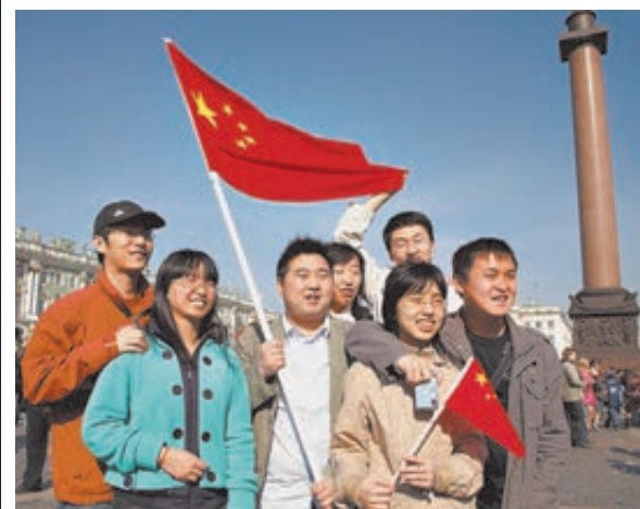
Китайские туристы отправляются по музеям Санкт-Петербурга.

«Очень много русских женщин рожают сейчас, не выходя для этого замуж. Потому что для детей в России все бесплатно, если у них нет