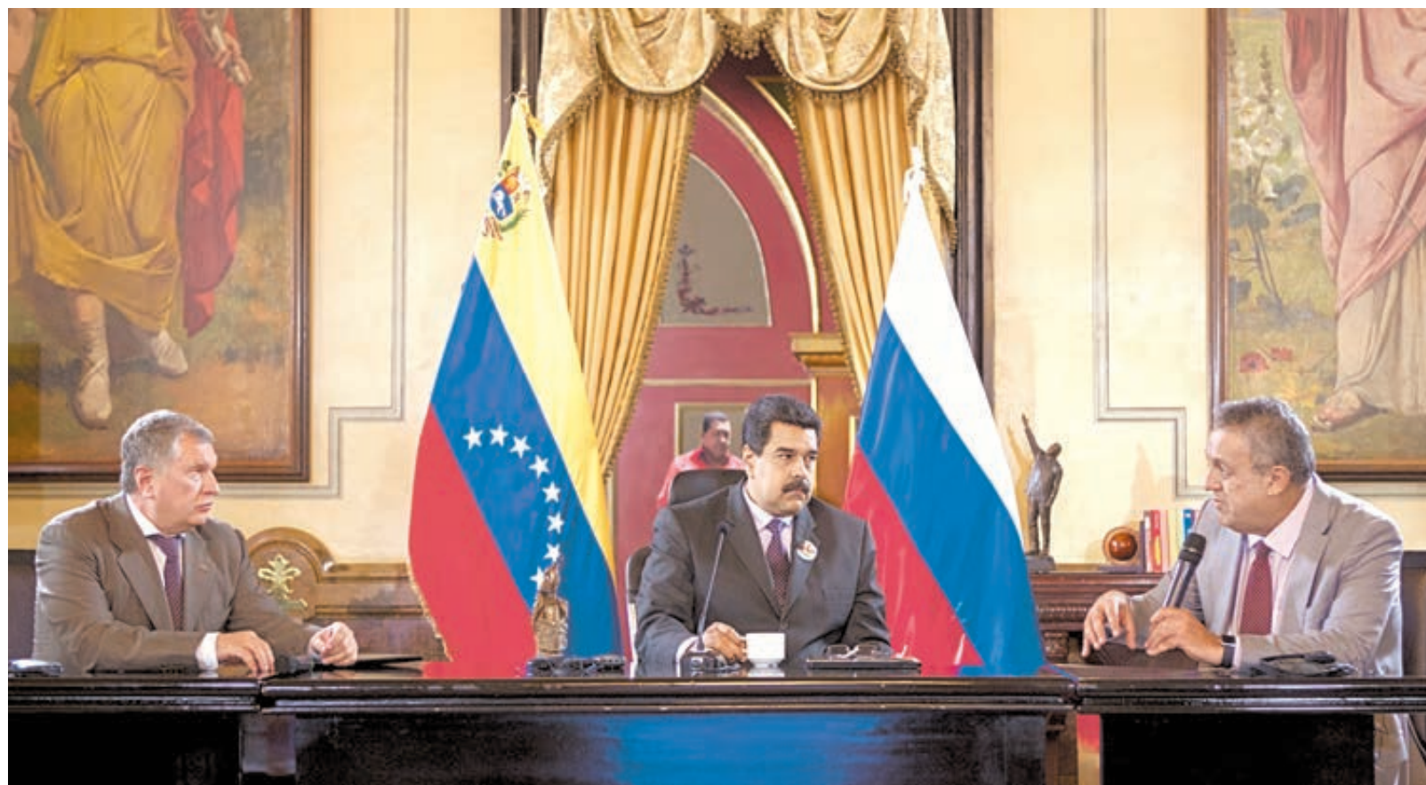
В ходе визита Игоря Сечина «Роснефть» и PDVSA в присутствии президента Николаса Мадуро подписали в Каракасе ряд документов, направленных на расширение стратегического сотрудничества.

В ходе визита Игоря Сечина «Роснефть» и PDVSA в присутствии Николаса Мадуро подписали в Каракасе ряд документов, направленных на расширение стратегического сотрудничества между компаниями. В том числе был заключен договор о проведении технико-экономического обоснования (ТЭО) проекта разработки и эксплуатации блоков Патао, Мехильонес и Рио Карибе на шельфе Венесуэлы. Документ подписан в продолжение ранее достигнутых договоренностей о создании совместного предприятия (СП) для работ на месторожде-